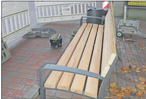
Neu in der Straße: Bänke zum Verweilen werden montiert.

Glücklich macht der - anders, als sein Name vermuten lässt - ziemlich plietsche Bauern-