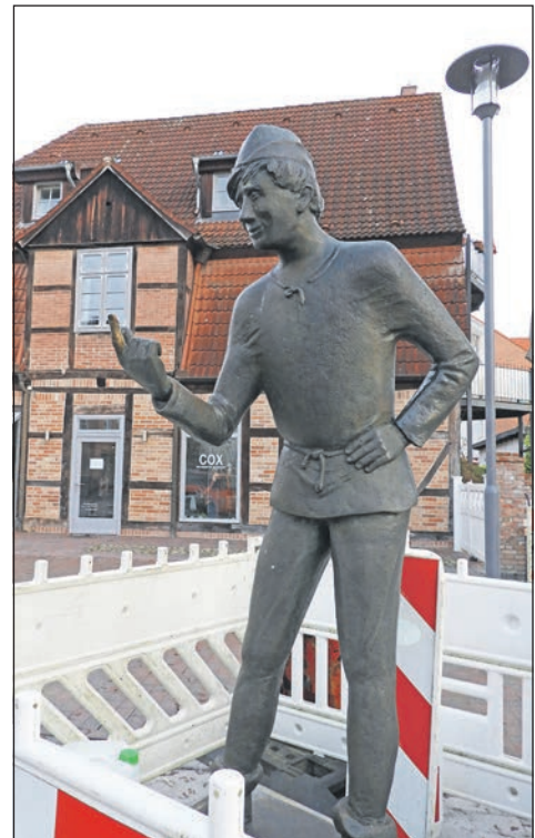
Er ist zurück: Seit 30 Jahren steht der Dumm Hans auf dem Wilhelm-Wisser-Platz.