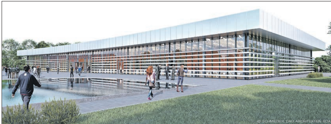
Die Großküche des neuen Wirtschaftsgebäudes wird täglich durchschnittlich 700 Personen versorgen. © Schmieder, Dau, Architekten, BDA

Eutin (t). Die Polizeidirektion für Aus- und Fortbildung und für die Bereitschaftspolizei (PD AFB) Eutin erhält ein neues Wirtschaftsgebäude mit Großküche und Cafeteria für die tägliche Verpflegung von bis zu 1.200 Polizistinnen und Polizisten. Dafür investiert das Land Schleswig-Holstein 13,6 Millionen Euro in den Neubau, der unter der Leitung der Gebäudemanagement Schleswig-Holstein AöR (GMSH) entsteht. Die Fertigstellung ist für Sommer 2022 geplant.