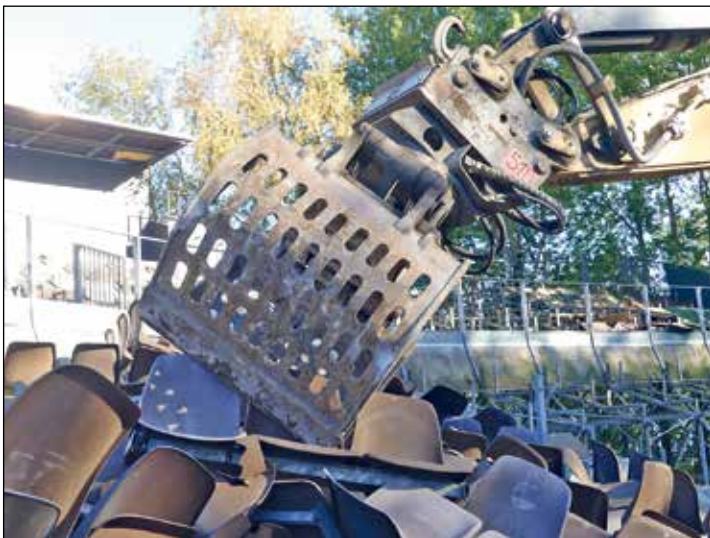
Die am besten Erhaltenen der sehr in die Jahre gekommenen Sitzschalen haben bei Eutin 08 im Waldeck ein neues Zuhause gefunden.

wie üblich in der Onkologischen Tagesklinik. Tagesordnungspunkte sind unter anderem Wahlen des/der ersten Vorsitzenden, des Kassenwarts, des Kassenprüfers und von Beiratsmitgliedern. Alle Mitglieder des Vereins sind herzlich eingeladen.