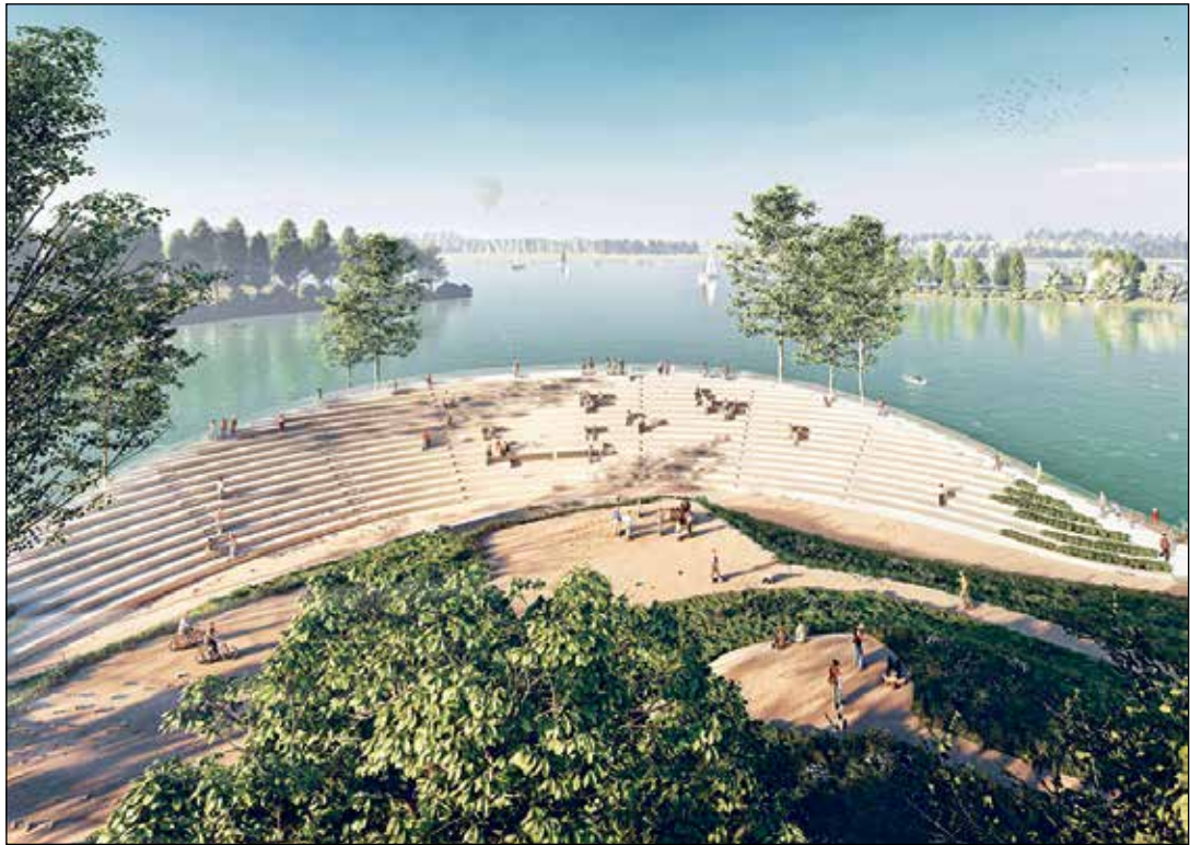
Und so soll sie aussehen, die neue Festspieltribüne, auf der im Sommer 2024 wieder Oper, Konzerte und Co Platz finden.