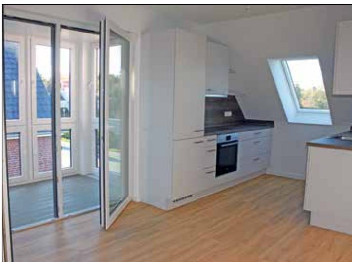
Blick auf die hochwertigen Einbauküchen und den Zugang zum Wintergarten. Die Verglasung sorgt für Extra-Schallschutz.

neu nach Neustadt ziehen und in der Küsten-Residenz nunmehr die gewünschte luxuriöse Wohnungs-Unterkunft in zentraler Lage und in direkter Nähe zum Hafen gefunden haben.