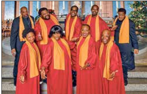
Mit Live-Band im Advent zu Gast in Berlin: Die weltberühmten Harlem Gospel Night Singers mit ihrer legendären „Christmas Show“

in Best-Lage von Berlin direkt in der City-West und in der Nähe von KaDeWe und Ku'Damm mit viel Freizeit zum weihnachtlichen Shopping-Bummel und zum Besuch der traumhaften Berliner Weihnachtsmärkte