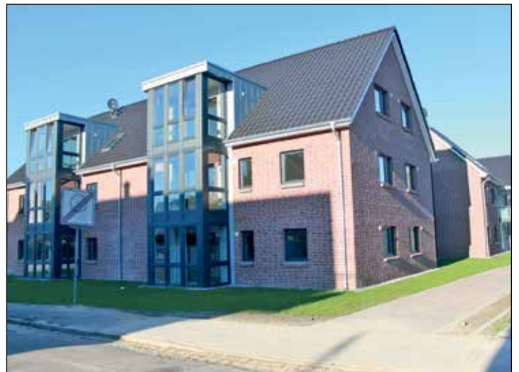
Premium-Lage mit schneller Anbindung zur Autobahn und zum Stadtzentrum mit eigener Bushaltestelle vor der Tür.

Neustadt (t). Jetzt ist alles fertig: Nach über dreijähriger Planungs- und Bauzeit (der reporter berichtete) und einer Investitionssumme von 5 Millionen Euro wurde am vergangenen Mittwoch in Neustadt an der Eutiner Straße in der Küsten-Residenz die geplante Schlüsselübergabe vollzogen. Wo bis vor wenigen Jahren mitten in Neustadt in absolut prominenter Lage noch Kühe im Sommer auf den Wiesen grasten, konnte nunmehr mit einer „absoluten Punktlandung“ exakt zum Einzugstermin der Mieter zum 1. November die Küsten-Residenz eröffnet werden.