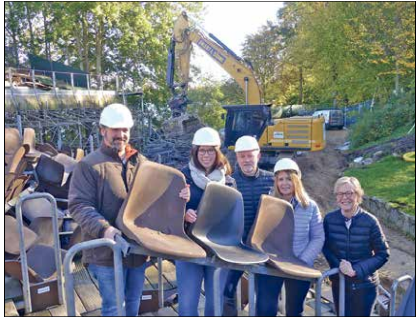
Ein bisschen Wehmut und ganz viel Vorfreude bei den Beteiligten von Stadt, Festspielen und Schloss Eutin.