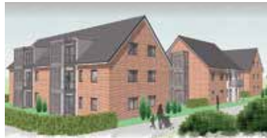
Anzeige | Verlags-Sonderveröffentlichung

lin, wo die neue Gross-Revue „Arise“ jeden Abend für Begeisterungstürme sorgt. Karten in allen Preislagen stehen zur Buchung zur Verfügung. Anmeldungen zur Berlin-Sonder-Reise sind ab sofort möglich bei den Reporter-Leser-Reisen des Burg-Verlages in Eutin unter Telefon 04521/701130 oder direkt per Mail unter leserreisen@der-reporter.info .