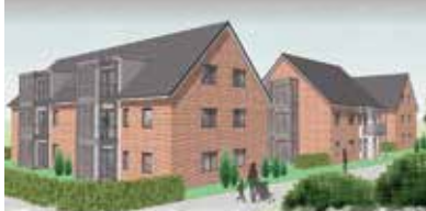
Anzeige | Verlags-Sonderveröffentlichung