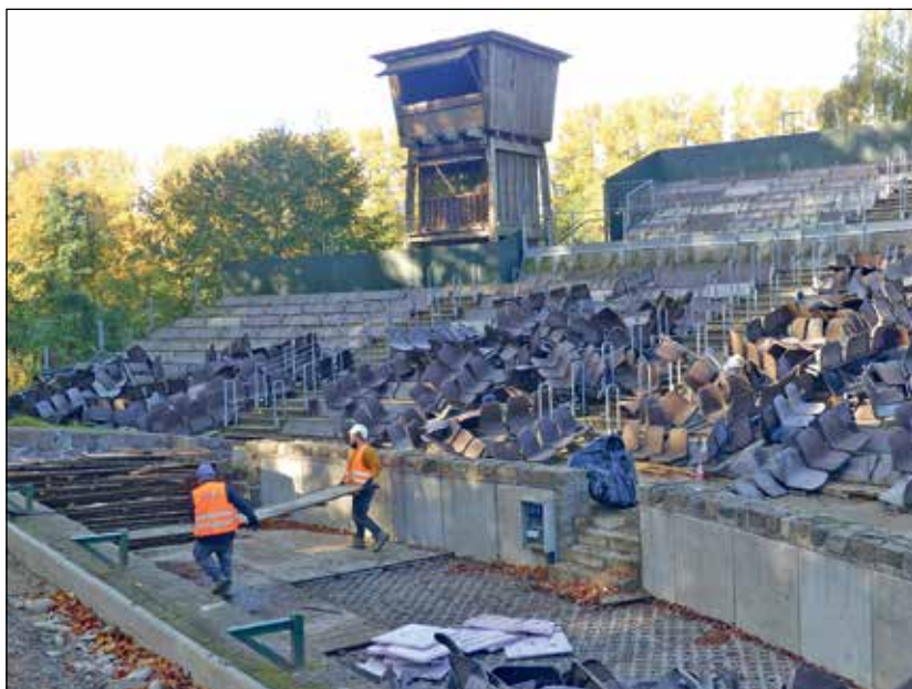
Mit der Bühne, deren Ausrichtungen im Zuge des Neubaus der Tribüne etwas korrigiert wird, damit auch vom äußersten Rand der Tribüne alles zu sehen ist, wird auch der Orchestergraben etwas versetzt und dafür erstmal aufgelöst.

Auch der Grüne Hügel wird verstärkt und ein bisschen anders angelegt – denn bisher war die Bühne nicht mittig auf die Tribüne ausgerichtet gewesen, das soll jetzt korrigiert werden. Sie wird wie der Orchestergraben auch leicht gedreht und zentriert auf die Tribüne ausgerichtet, sodass auch die Sichtachse vom äußers-