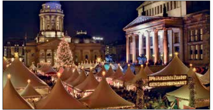
Die imposanten Berliner Weihnachtsmärkte im Advent zählen zu den schönsten in Europa.

Weihnachtsmärkte mit ganz besonderem Flair. Eine große Stadtrundfahrt mit fachkundiger Reiseleitung „mit Herz und Schnauze“ am Sonntag vormittag ist zum Sonderpreis von nur 15 Euro zubuchbar. Als musikalische Höhepunkte am Samstag abend können unsere Leser sodann eine fantasti-