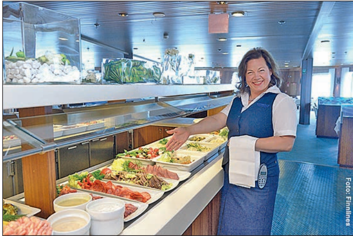
Kulinarisch rundum verwöhnt werden unsere Leser an Bord mit dem großen Buffet- und Getränke-Schlemmer-Paket

ßen Sie an Bord die skandinavische Gastfreundschaft während Sie in den beiden stilvollen Fin-