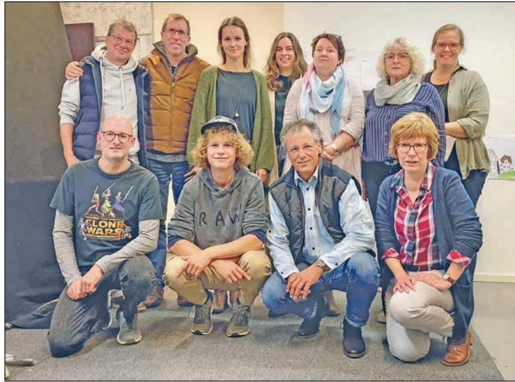
Die Mischpoke ist bereit für das Weihnachtsmärchen: Der Vorverkauf beginnt heute.

Zauberlehrling Baris tötet versehentlich den Drachen des Zauberers Uret. Daraufhin wird er hinausgeworfen und mit einem Fluch belegt. Das Königreich der Prinzessin Lea treibt er an den Rand des Ruins und merkt bald, dass er nicht nur den Menschen Leid und Kummer bringt, sondern auch, dass seine Seele leidet. Er meidet künftig die Men-