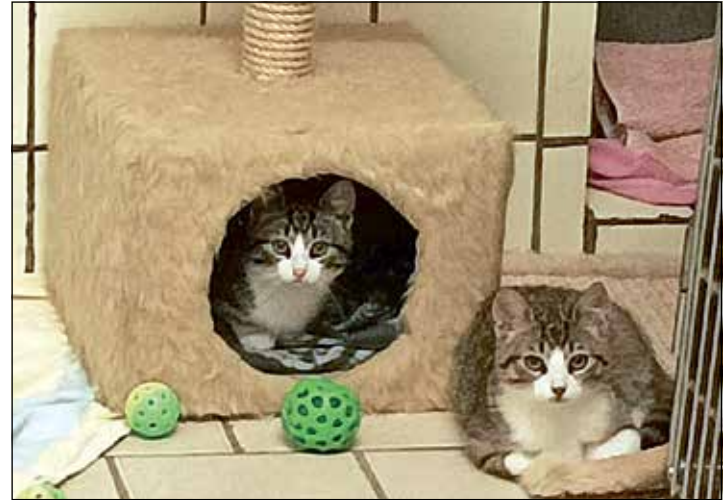
Zwei von vier munteren Kitten, die im Tierheim auf ein neues Zuhause warten.

Dieckstauen 5 · Eutin · Telefon 0 45 21 / 7 36 44