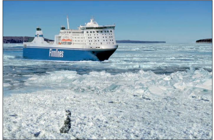
Auf großer Eisfahrt mit Finnlines-Jumbofährschiffen reisen die Reporter-Leser nach Helsinki

der 30-stündigen Überfahrt auf der winterlich geprägten Ostsee direkt in die finnische Hauptstadt Helsinki. An Bord erwartet Sie eine entspannte Seereise inkl. reichhaltiger Vollpension mit zahlreichen Skandinavischen Spezialitäten an den großen Brunch- und Schlemmerbuffets, sowie an 2 Abenden „All-Inclusive-Getränke“. Die komfortablen Kabinen (nach Ihrer Wahl innen oder außen) bieten Ihnen ein wohnliches Zuhause mit DU/WC, Sat-TV, Föhn. Herrlich ent-