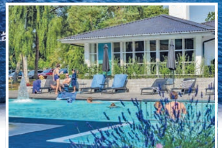
Traumhafte Hotel-Anlage mit grossem Pool direkt am Meer

Die weltberühmte Felsen-Insel in der Ostsee mit malerischen Fischereihäfen, traumhaften Sandstränden und den weltberühmten Rundkirchen erwartet die Reporter-Leser zum Top-Termin im „Goldenen September“ zum sehr günstigen Komplettpreis. Residieren werden unsere Gäste in einmaliger Lage in einem zauberhaften Kiefern-Park im sehr beliebten Bade-Hotel mit großem, beheiztem Aussenpool und sehr grosszügigen Hotel-Zimmern mit Balkon oder Terrasse in absolut ruhiger Lage am Meer und an einem der schönsten Sandstrände im Süden der Insel. Die deutschsprachige Hotel-Führung verwöhnt die Urlauber zudem mit skandinavischem Gaumen-Kitzel vom Frühstücks-Buffer bis zu den leckeren Abend-Menüs oder Buffets.