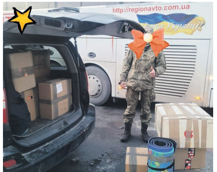
Die erste Fracht kam gut in der Ukraine an.

baut sie an einem neuem Leben, lernt Deutsch, ihre Jungs besuchen Schule und Kindergarten. Mit dem Herzen aber ist sie in der Ukraine, wo auch sonst? Ihr Mann steht an ihrer Seite, das lässt beide die Last leichter (er-)tragen. Und