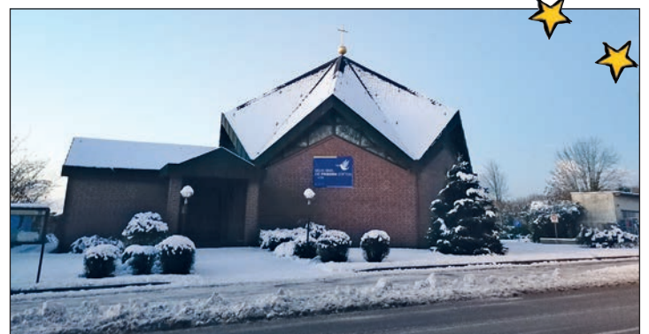
Die Neuapostolische Kirche in der Plöner Straße

zen und die Hinterlassenschaften ihrer Vierbeinern nach veraltetem Geschäft nicht einmal aufzusammeln. "Wir pflegen unser Areal selbst und auf Dauer ist es