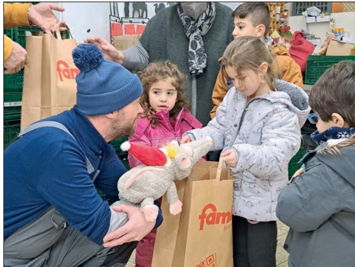
Die Kinder freuten sich über die gelungene Überraschung.