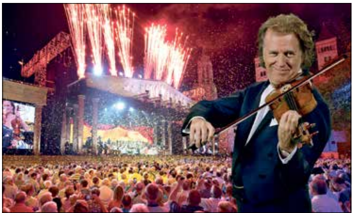
Zum großen „Walzer-Fest“ lädt Andre Rieu im Sommer in seine Heimatstadt Maastricht ein.

Eutin (t). Musik-Freunde aus ganz Europa erwarten stets mit besonderer Spannung die großen Fernseh-Gala-Konzerte im Sommer 2023 in Maastricht, wenn der Walzerkönig sich die Ehre gibt und mit einem fulminanten Gala-Konzert auf dem weltberühmten Marktplatz zum großen „Sommer-Fest im Walzertakt“ einlädt. Authentischer als nirgendwo sonst können unsere Leser erstmals den „Walzerkönig“ mit seinem großen Orchester und vielen Überraschungsgästen in seiner Heimatstadt in Holland unter dem sommerlichen Sternenzelt genießen.