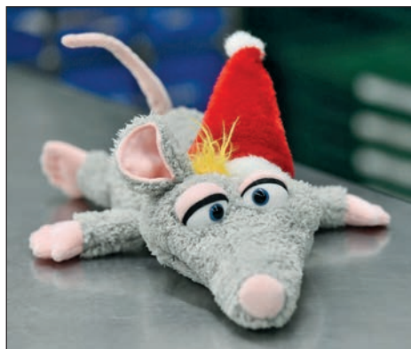
Knuffiger Weihnachtsbotschafter: Ratte Rasmus.

ches in Auftrag gegeben. Seine Idee: 200 Exemplare sollten an Kinder verschenkt werden, deren Familien zu den Kunden der Tafel zählen. Zum Übergabetermin in