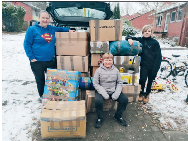
Starke Familienbande: Die verpackten Spenden wurden für den ersten Transport vorbereitet.

erzählt Oksana. Der erste Teil der Spenden ist in Tschernigiv, wo ihre Schwester lebt, angekommen und hat dort eine Bescherung für die Kinder ermöglicht. Davon berichten die Fotos. Das ist schön. Aber nichts ist gut, wo Bomben