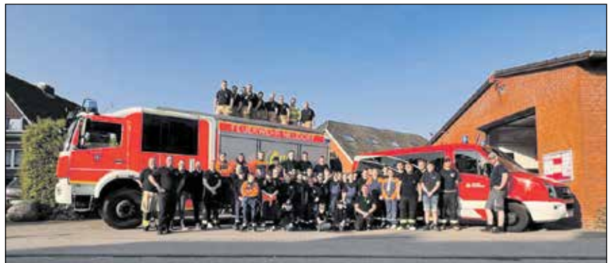
Tolle Erlebnisse und Freundschaften pflegen - das ist die Jugendfeuerwehr.

Die Jugendlichen hatten einen aufregenden Tag