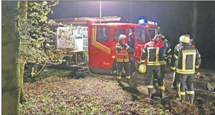
Wenn der Alarm geht...

Nicht unerwartet, denn auf solche Unterbrechungen ist man als Helfer*in immer gefasst. Am Neujahrstag 2023 ging der Alarm um 12.34 Uhr. Ein Pferd war in einen Graben gerutscht, das Stichwort lautet Technische