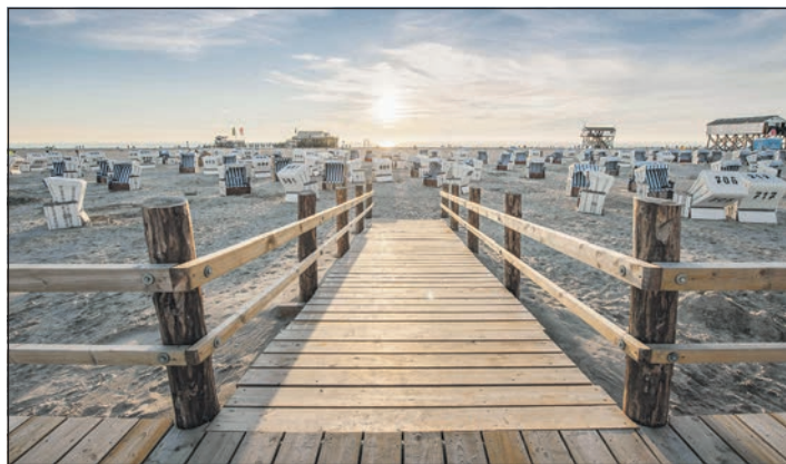
Ein traumhafter Urlaubstag am Meer erwartet unsere Leser im berühmten Seebad St. Peter-Ording mit den einmaligen Stränden

der hoch gelobten Schlemmerküche mit einem grossartigen Schleswig-Holstein-Schlemmer-Buffer mit kulinarischem Gaumenkitzel und vielen warmen