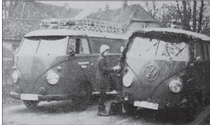
Die Fahrzeug-Modelle haben sich verändert...

Glasau (aj). Freiwillige Feuerwehr 2023 - das bedeutet: Veränderung. Die Zeiten, als es vorrangig darum ging, Feuer zu löschen, sind passé. Heute geht es zunehmend darum, als multikompetente Einheit vielen Lagen gerecht zu werden: "Unwetter, Tierrettung, Verkehrsunfälle mit Rettungsschere, die Sicherung von Gefahrgut", zählt Gemeindeführer Jörg Schapeter auf. Er ist sich sicher: "Auch vor dem Hintergrund des Klimawandels werden die Herausforderungen wachsen". Auf 35 Einsatzkräfte kann er sich aktuell verlassen, acht Ehrenmitglieder stehen für die lange Tradition der Wehr und für