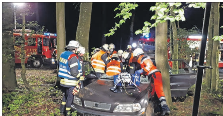
...rücken die Blauröcke aus.

Hilfe. Für die Truppe heißt das: Die Einsatzstelle finden (zu der in diesem Fall nur ungefähre Angaben vorlagen, den Bereich erkunden, die Lage beurteilen, entsprechende Schritte einleiten. Das Pferd konnte sich schließlich mit Unterstützung seines Besitzers aus eigener Kraft befreien und in den sicheren Stall geführt werden. Erfreuliches Ende eines Einsatztages, wie es für die Feuerwehr viele gibt.