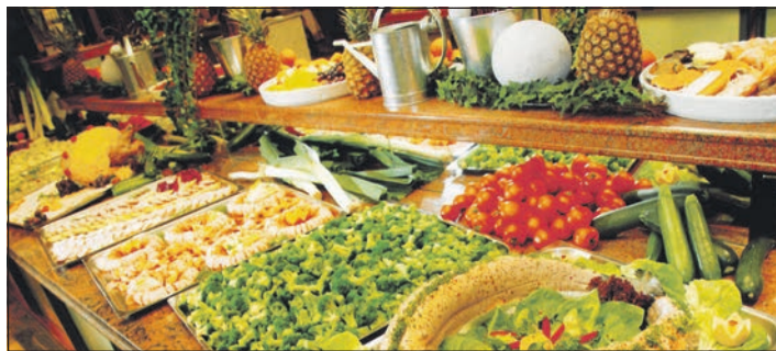
Schlemmen und genießen „ohne Ende“ können unsere Leser beim sehr reichhaltigen Schlemmer-Buffer im beliebten Fährhaus an der Eider

und kalten regionalen Spezialitäten rundum verwöhnt, dazu gibt es ein Salat-Buffer und zum Finale ein Dessert-Buffer. Alle Leistungen der großen Wattenmeertagesfahrten sind zum sehr günstigen Komplettpreis von nur 49,90 Euro ab sofort zu buchen