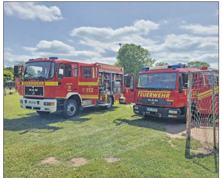
..aber nichts von ihrer Anziehungskraft eingebüßt.

werden derzeit elf Jugendfeuerwehrleute mit viel Engagement zeigt ein Blick auf die jährlichen Einsatzbilanzen.