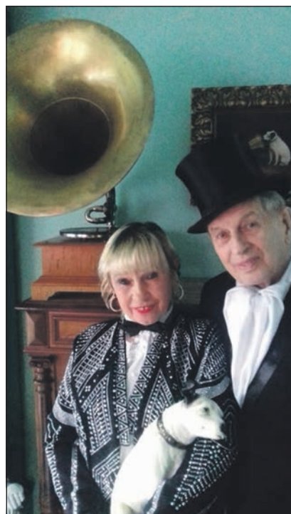
Rund um die nostalgischen Abspielgeräte geht es bei der Veranstaltung am 14. Juni im Schloss.

Karten für die Veranstaltung gibt es zu 12 Euro im Schloss-Shop und bei der Tourismus GmbH am Markt.