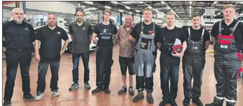
Die Ostholsteiner Auszubildenden in der Werkstatt von Auto Vidal.