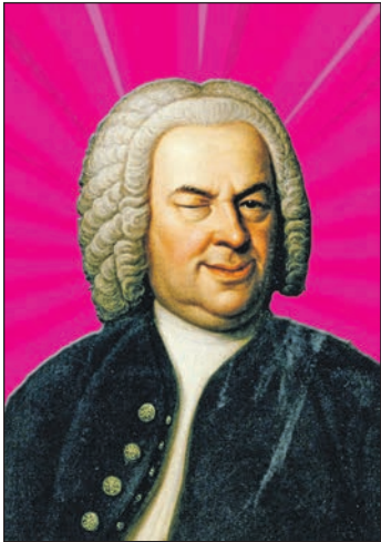
Bach mittendrin ist das Motto des Festes - passend zum laufenden Bachfest.

Eutin (t). Es ist wieder so weit: Die Evangelisch-Lutherische Kirchengemeinde Eutin lädt am kommenden Wochenende – eine Woche später als üblich – zum Michaelisfest ein. Eine Woche später, weil das Fest in diesem Jahr zugleich den Abschluss des Bachfestes in Eutin und Plön bildet. Das macht auch das Motto des diesjährigen Festes „Bach mittendrin“ deutlich. „Bach mittendrin“ – das wird am 1. Oktober gefeiert. Dazu sind kleine und große Menschen herzlich