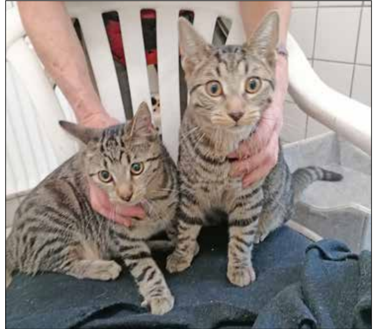
...genau wie Amigo und Avalon.

Diekstauen 5 · Eutin · Telefon 0 45 21 / 7 36 44