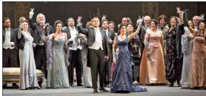
Glanzvoller Opern-Genuss in der Semper Oper erwartet unsere Leser mit Puccinis „La Boheme“.

Anmeldungen sind ab sofort möglich bei den Reporter-Leser-Reisen des Burg-Verlages in Eutin per Telefon 04521/701130, Montag bis Freitag von 9 bis 13 Uhr, oder direkt online im Internet unter „leserreisen.der-reporter.info“.