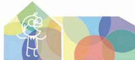
Schulverein der Schule Hutzfeld

Hutzfeld (t). Seit Jahrzehnten bereichert der Schulverein das Schulleben an der Grundschule Hutzfeld. Die Einnahmen und das Engagement des Vereins tragen maßgeblich dazu bei, eine attraktive und moderne Ausstattung zu schaffen und zu erhalten. Der Schulverein hilft bei Anschaffungen von Lehr- und Lernmitteln, zum Beispiel Bücher für die Schülerbücherei oder Kopfhörer für die Tablets. Er macht Projekte und Veranstaltungen durch finanzielle Unterstützung