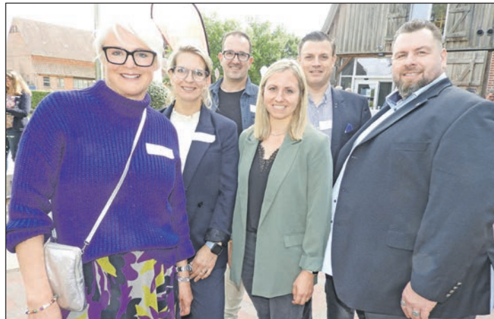
Freude über eine gelungene Premiere: Das Orga-Team der WVE.