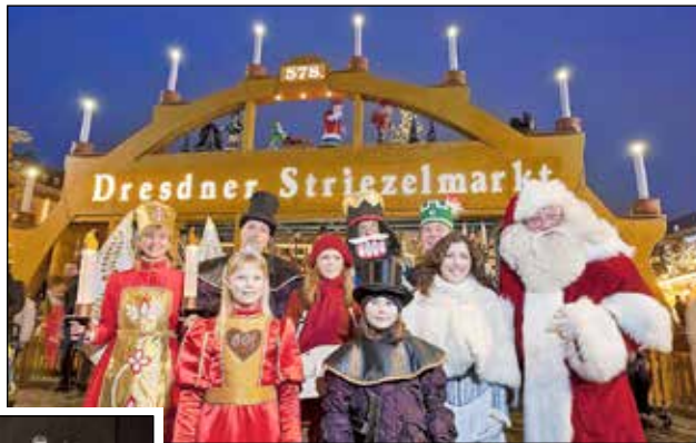
Einer der schönsten Weihnachtsmärkte in der Nähe des Reporter-Hotels ist der weltberühmte Strietzelmarkt in Dresden.

nachtag Puccinis Meisterwerk „La Boheme“ in einer in Dresden umjubelten glanzvollen Inszenierung mit der weltbekanntesten Sächsischen Staatskapelle und einem hochklassigen Ensemble genießen – Karten sind gegen Aufpreis in allen