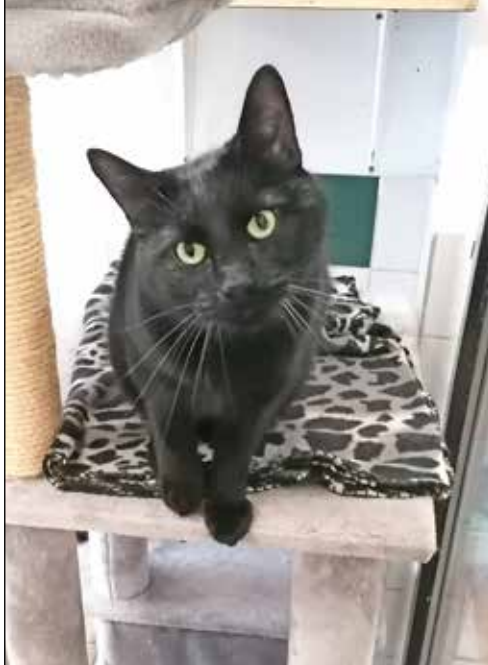
Leto ist auf der Suche nach einem neuen Zuhause...

Eutin (aj). Er ist ein echter Prachtkerl: Schwarzglänzendes Fell, stattliche Statur und glühende Augen: Leto heißt der Kater, der den Besuch nicht aus den Augen lässt und sogleich bemüht