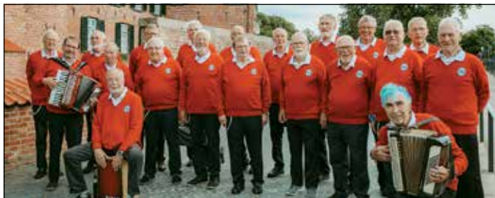
Der Eutiner Shantychor ist in der Lutherkirche zu erleben.

Eutin (t). Am Mittwoch, 29. November, um 19 Uhr tritt der Shantychor „Eutiner Wind“ in der Lutherkirche Kleinmeinsdorf auf. Der Eintritt ist frei, um eine angemessene Spende am Ausgang wird gebeten. Der Shanty-Chor „Eutiner Wind“ entstand 1999 aus einem winterlichen „Klön- und Singabend“. Das Ensemble hat derzeit 25 Mitglieder, die Auftrittsstärke liegt in der Regel