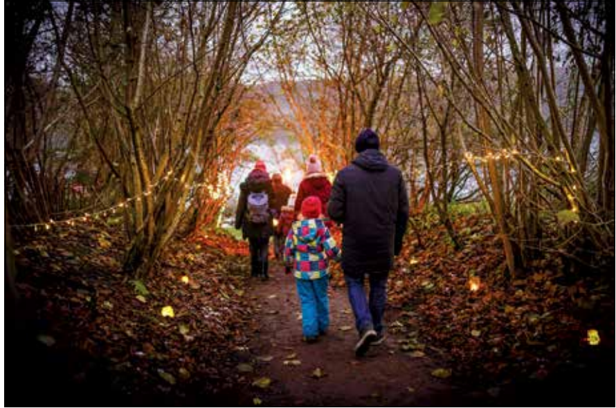
Feiern im Lichterschein – ein echtes Familienerlebnis.

Und damit nicht nur das Herz erwärmt wird, ist an allen Orten natürlich auch fürs leibliche