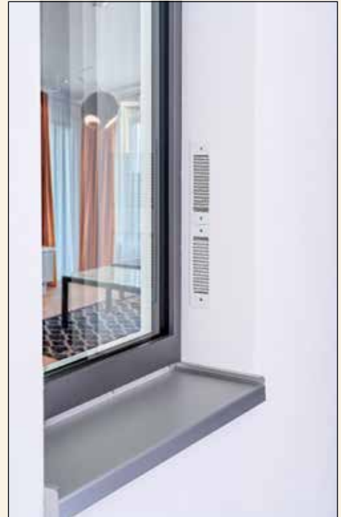
Integrierte Lüftungssysteme am Fenster ermöglichen automatisiertes Lüften mit Wärmerückgewinnung bei geschlossenem Fenster.