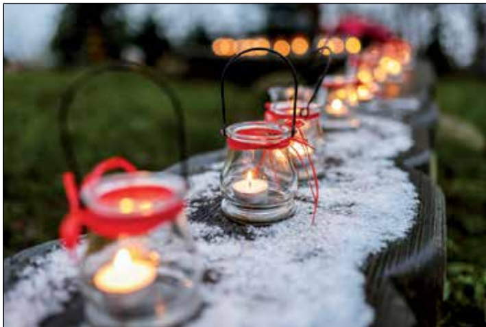
Stimmungsvoll geht es zu bei den Festen unter freiem Himmel.

Wohl gesorgt: Duftende Bratäpfel aus eigener Ernte, Stockbrot am Lagerfeuer, dampfender Kinderpunsch und leckere Waffeln sorgen für wohlige warme Bäuche und Hände.