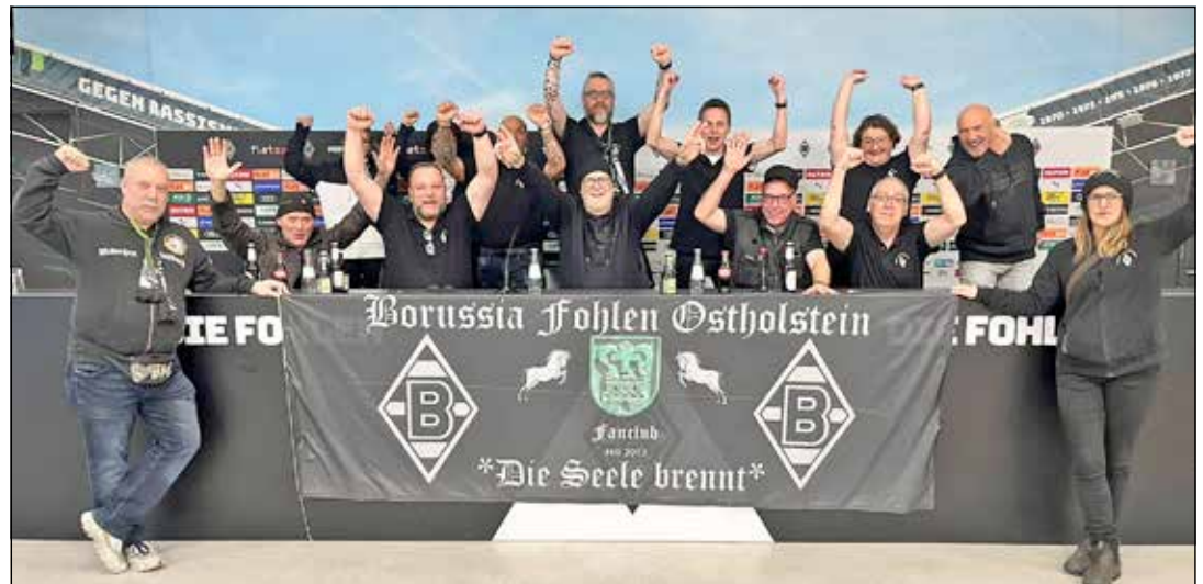
Die Ostholsteiner Fohlen-Fans sind seit zehn Jahren auf Tour zum Stadion ...

Irgendwann brauchte es etwas Größeres, etwas, wo man unter sich ist. Die Geburtsstunde der so getauften „Fohlenetränke“, ein eigenes Vereinshaus. Ursprünglich war es ein altes Schwimmbad neben dem Grundstück von Steffen Koch, heute erstrahlt dort ein Traum in Schwarz, Grün und Weiß für jeden, der es mit der