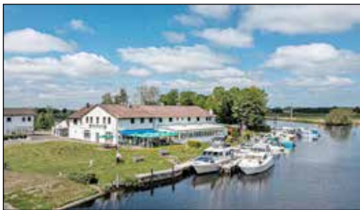
Im berühmten Fährhaus an der Eider erwartet unsere Leser das große Winter-Schlemmer-Buffer mit vielen regionalen Spezialitäten.

mit allen Beilagen sowie knusprig-leckeren Dithmarscher Spanferkel, frisch aus dem Rohr, mit vielen knackig-frischen Gemüsebeilagen aus der Eider-Region, vielfältigen Kartoffel-Variationen, Dips und Saucen sowie großem