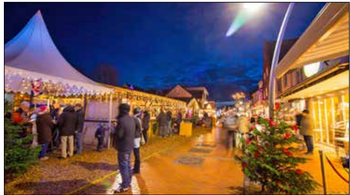
Der „Büsumer Winterzauber“ ist ein traumhafter Wintermarkt mit vielen regionalen Spezialitäten aus Dithmarschen.

und marktfrischen Salat-Buffer und zum Finale ein leckeres Eis- und Dessert-Buffer. Gut gestärkt geht der Erlebnis-Törn weiter ins mondäne Seebad Büsum, wo unsere Leser ein zauberhafter Wintermarkt im Herzen der Stadt zwischen Rat-