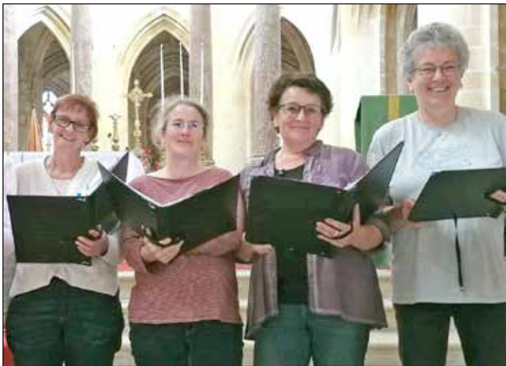
Mitglieder des Vokalensembles tragen ausgewählte Stücke vor.