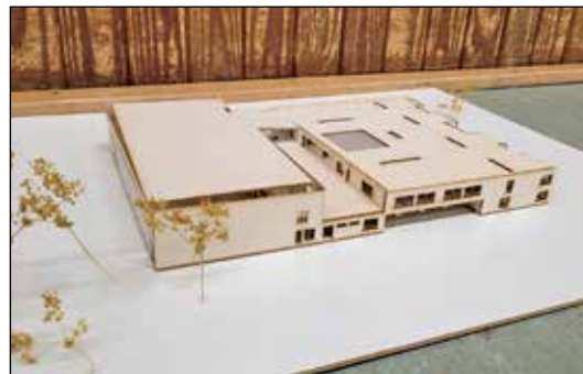
So könnte die Grundschule Süsel als Neubau aussehen