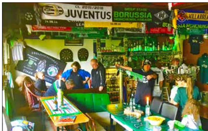
... und haben auch einen Treffpunkt in Eutin.