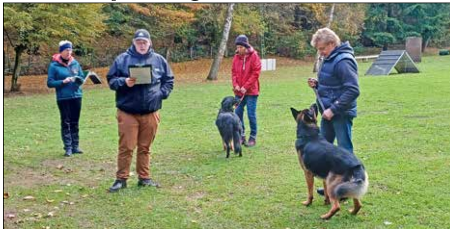
Die Teilnehmer holten sich bei den Prüfern ihre Bewertungen ab.

Eutin (t). Am 4. und 5. November ging beim Polizei- und Gebrauchshundeverein Ostholstein (PGHV-OH) die Herbstprüfung über die Bühne. 16 Teams aus Mensch und Hund hatten sich für verschiedene Disziplinen angemeldet. Frühaufsteher waren die Fährtenleger, die am Sonnabend ab 7 Uhr am Hof Gamal die Fährten legten. Zur Papier- und Chip-Kontrolle trafen die Teilnehmer um 8.30 Uhr im Vereinsheim ein. Danach ging es auch für die Teilnehmer nach Gamal. Hier warteten sieben Fährten auf die Teilnehmer. Zwei Hunde konnten sich nicht mit den Fährten verständigen und verpassten das Ziel. Danach ging es zurück zum Vereinsheim, wo noch fünf Be-