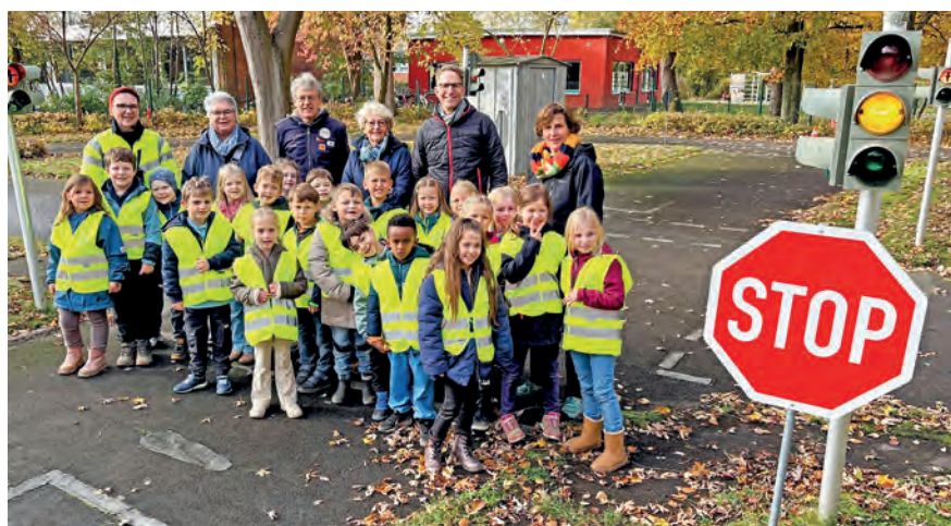
Eben noch auf dem Rad, jetzt in Reih und Glied: Fürs Gruppenfoto nahmen die Schüler der Klasse 1e der Schule am Kleinen See, eine Außenstelle der Gustav-Peters-Schule, Aufstellung mit den gestifteten Warnwesten.