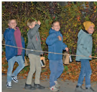
136 Kinder feierten beim Lichterfest mit.