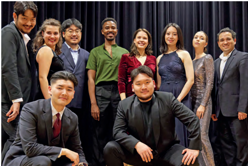
Die Gesangsklasse „Stimmen aus aller Welt“ der Musikhochschule Lübeck kommt nach Eutin.

Wer mag, besucht in der Pause oder nach dem Konzert den winterlich geschmückten Museumsshop und genießt einen duftenden Glühwein. Der Eintritt kostet 18 Euro, ermäßigt 16 Euro. Karten gibt es im Vorverkauf und an der Abendkasse im Museumsshop. Ein Ticketkauf vorab oder eine Reservierung werden empfohlen.