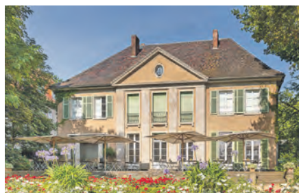
Die berühmte Liebermann-Villa am Wannsee entdecken unsere Leser mit einer Sonder-Führung.

Welt-Kunst in Potsdam mit Barberini-Museum Außerdem Liebermann-Villa und „Alte Nationalgalerie“ entdecken Eutin (t). Weltklasse-Kunst vom Feinsten genießen unsere Leser*innen auf Grund großer Nachfrage bei der Zusatz-Kunst-Weekend-Sonder-Reise direkt ab Eutin nach Potsdam und Berlin vom 7. bis 8. März 2026 zum Sonderpreis von nur 199,90 Euro mit Europas derzeit spektakulärstem Kunst-Museum in Potsdam mit dem Barberini-Museum mit der sensationellen nagelneuen