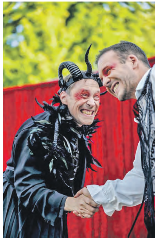
Das Globe Theater Berlin gastiert im Binchen.

Eutin (t). Am Sonnabend, 15. November, um 20 Uhr ist das Stück „Urfaust – Fragment von Goethe“ in einer Inszenierung des Globe Theater Berlin Binchen FilmKunstTheater, Albert-Mahlstedt-Str. 2, zu sehen. Damit steht ein äußerst selten gespieltes Stück auf dem Spielplan des Kulturbunds. Jahrzehnte lang galt der Text von Goethes „Urfaust“ als verschollen und wurde erst 1918 uraufgeführt. Danach hat es nur noch einige wenige weitere Aufführungen gegeben – der spätere, klassische „Faust I“ war sehr viel