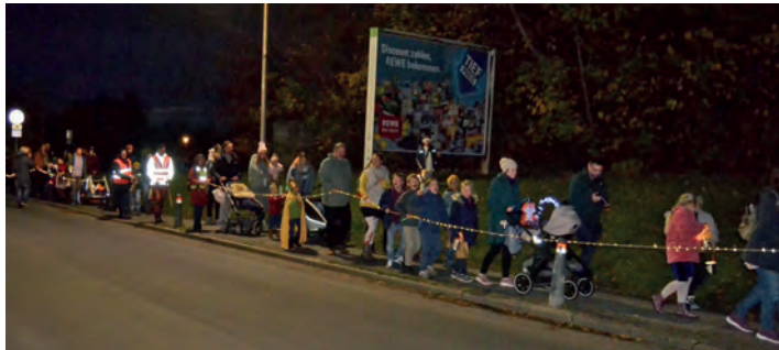
Zahlreiche Menschen waren beim Lichtermarsch dabei.