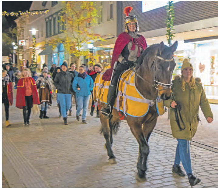
Mit Sankt Martin geht es am Dienstag durch die Innenstadt.

Eutin (t). Die evangelische und die katholische Kirchengemeinde in Eutin laden herzlich zum Martinstag ein. In diesem Jahr wird der Umzug aber etwas anders verlaufen: Los geht's am Dienstag, 11. November, um 17 Uhr in der evangelischen St. Michaelis-Kirche mit dem Martins-Spiel.