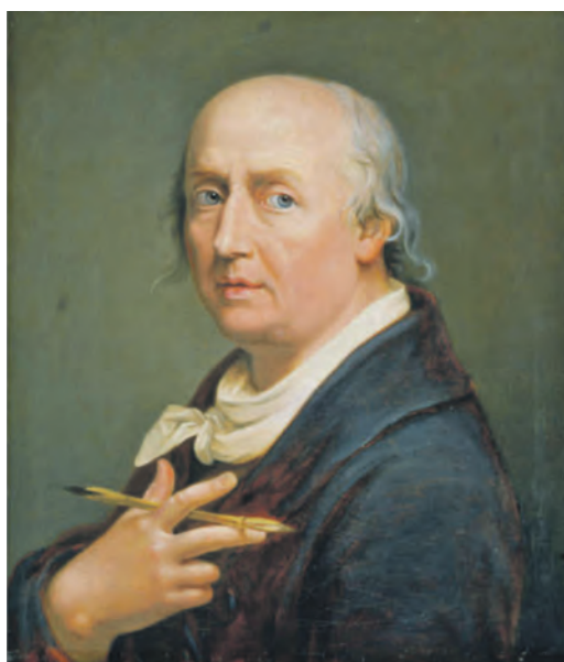
Johann Heinrich Wilhelm Tischbein hat in Eutin Spuren hinterlassen.

der Welt. Klingt spannend und dennoch läuft Tischbein in Eutin noch weitgehend unter dem Radar. Mit der Eutiner Tischbein-Gesellschaft gibt es einen kleinen engagierten Kreis, der diesen Mangel an Aufmerksamkeit kenntnisreich und mit viel Einsatz ausgleicht. Jüngstes Projekt ist ein Tischbein-Rundgang: An sechs für seine Biographie wichtigen Stationen liefert die Tour Informationen direkt auf das Smartphone. Beginnend auf dem Marktplatz, geht es zum Kavalierhaus am Witwenpalais, in die Stolbergstraße, zum Schloss Eutin und zum Ostholstein-Museum und schließlich zum Friedhof in der Plöner Straße. Auf www.tischbein-eutin.de gibt es zu allen Haltepunkten Fakten und Bildern, dazu Anekdoten