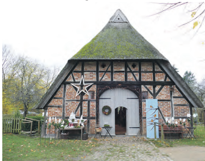
Die Ausstellung „Winterzeit“ lockt nach Bosau.

von 11 bis 17 Uhr die Ausstellung „Winterzeit“ zu erleben. Schon seit vielen Jahren bieten hier sieben Kunsthandwerkerinnen ihr Geschaffenes zum