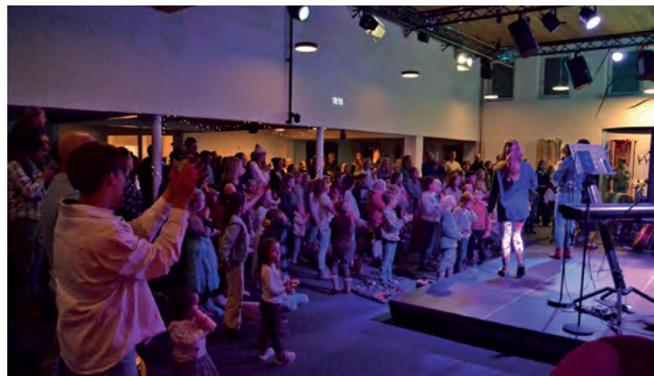
Den Auftakt beim Lichterfest machte ein Musical zum Thema Freundschaft.