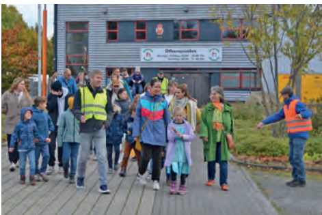
Beste Stimmung herrschte beim Lichterfest.