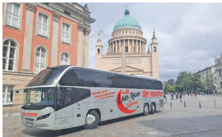
Welt-Kunst vom Feinsten erwartet unsere Leser in Potsdam und Berlin bei der großen Kunst-Sonder-Reise vom 7. bis 8. März 2026.

In der Bundeshauptstadt lockt sodann am Sonntag auf der Museums-Insel die „Alte Nationalgalerie“ mit der großen Sonder-Ausstellung „Kunst des 19. Jahrhunderts“ von Manet,