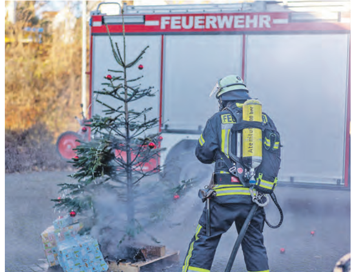
Im Brandfall gilt: Lieber einmal zu viel die Feuerwehr rufen.

In der Adventszeit steigt auch das Risiko für Wohnungsbrände spürbar an. Adventskränze und