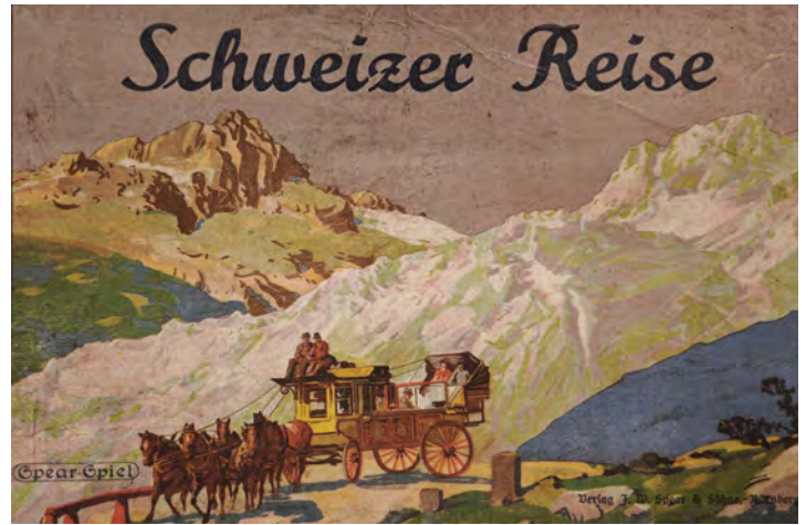
Die Schweiz ist Thema in der ELB – in einer Ausstellung und beim Spielenachmittag.

alten Drucken sind unter dem Titel „Bilder der Schweiz“ historische Landkarten, Grafiken und Spiele zu sehen. Mit Albrecht von Hallers Gedicht „Die Alpen“ (1729) wurde die Schweiz von einer Durchgangsstation für Italienreisende zu einem Reiseziel, das ein neues Erleben von Natur verhielt. Im 18. und 19. Jahrhundert erschienen in zunehmender