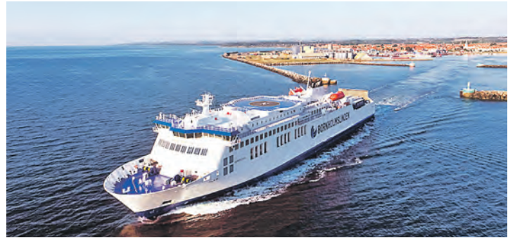
Schnell und direkt: Mit den neuen Großfähren reisen die Reporter-Leser via Rügen nach Bornholm und zurück.

Residieren werden die Gäste in einmaliger Lage in einem zauberhaften Kiefernpark im beliebten Bade-Hotel mit großem, beheiztem Außenpool und großzügigen Hotelzimmern mit Balkon oder Terrasse in absolut ruhiger Lage am Meer und an einem der schönsten Sandstrände im Süden der Insel. Die deutschsprachige Hotelführung verwöhnt die Urlauber zudem mit skandinavischem Gaumenkitzel vom Frühstücksbuffet bis zu den leckeren Abendmenüs oder -buffets.