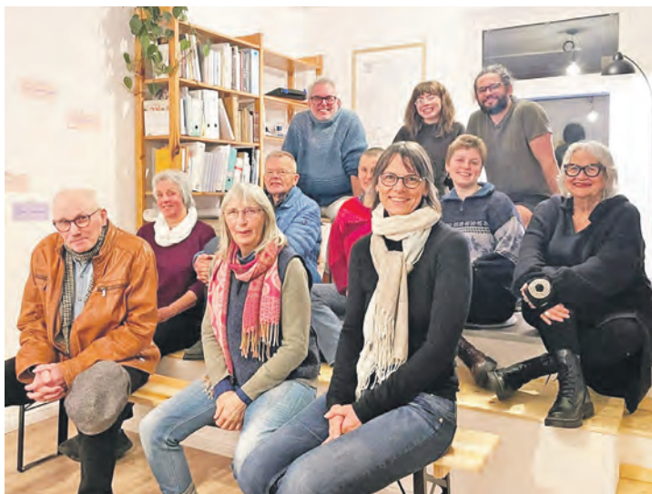
Die Helfer*innen freuen sich auf alle, die kommen – und auf weitere Freiwillige, die unterstützen.

„Für viele Menschen steht die Weihnachtszeit — insbesondere Heiligabend — im Zeichen von Familie und Zusammensein. Für andere kann sie auch eine Zeit der Isolation sein. Wir lassen nicht zu, dass Entfernung, Krieg, Geld oder Einsamkeit uns davon abhalten, einen Moment des Friedens, der Freundlichkeit und des Mit-