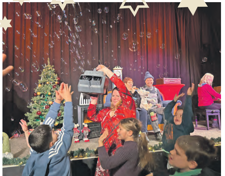
Die interaktive Show bot viele Überraschungen – wie den Einsatz von Seifenblasen.