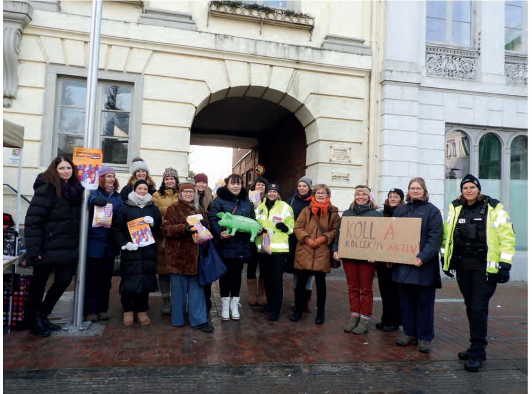
Sichtbarkeit, Aufklären und Netzwerken: Verschiedene Institutionen arbeiten in Eutin gegen Gewalt an Frauen.

Ein politisches Statement kommt von der Gruppe Koll*A. „Ja heißt Ja!“ ist der Titel der Kampagne,