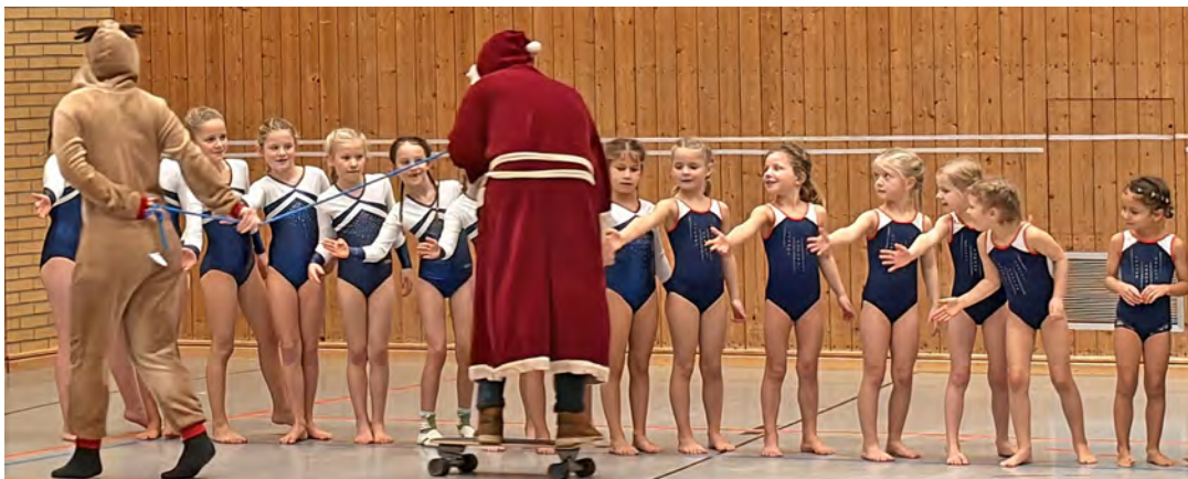
Die Turnerinnen des PSV Eutin klatschen den Nikolaus ab, der von einem seiner Rentiere in die Halle gezogen wird – in Ermangelung von Schnee auf einem Skateboard.

117 Aktive aus neun Vereinen folgten dem Aufruf der Fachwar-