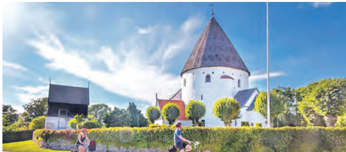
Weltberühmt sind die Rundkirchen auf Bornholm, die die Reisenden bei der Rundfahrt entdecken.

Höhepunkten Bornholms sowie am dritten Tag der erlebnisreiche Tagesausflug in die Insel-Hauptstadt Rönne und an die weltbekannten „weißen Sandstrände“ im Süden der Insel in Dueodde (Aufpreis pro Person 19 Euro). Anmeldungen sind ab sofort im Leser-Reisen-Büro des Reporter-Verlages in Eutin täglich von 9 bis 13 Uhr unter Telefon 04521-701130 oder direkt per E-Mail an leserreisen@der-reporter.info möglich.