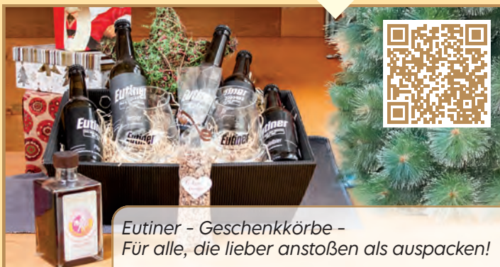
Eutiner - Geschenkkörbe - Für alle, die lieber anstoßen als auspacken!

Ein Stückchen, oder besser: ein Schlückchen Eutiner Gastlichkeit können Sie zum Fest ganz unkompliziert verschenken: Das Brauhaus bietet eine Auswahl süffiger Geschenkideen. Die Spezialitäten des Hauses sind natürlich die Eutiner-Biere, aber mit dem Haselnussgeist und dem Bockbierlikör „Süße Susi“ haben sie köstliche Verstärkung bekommen. Ein Tipp für Freude unterm Weihnachtsbaum sind die Eutiner-Geschenkkörbe in verschiedenen Größen. Das Verpacken übernimmt das Brauhaus-Team, Sie müssen sie nur noch freundlich überreichen. Natürlich können Sie alle Produkte auch einzeln kaufen. Und verschenken ist auch kein Muss: Wer selbst mit der „Eutiner Weihnacht“ anstößt, hat mit Sicherheit ein frohes Fest. Alle Infos gibt es auf www.brauhaus-eutin.de/eutiner-shop/ oder über den QR-Code in der nebenstehenden Anzeige.