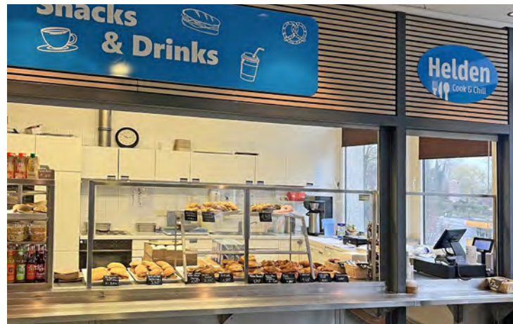
In der neuen Cafeteria gibt es ein breites Angebot an Snacks und Getränken.