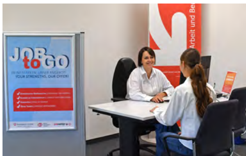
Das Angebot der offenen Sprechstunden gilt an jedem Donnerstagvormittag.

erhalten, an Bewerbungs-PCs Unterlagen erstellen und auch vom eigenen USB-Stick bearbeiten.