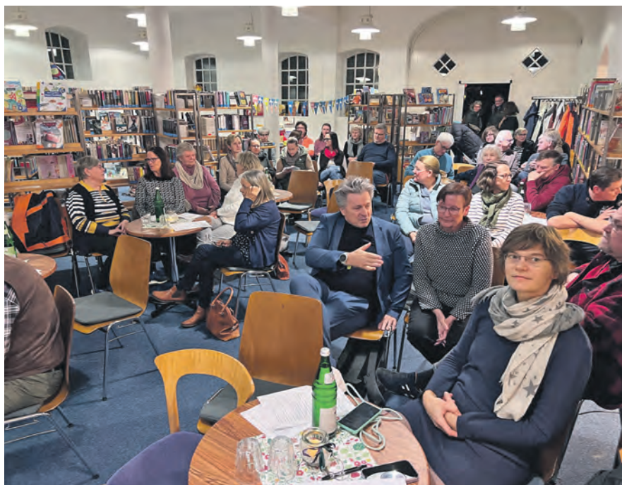
Über 60 Menschen zeigten Interesse am Förderverein „AhrensBook“.

luden die Räume der Ahrensböcker Gemeindebücherei am Abend des 12. November zur Gründungsversammlung ein. Es war ein Abend, der noch lange nachhallen sollte. Über 60 Bürgerinnen und Bürger kamen zusammen, um ein Zeichen zu setzen: für den Erhalt der Bücherei, für das Lesen, für die Gemeinschaft. So viele Menschen waren da, dass kurzfristig noch Stühle her-