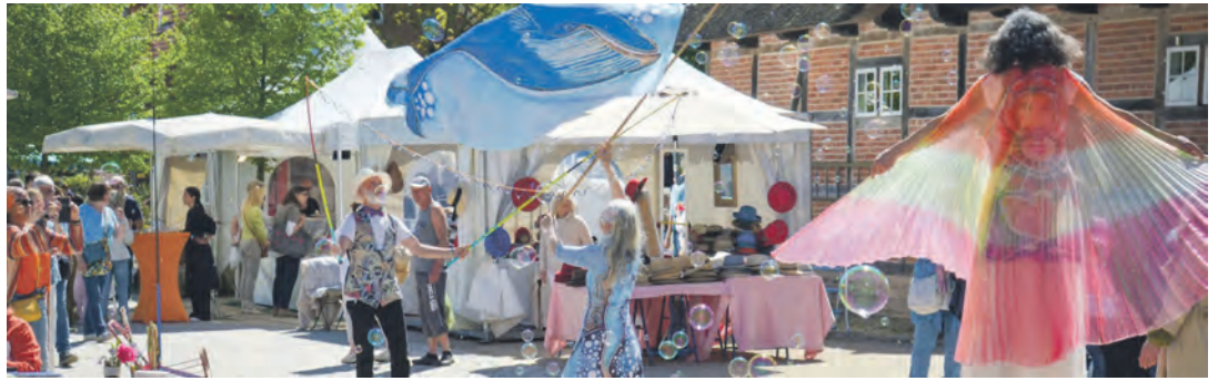
Bunt und lebendig geht es auf der Garten- und Lifestyle-Messe „LebensArt“ in Eutin zu.

Ein besonderes Highlight ist auch in diesem Jahr die Ausstellung „Eutin zeigt Kunst“. Rund 30 ausgewählte Künstlerinnen und Künstler aus der Region sowie aus dem Raum Hamburg präsentieren hier ihre Werke und machen die Vielfalt zeitgenös-