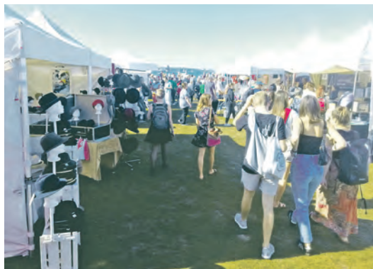
Das maritime Flair von Laboe verleiht dem Kunstevent „Handgemacht“ eine besondere Atmosphäre.

hen wird auch als Vorführung gezeigt, vielfältigstes Textil-design für Damen, Herren und natürlich auch für die Kids aus Leinen, Wachs, Walk, Strick, Mützen und Hüte, Naturfelle, Lederkunst, dann Papier- und Buchbindarbeiten, Bücher, Briefpapiere und Karten, Bilder und Fotografien, Tiffany, Edeltahlobjekte, mittelalterliche Schmiedearbeiten, Glasobjekte, schöne gedrechselte Dinge aus Holz, Tonblüten, Keramikarbeiten und viele andere dekorative Sachen für Haus und Garten. Verschiedene Aussteller zeigen Ihre Fertigkeiten und Arbeitsweisen dem interessierten Publikum. Ergänzt wird der Markt durch verschiedene Spezialitätenanbieter, welche ausgefallene leckere Dinge wie Liköre, Gewürze, Feinkost, Marmeladen, feinstes Nougat und Mandelgebäck sowie Käse- und Wurstspezialitäten anbieten. Für das gastronomische Wohlergehen der