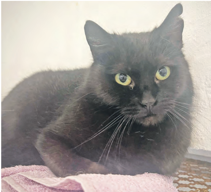
Ebony hat das Zeug zu einer tollen Zweitkatze.

Für Katze Ebony dagegen wäre eine feste Bleibe mit der Möglichkeit, im Freien Streifzüge zu unternehmen, genau das Richtige. Die schwarze Schönheit wäre prima als Zweitkatze. Kleine Kinder und viel Trubel sind dagegen