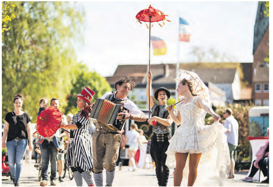
Eutin darf sich auf ein launig-leckerer Wochenende freuen.