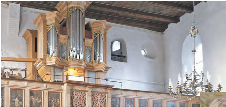
Beim Orgelsommer erklingt die 300 Jahre alte Königin der Instrumente in der St.-Johanniskirche in Neukirchen.

Neukirchen (t). Die historische Wiese-Orgel in Neukirchen bei Malente wird 300 Jahre alt. Dazu veranstaltet die evangelische Kirchengemeinde einige besondere Konzerte mit namhaften Organistinnen und Organisten. Das Eröffnungskonzert am Sonntag, 10. Mai, um 17