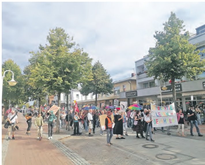
Im vergangenen September fand eine erste Demo in Malente statt.

geht auf dem Lenter Platz unter dem Motto „Nie wieder ist jetzt – Kein Raum für Faschisten. Nein zu Hass und Hetze“ los.