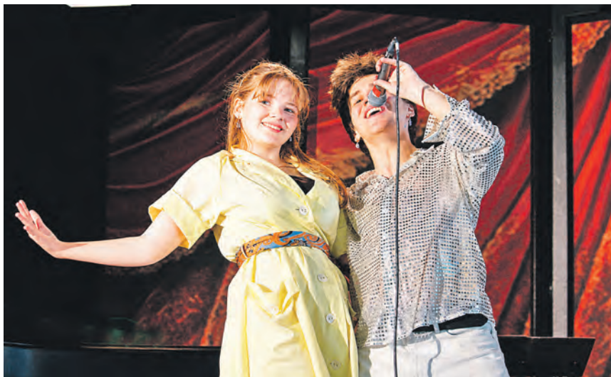
Junge und junggebliebene Talente präsentieren am Muttertag tolle Musik unter dem Motto „Sail Away“.