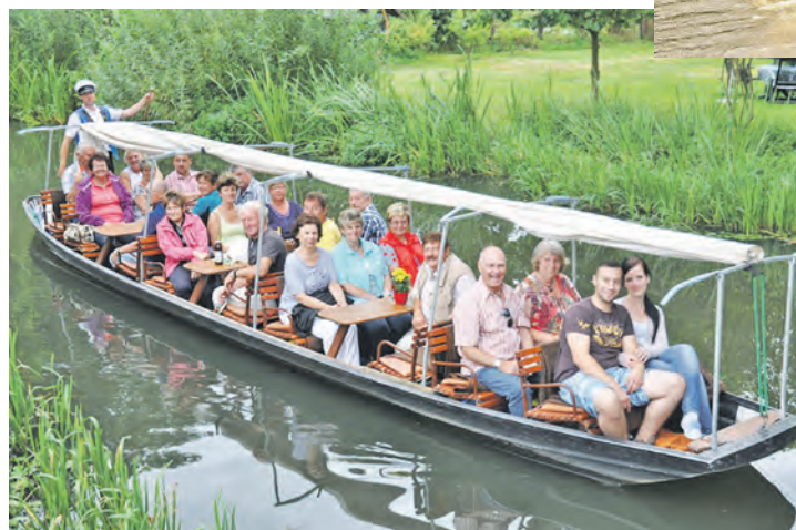
Unterwegs im Spreewald mit dem stakenden Fährmann sind die Leser*innen im Sommer 2026.

Schlösserstadt Potsdam sowie drei Übernachtungen im Komfort-Hotel mit reichhaltigen Frühstücks- und Abendbuffets sowie „All inclusive“-Getränken zur Speisezeit zum Abendessen (Biere, Weine, Softdrinks) ohne Begrenzung. Außerdem ist die kostenlose Nutzung der Wellness-Abteilung im Hotel inklusive. Zum großen Ausflugsprogramm gehören ein großer Sommerausflug im Spreewald mit Gelegenheit zur Kahnfahrt mit dem stakenden Fährmann so-