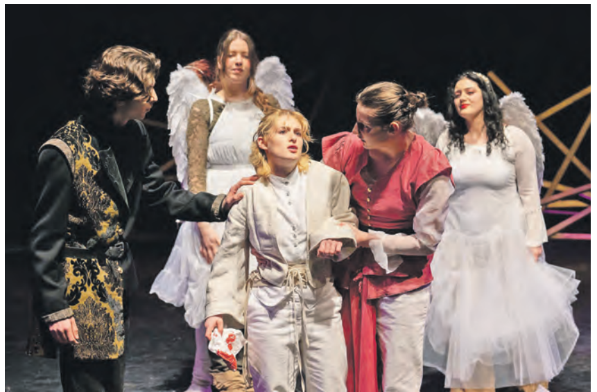
Die Jugendlichen von „TheaterTotal“ kommen mit „Wie es euch gefällt“ nach Lübeck.