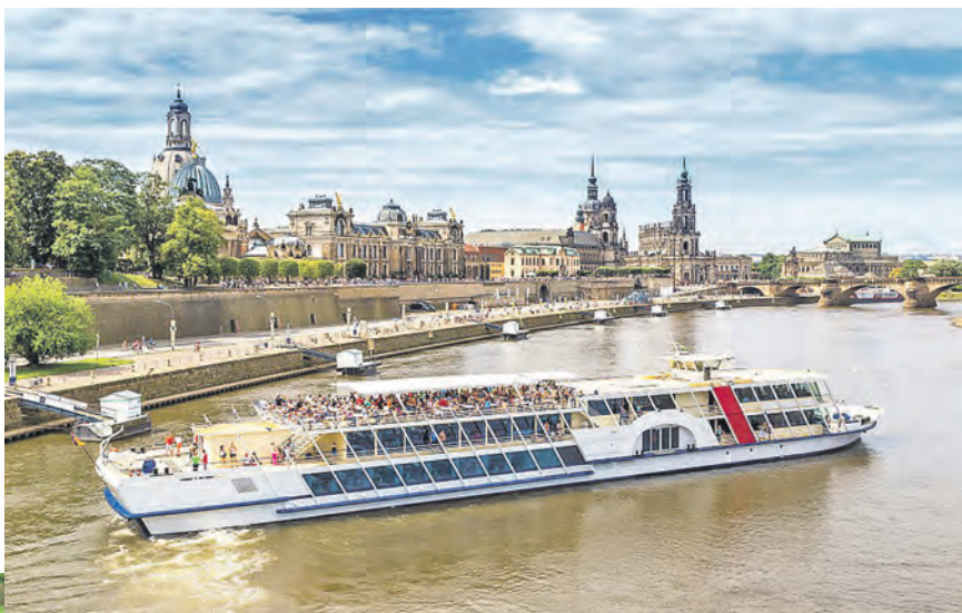
Elbflorenz im Sommerkleid: Das weltberühmte Dresden erkunden die Gäste beim großen Tagesausflug mit viel Freizeit.

Schlemmerbuffets zum Frühstück und Abendessen und zusätzlich „All inclusive“-Getränken ohne Begrenzung. Zum großen Leistungspaket der Leser-Reise gehören neben der Fahrt im erstklassigen Fernreisebus direkt ab Eutin ohne weitere Einzeltour die Anreise mit Mittagspause in der