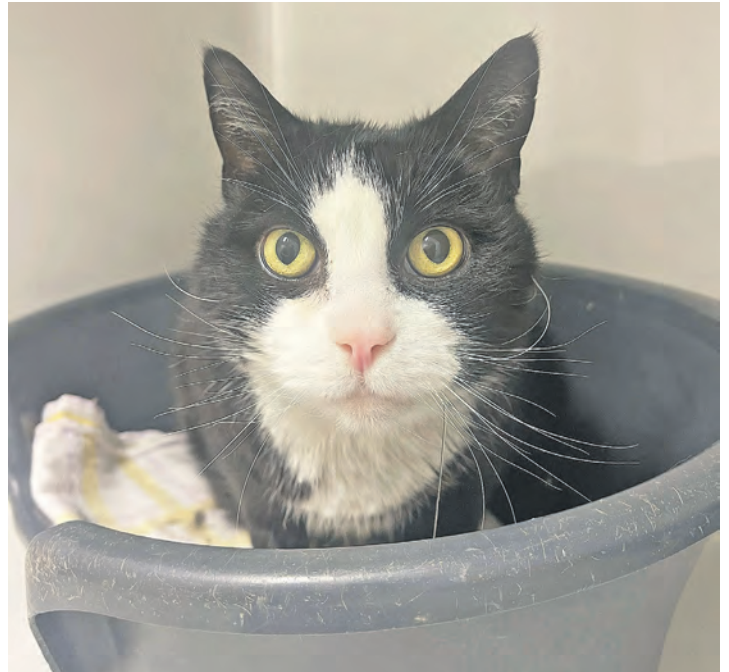
Mulle freut sich auf eine sichere Bleibe.