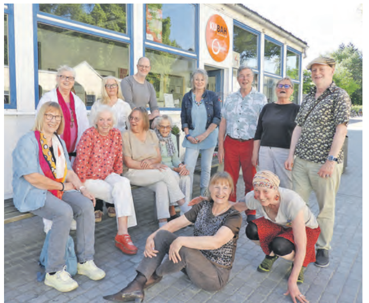
Ein Teil der Künstler*innen, die die Gemeinschaftsausstellung gestaltet haben.