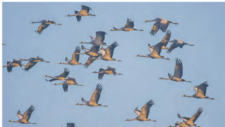
Ein weltweit einmaliges Erlebnis ist der Kranichzug von Millionen Kranichen auf der großen Müritz-Seen-Platte.