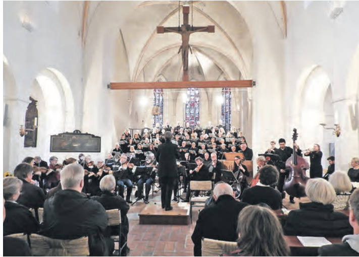
Die großen Aufführungen mit Solisten und Orchester sind für die Eutiner Kantorei und ihr Publikum Höhepunkte des Chorjahres.