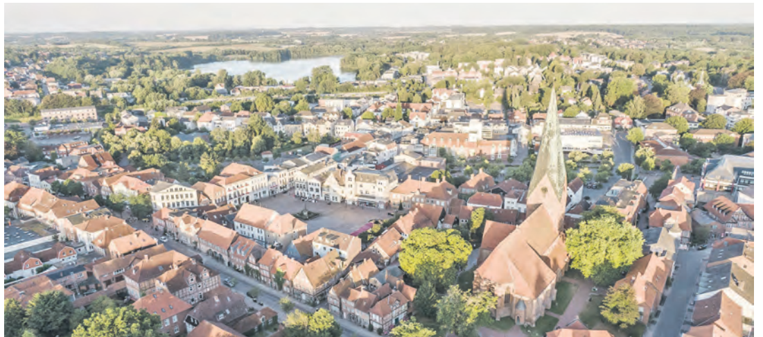
Beim Innenstadtforum wird die Stadt in den Blick genommen.

Eutin (t). Die Innenstadtforen der vergangenen Jahre haben gezeigt, wie wichtig der regelmäßige Austausch zu allen innenstadtrelevanten Themen ist. Um diesen offenen Dialog fortzuführen und gemeinsam neue Impulse für die Belebung der Eutiner Innenstadt zu setzen, laden die Eutin Tourismus GmbH, die Stadt Eutin und die Wirtschaftsvereinigung Eutin e. V. zum nächsten Innenstadtforum am Montag, 22. Juni, um 18.30 Uhr ins Brauhaus Eutin (Markt 11) ein. „Wir freuen uns sehr, dass sich das Innenstadtforum inzwischen als regelmäßiger Termin etabliert hat. Der direkte Austausch zwischen Gewerbetreibenden, Verwaltung