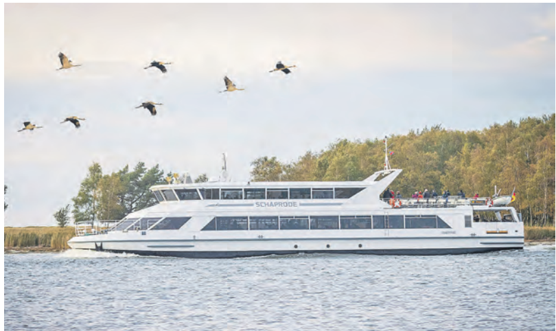
Mit Einbruch der Dunkelheit starten die Leser mit dem Sonderschiff zur großen Entdeckungs-Kreuzfahrt mit Ranger an Bord.

dieren werden die Gäste im guten Komfort-Hotel-Hotel mit Schwimmbad und Sauna inklusive Halbpension direkt im Herzen der romantischen Seenplatte. Zum großen Leistungspaket gehören neben der Busfahrt im erstklassigen Fernreisebus direkt ab Eutin ohne weitere Einsammeltour zwei Übernachtungen im guten Mittelklasse-Komfort-Hotel im Herzen der Seenplatte mit zweimal Schlemmerfrühstück vom Buffet und zwei Abendessen als reichhaltiges Buffet oder Menü