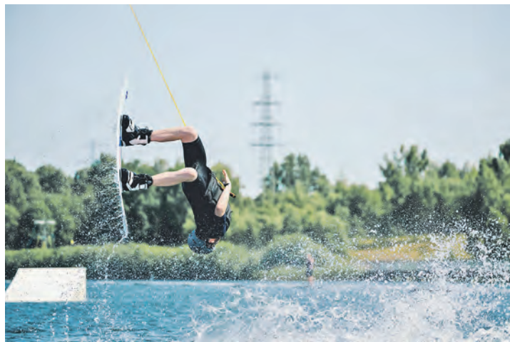
Ein echter Augenschmaus wird auf der Süseler Anlage geboten.

zept verbindet der Wake Games Tour-Cup 2026 sportlichen Wettbewerb, Community und Wassersportkultur zu einem einzigartigen Eventwochenende im Norden.