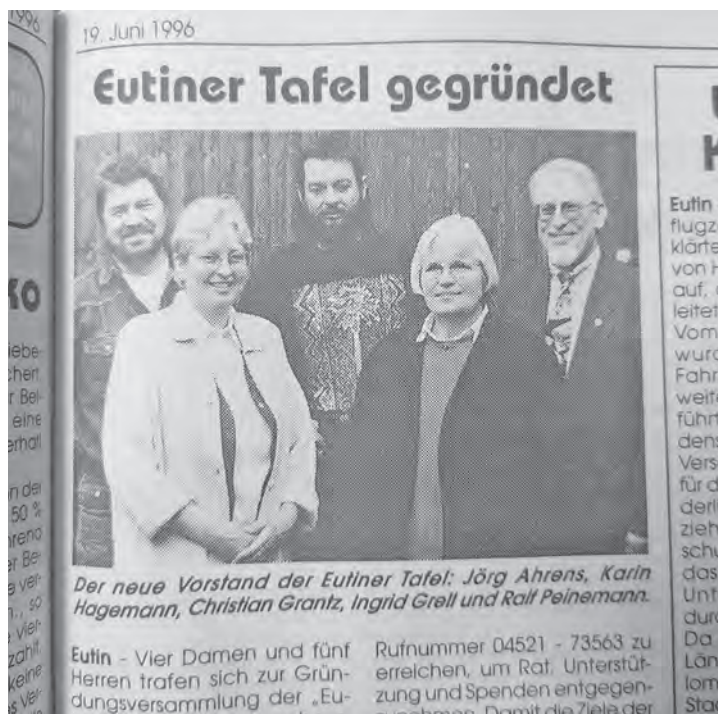
Am 19. Juni 1996 erschien der Bericht zur Gründung im reporter.

Einsatz wird eine Arbeit, welche eine positive Resonanz bei den Empfängern auslöst, unterstützt.“ Dass sich seit der Gründung vieles verändert hat, zeigt sich unter anderem in der Sprache des Berichtes, in dem übrigens auch die Berufs- bzw. Tätigkeitsbezeichnungen der Gründungsmitglieder sorgfältig festgehalten sind. Geblieben ist der Leitgedanke: „Einem anderen geben, was er braucht. Ein Stück Brot, ein Lächeln, ein offenes Ohr – jetzt, nicht irgendwann!“