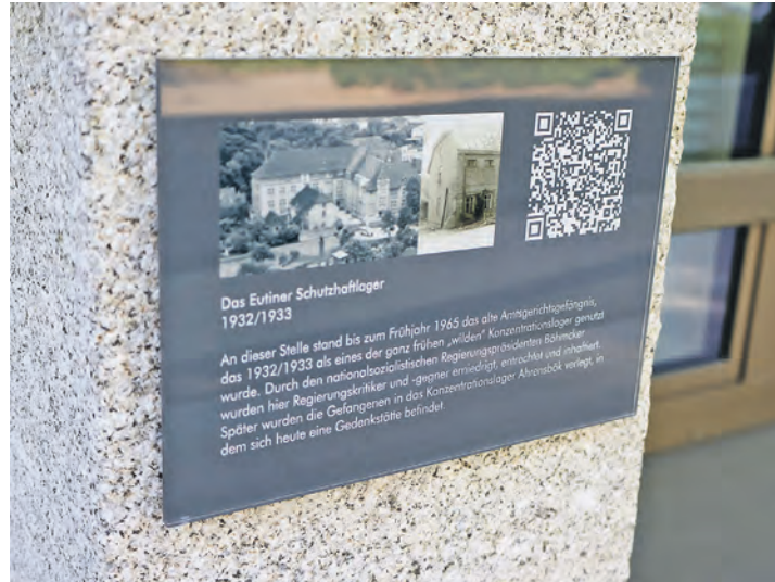
Die Ausstellung ist für alle zugänglich und macht die Auseinandersetzung mit der Geschichte ohne Vorbereitung möglich.

Im Zuge der Planung und Errichtung des Erweiterungsneubaus der Kreisverwaltung in Eutin wurde auch die historische Entwicklung des Geländes aufgegriffen. Der Übergang zwischen Bestandsgebäude und Erweiterungsneubau zeigt auf der Außenseite einen Lageplan des historischen Grundstücks. Über einen dort angebrachten QR-Code gelangt man zu der umfassenden Aufarbeitung, die ab sofort auf der Homepage des Kreises Ostholstein abrufbar ist ( www.kreis-oh.de/DasEutinerSchutzhaftlager ). Die Veröffentlichung am 8. Mai, dem Tag der Befreiung vom Nationalsozialismus, ist bewusst gewählt. Dieses Datum steht für das Ende der nationalsozialisti-