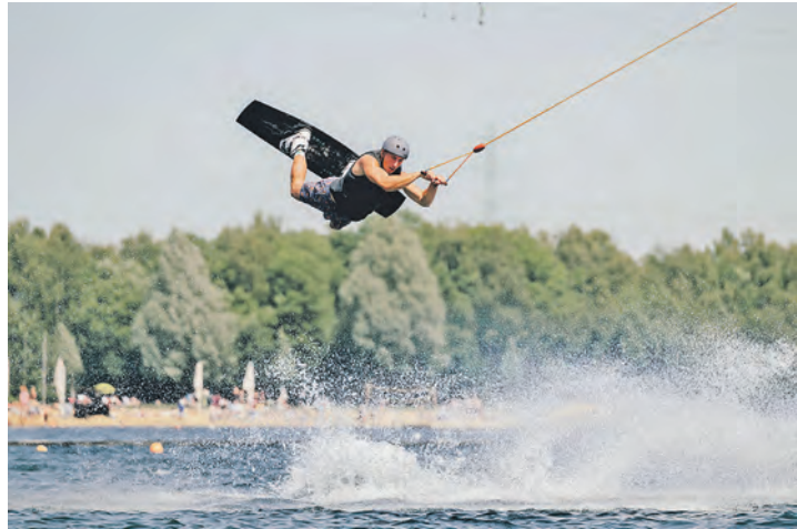
Spektakuläre sportliche Action wird beim Wake Games Tour-Cup 2026 geboten.

an. Neben dem Tour-Cup wird gleichzeitig der Schleswig-Holstein-Cup ausgetragen. Für die Siegerinnen und Sieger winkt zudem eine attraktive Prämie. Besucherinnen und Besucher dürfen sich auf spektakuläre Tricks, spannende Wettkämpfe und ein internationales Teilnehmerfeld freuen. Ergänzt wird das Event durch eine Live-Übertragung sowie zahlreiche Aussteller aus den Bereichen Surfwear an beiden Standorten. Mit seinem standortübergreifenden Kon-