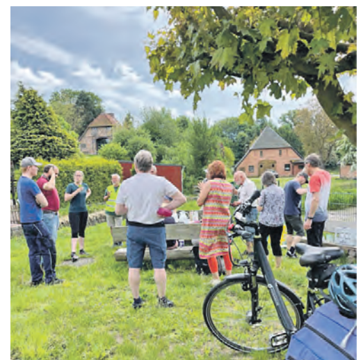
Die Teilnehmenden nutzten die Radtour für politische Gespräche.

Die Veranstalter*innen bedanken sich bei allen Teilnehmer*innen sowie bei den Gesprächspartner*innen vor Ort für die Offenheit und die konstruktiven Diskussionen. Der direkte Austausch mit Bürger*innen soll auch über die Fahrradtour hinaus fortgesetzt werden – beispielsweise beim nächsten Infostand der Grünen Malente am Sonnabend, 6. Juni, ab 10 Uhr in der Bahnhofstraße in Bad Malente.