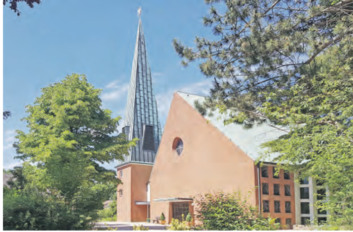
In der Martin-Luther-Kirche in Fissau wird am 21. Juni Konfirmation gefeiert.

„Die Konfirmation ist immer eine besondere Feier – für junge Menschen, für ihre Familien und für unsere Gemeinde. An diesem Tag sagen Jugendliche Ja zum Glauben und zur Verantwortung für ihr eigenes Leben.