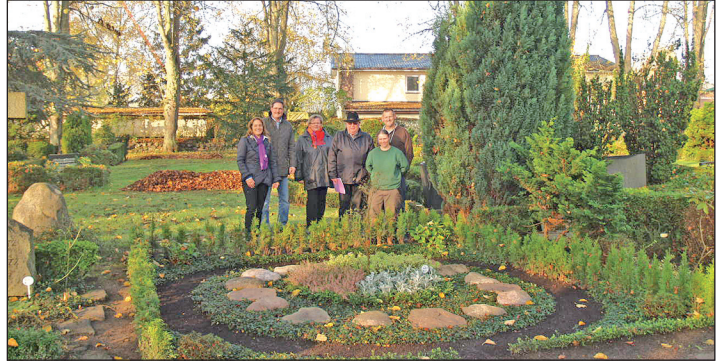
Eröffnung der neuen Gemeinschaftsgrabanlagen auf dem Friedhof in Süsel.

So entstand auch die bislang in Schleswig-Holstein erste Gemeinschaftsgrabanlage nur für Sargbeisetzungen. „Nicht jeder