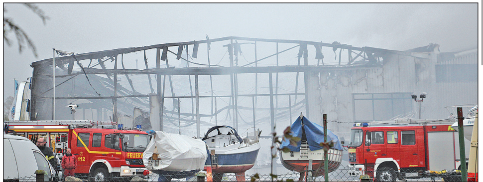
Dichter Qualm steigt von der Halle auf. Um 8 Uhr waren die Löscharbeiten noch in Gange.