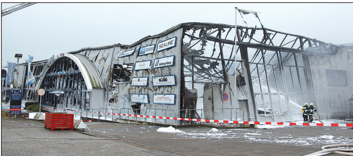
Rund 40 Yachten und die Ausstellungshalle selbst erlitten einen Totalschaden.