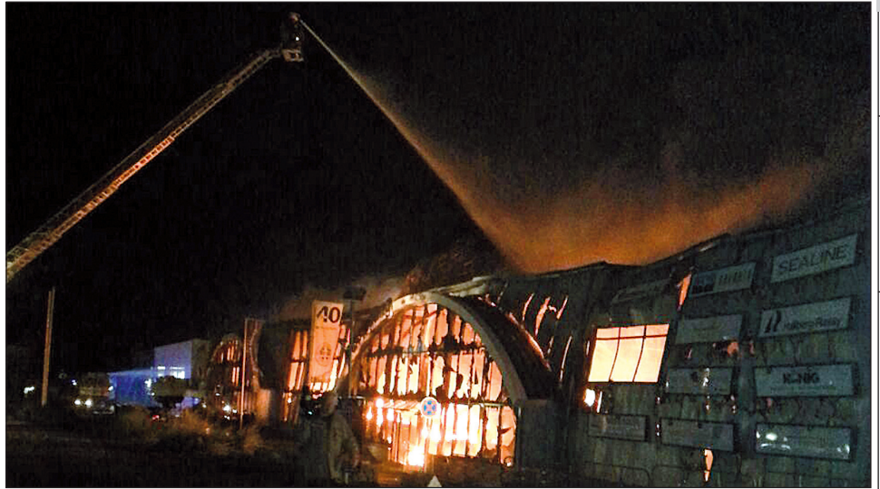
Mit vereinten Kräften gelang es den Wehren aus Neustadt, Süsel, Sierksdorf, Grömitz, Eutin und Oldenburg das Feuer in den Griff zu bekommen.