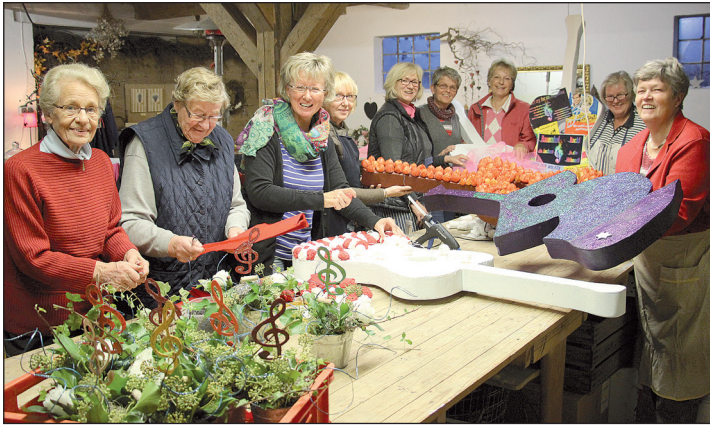
Die von den Landfrauen hergestellten Deko-Gitarren sollen auch nach der Jubiläumsveranstaltung einen Sinn erfüllen.

Damit gutes Theater auf der Bühne gelingt, braucht es viele Helfer im Hintergrund. Auch beim 40. Jubiläum von Theater in der Stadt am heutigen Samstag, dem 15. November haben abseits des Rampenlichts viele Menschen mitgewirkt (der reporter berichtete). Mit außergewöhnlicher Dekoration beispielsweise setzt der „LandFrauen Verein“ Neustadt den Abend in Szene.