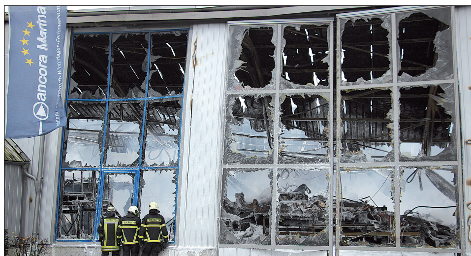
Drei Feuerwehrleute schauen in das rauchende Gerippe der Ausstellungshalle.