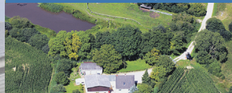
22 Grundstücke ab 320 m 2