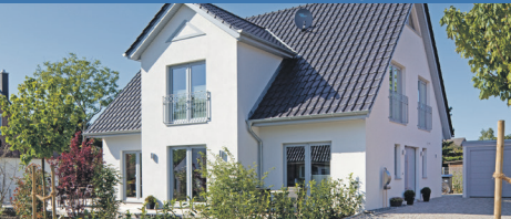
2. Bauabschnitt, 61 Grundstücke ab 350 m 2