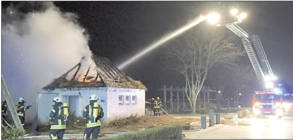
Die beteiligten Wehren hatten das Feuer schnell unter Kontrolle. (DS)

In der Nacht von Donnerstag auf Freitag brannte in der Strandallee im Bereich Haffkrug ein reetgedecktes Toilettenhaus komplett nieder.