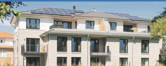
Wohnungen und Doppelhäuser