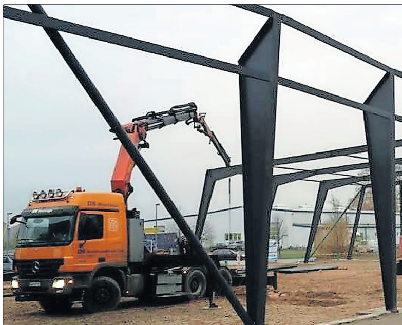
Mit dem Anbau einer weiteren Halle 2014/15 wurde die Lager- und Arbeitsfläche erweitert.

2014/2015: Erweiterung der Lagerkapazitäten durch den Anbau einer 800 Quadratmeter großen Halle. (inu)