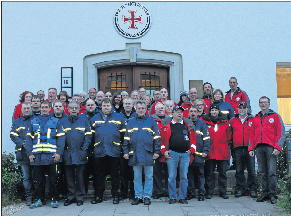
DGzRS und die Helfer vom THW vor der Ausbildungsstation in der Wiexbergstraße.

Neustadt. Für den gelungenen Tag der Seenotretter am 29. und 30. Juli hat sich die Deutsche Gesellschaft zur Rettung Schiffbrüchiger (DGzRS) am vergangenen Wochenende bei allen Helfern bedankt. „Die tolle Unterstützung anlässlich der Durchführung unseres Sommerfestes hat zum großen Erfolg der Veranstaltung beigetragen. Das THW hatte Zelte und die Hüpfburg aufgebaut und betreut - für diese Hilfe wollen wir uns hiermit