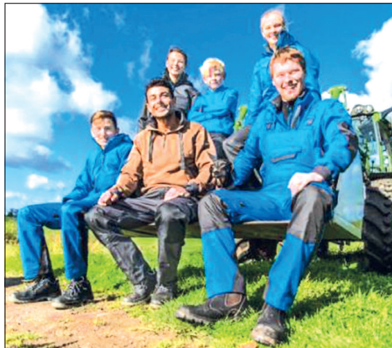
„Ich bin ein Ostholsteiner“ - Fotoshooting für Dassy workwear in Kooperation mit der Landjugend Neustadt und Umgebung.

„In vielen Berufen ist es wichtig, die richtige Arbeitsbekleidung zu tragen. Diese sollte funktional, bequem und den Anforderungen des Arbeitsplatzes entsprechen - und das ist unsere Berufung“, so Olaf Heinzmann und fügt an: „Die Begriffe Team- und Corporatewear sind in den letzten Jahren für kleine und mittelständige Unternehmen ein sehr wichtiges Thema geworden. Deshalb ist es unser Bestreben als Servicepartner der Region für Berufsbekleidung in modernem Design, ergonomischen Schnitten, ausgesuchten Materialien und praktischen Ausstattungsdetails, dass sich unsere Kunden und deren Mitarbeiter rundum wohlfühlen. Schließlich sollen die Angestellten ihre Berufsbekleidung mit Stolz tragen und dazu gehört ein gewisses Maß an Tragekomfort. Denn nur so strahlen sie auch nach außen und steigern zusätzlich den positiven Wiedererkennungswert des Unternehmens.“