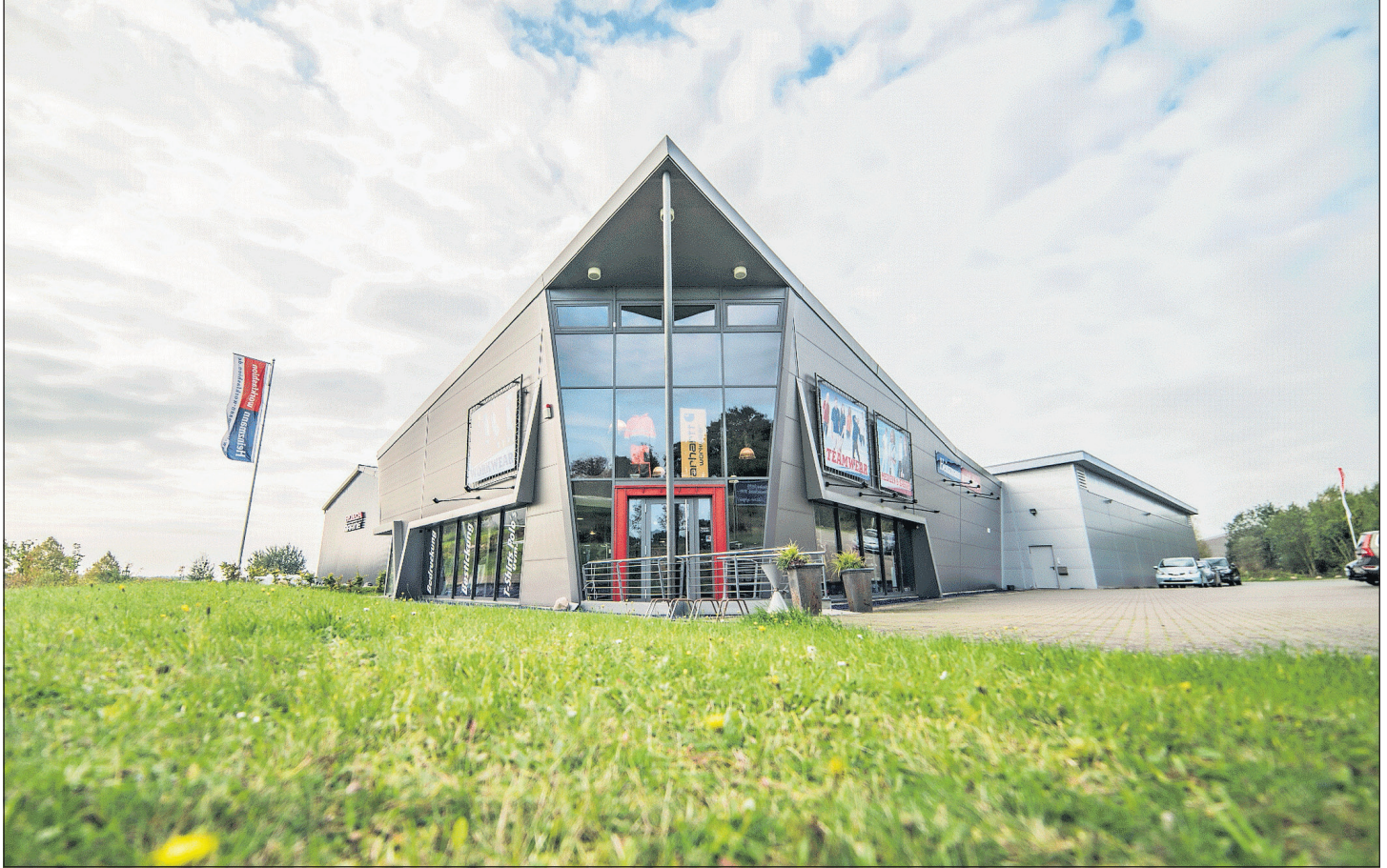
Das Familienunternehmen steht seit drei Jahrzehnten für Kunden- und Serviceorientierung und bietet seinen Kunden für einen stressfreien Einkauf kostenlose Parkmöglichkeiten vor Ort.