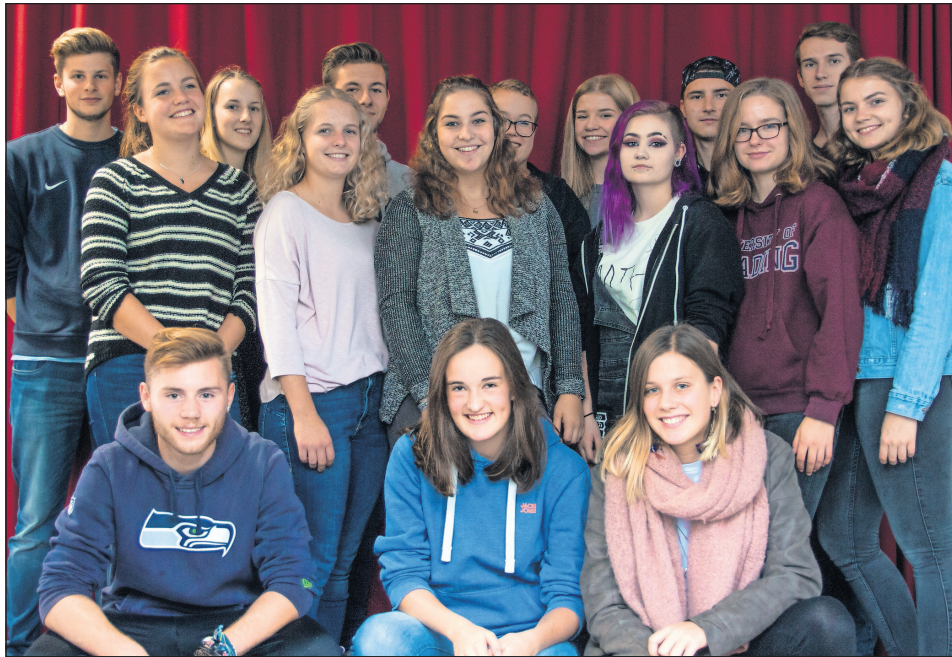
Das Theaterensemble des Küstengymnasiums Neustadt.

Neustadt. Wer denkt, ein Märchen passe nicht in die heutige Zeit, kann sich vom Theaterensemble des Küstengymnasiums Neustadt mit „Die sanfte Guillotine“ von Peter Förster von dem Gegenteil überzeugen lassen.