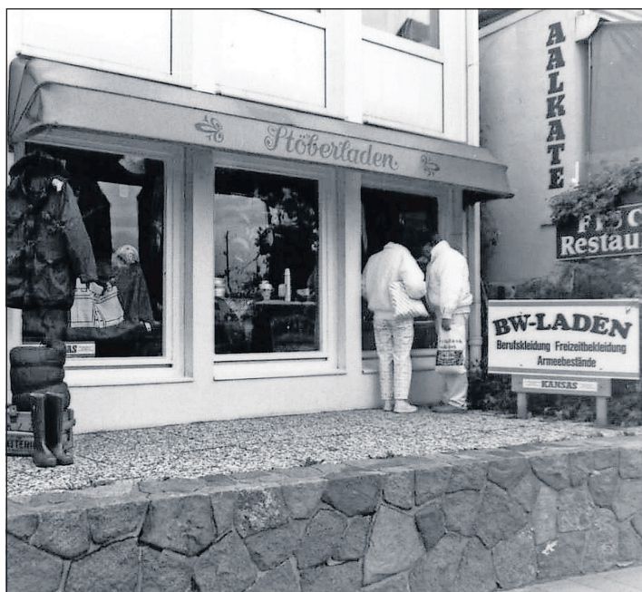
Im ehemaligen Stöberladen gab es Freizeit- und Berufsbekleidung sowie Bundeswehrbestände vor allem für den Winter.