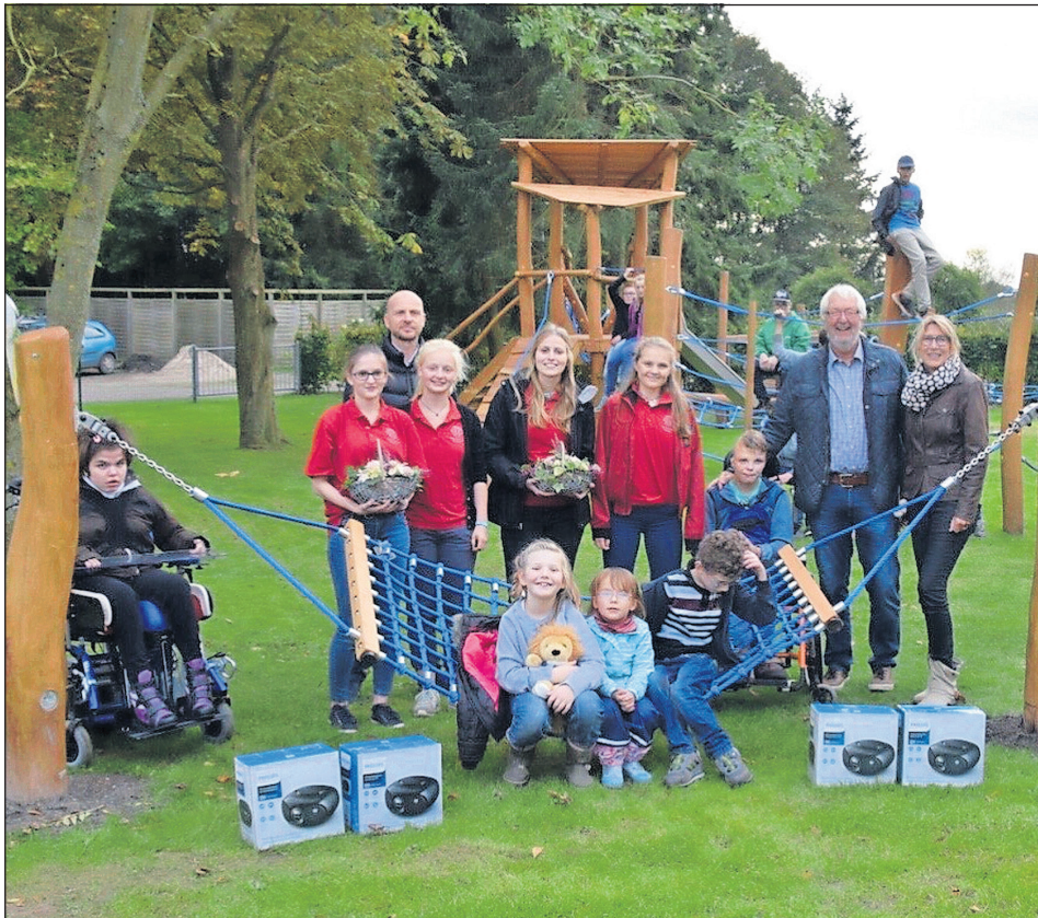
Die Kinder und Jugendlichen der „Heilpädagogischen Wohneinrichtung Fünf Linden“ freuen sich über die neue Hängematte.

Langenhagen. Der „Leo-Club Holsteinische Schweiz“ ist ein eigenständiger Club von jungen Menschen im Alter von 16 bis 23 Jahren, die aus dem Lions-Club Eutin hervorgegangen sind. Die Leos kümmern sich unter anderem um soziale Projekte und sind auch in der Behindertenhilfe unterstützend tätig. Sehr zur Freude der geistig- bis schwerstbehinderten Kinder und Jugendlichen der „Heilpädagogischen Wohneinrichtung Fünf Linden“ aus Langenhagen spendeten die Leos für den neu gestalteten Spielgarten mit Spielgeräten aus naturbelassenen Kernholz der Robien-Hölzer ein Spielgerät mit