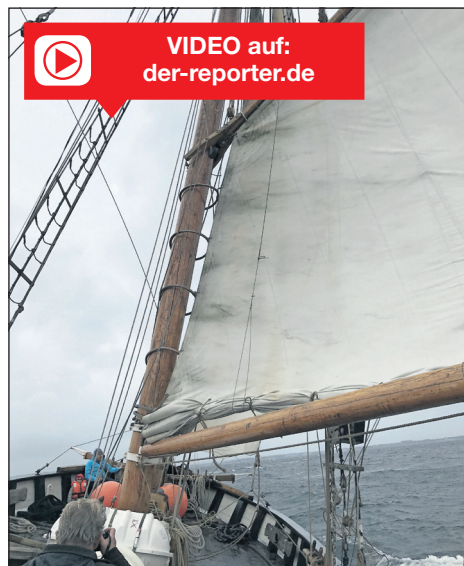
Steife Brise und tolle Fotomotive auf der „Norden“.