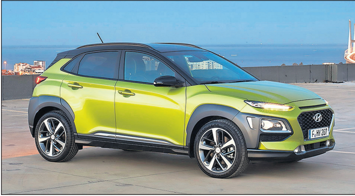
Am 4. November feiert der Kona im Handel seine Marktpremiere.

Wer als einer der ersten das neue kleine Lifestyle-SUV Hyundai Kona fahren möchte, kann dies ab sofort in den Hyundai Filialen des Autohaus am Bungsberg tun. Am 4. November feiert der Kona im Handel seine Marktpremiere.