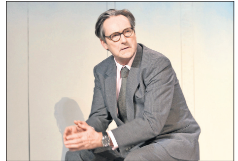
„Tod eines Handlungsreisenden“.