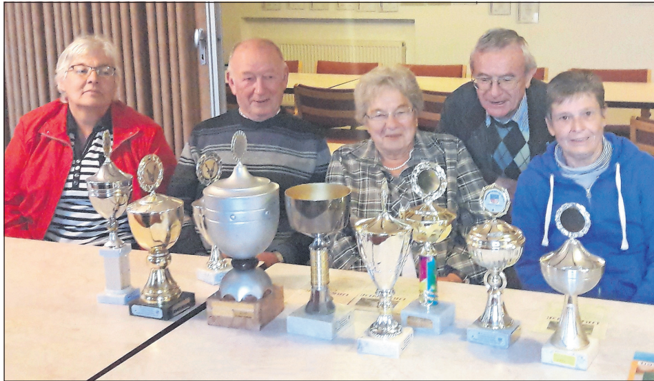
Die Sieger und Platzierten im Hobby-Bereich.

Lensahn. Das 11. Lensahner Paarturnier am 14. und 15. Oktober fand wieder für Hobby- und Sportkegler sowie für die Keglerjugend statt. Es starteten in diesem Jahr trotz einiger Ausfälle immerhin 75 Teams in den verschiedenen Klassen. Die Meldungen kamen aus Neumünster, Bordschholm, Fehmarn, Kiel, Lensahn und aus Kyritz in Brandenburg.