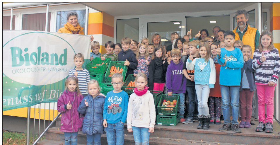
Frisch vom Feld direkt ins Klassenzimmer: Schüler und Lehrer nahmen die Lieferung von „Sonnenwind Naturkost“ aus Retzin begeistert entgegen.

Ab sofort werden die 500 Schüler der Grundschule Neustädter Bucht Am Stein-kamp zweimal wöchentlich mit frischem Obst und Gemüse versorgt.