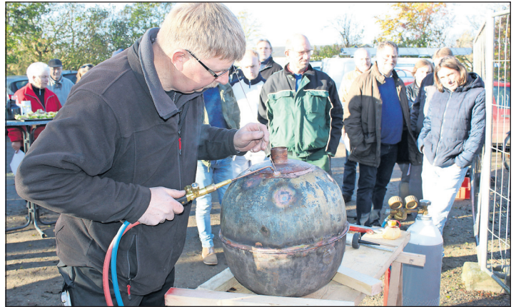
... und anschließend verlötet.