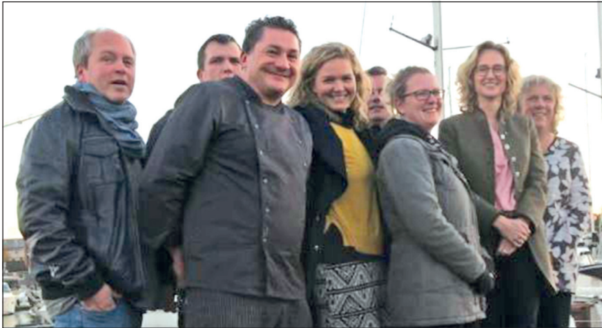
Das Organisationsteam blickt dem Kulturdinner freudig entgegen.

Am Freitag, dem 23. Februar 2018 findet ab 18 Uhr im Festsaal der Ameos-Klinik das Neustädter Kulturdinner unter dem Leitsatz „Neustadt - unsere Heimatstadt“ statt.