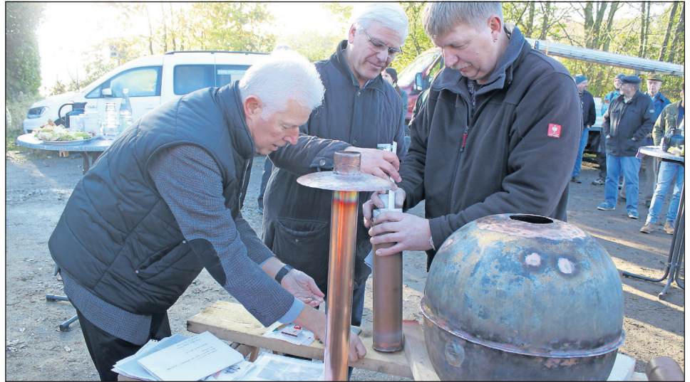
Alle Dokumente wurden in zwei Kapseln verstaut ...