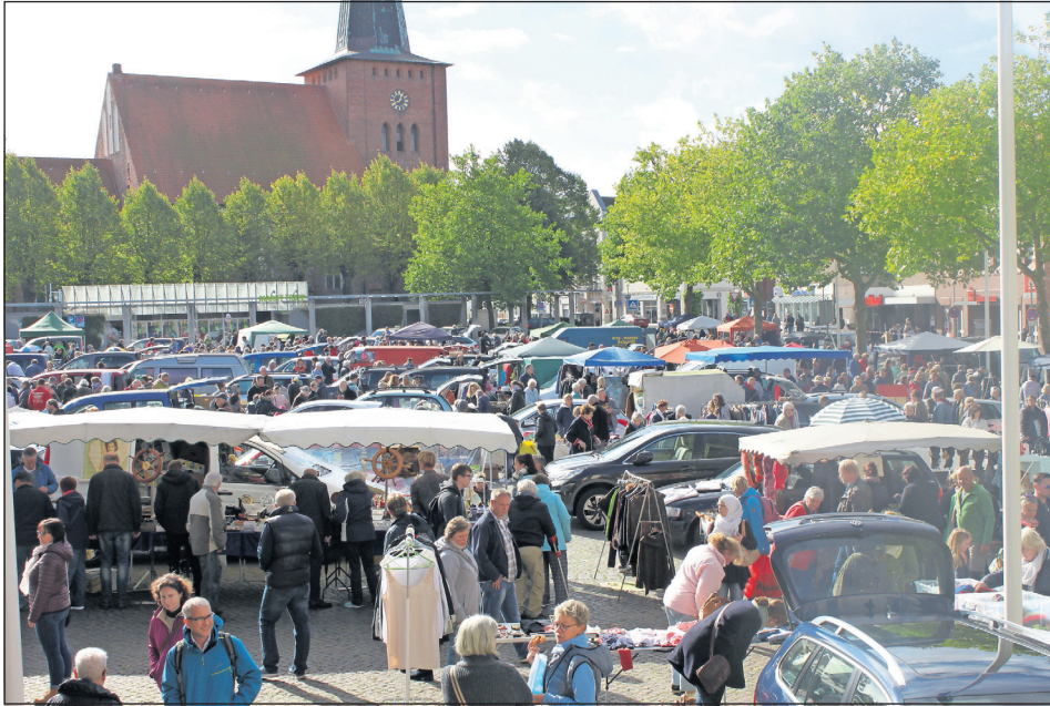
Der Flohmarkt am 3. Oktober ist beliebt bei Sammlern und Schnäppchenjägern.

Tag der Deutschen Einheit mit DM-Nostalgie