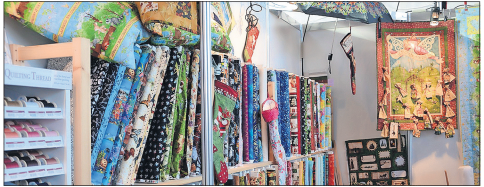
Die Aussteller präsentieren neue Trends, Außergewöhnliches und Altbewährtes.

Handarbeitsmesse rund ums kreative Hobby