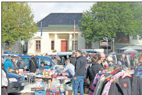
Buntes Treiben vor dem Rathaus.

Gewerbeverein weist darauf hin, dass das Bezahlen mit DM nur in den Geschäften möglich ist, auf dem Flohmarkt ist dies aus organisatorischen Gründen nicht möglich. (red)