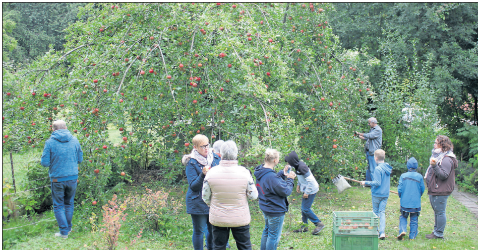
Mit einer gemeinsamen Apfelernte, neben zwei Apfelbäumen steht dort auch ein Kirschbaum, wurde der „Garten der Begegnung“ eröffnet. Das Projekt zielt auf Nachhaltigkeit.

„Garten der Begegnung“ offiziell eröffnet