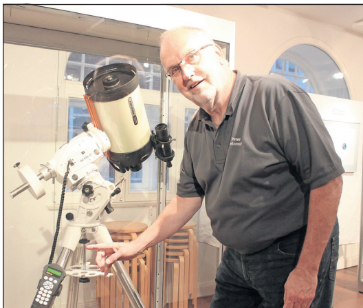
Große Teleskope sind für die Aufnahmen unerlässlich.