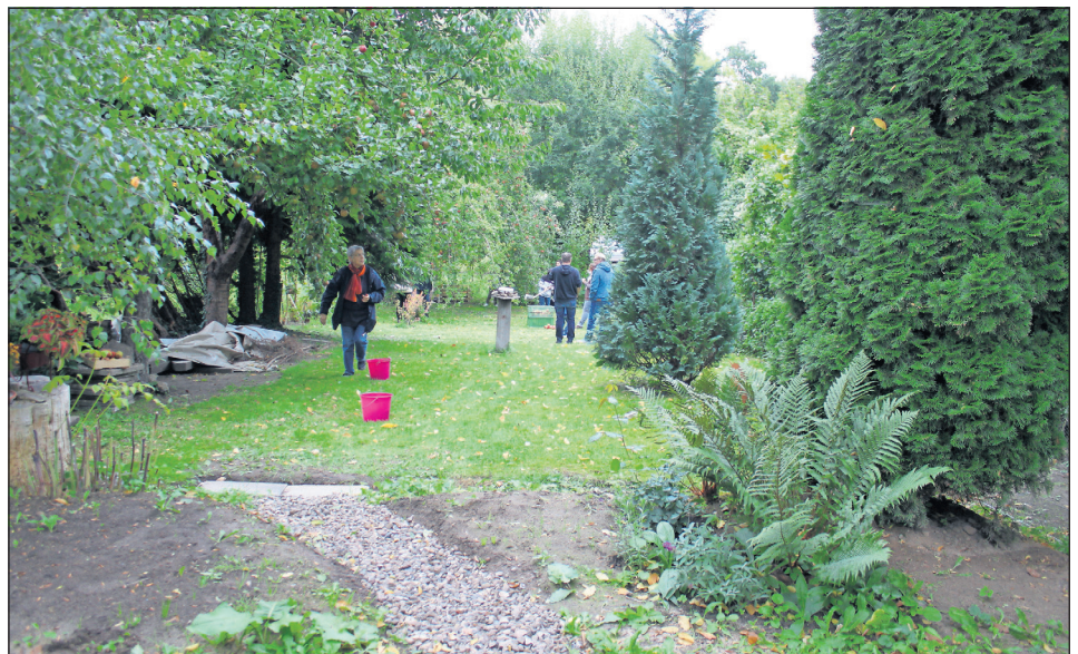
Der „Garten der Begegnung“ ist in der Kleingartenkolonie hinter der Gogenkrog-Halle zu finden.

Der „Garten der Begegnung“ ist jeweils sonntags von 13 bis 18 Uhr für die Öffentlichkeit geöffnet. Andere Terminwünsche können nach telefonischer Absprache mit Gisele Vering unter 04561/17828 vereinbart werden.