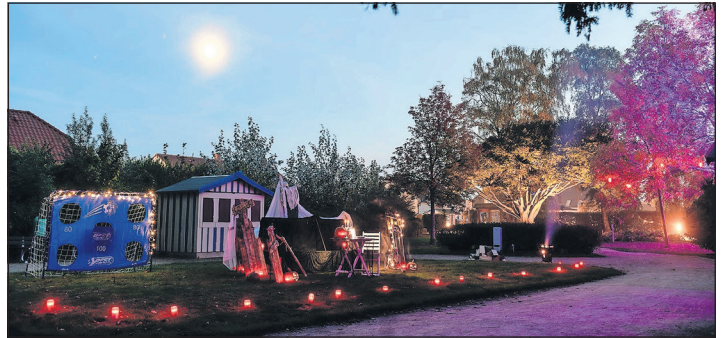
Ein buntes Programm erwartet alle Gäste bei „Der kleine Horrorladen“ auf der Schwimmbadwiese in Kellenhusen.

Am Donnerstag, dem 13. Oktober spielt das Figurentheater das „Petersson und Findus“-Stück „Ein Feuerwerk für den Fuchs“. Um 15 Uhr startet die Gespenstergeschichte für Kinder ab 4 Jahren im Kursaal. Der Eintritt kostet 5 Euro. Mit der Krimilesung für Erwachse-