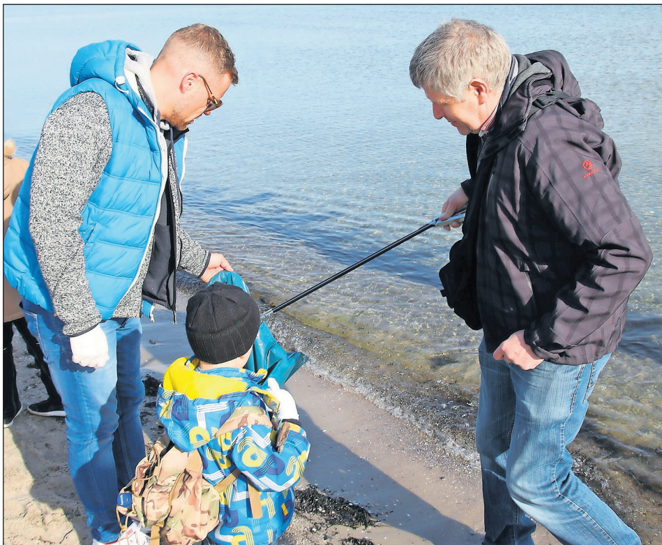
Bei der Flens Strandgut-Aktion wird wieder der Müll vom Strand entsorgt.

Vom Montag, dem 10. bis zum Sonntag, dem 16. Oktober veranstaltet der Tourismus-Service Grömitz eine Umweltwoche. Dort wartet ein abwechslungsreiches und überwiegend kostenfreies Programm auf Klein und Groß.