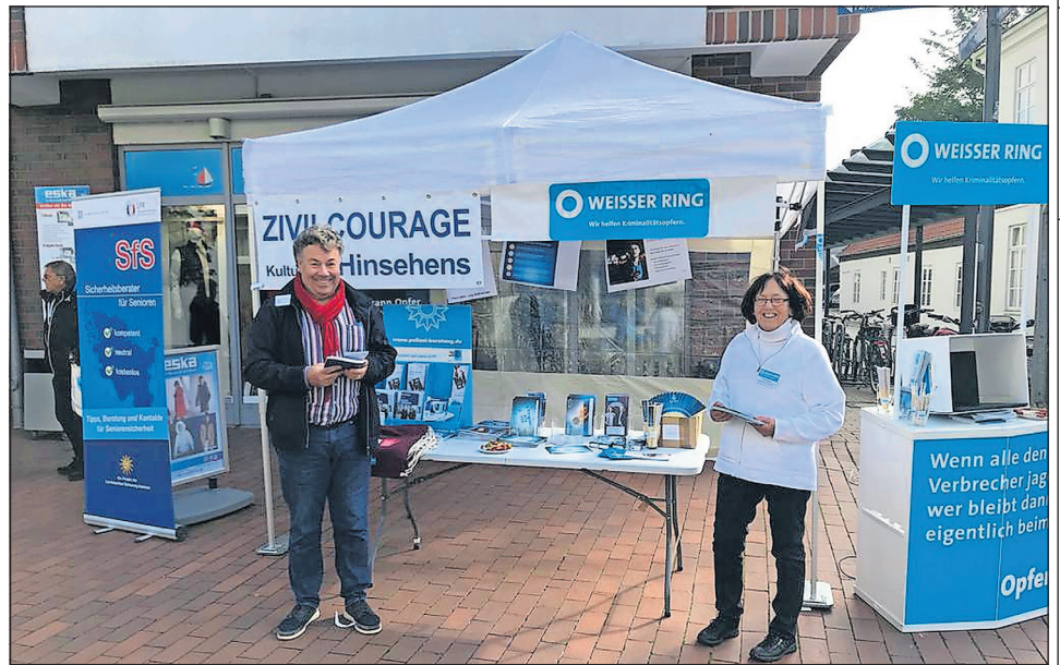
Der Informationsstand bot viel Wissenswertes. Es wurde dazu aufgefordert, hinzusehen und einzugreifen.

Weitere Informationen zum Thema werden im Internet zur Verfügung gestellt unter weisser-ring.de/zivilcourage .