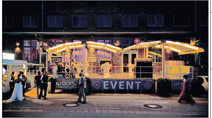
Die große Außenterrasse gibt der Eventplanung im Glücks die nötige Flexibilität.

Eine große Außenterrasse sowie ein mobiles Interieur geben der Eventplanung im Glücks die nötige Flexibilität, denn auch Workshops und Firmenveranstaltungen finden hier statt. Gruppen zwischen 20 und 150 Personen finden hier einen Ort direkt an der Wasserkante.