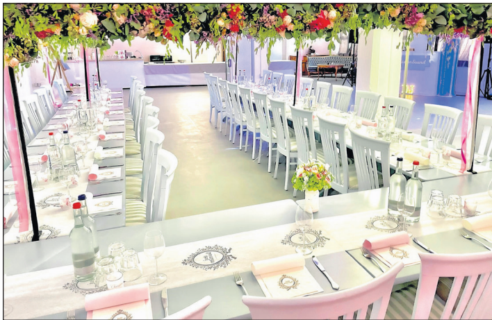
Vom Familienfest über Hochzeiten bis zum Firmenevent sieht jedes Fest anders aus.

Firmenevents weiter ausbauen. Eine Agentur aus Hamburg wird diese zukünftig auch im naheliegenden Umland stärker vermarkten. Anfragen, ob Weihnachtsfeiern möglich sind, steht Baum offen gegenüber. „Wir haben uns so aufgestellt das wir uns den Anforderungen schnell anpassen können. Die Zukunft sehen wir im Glücks Events positiv. Der Ort, die Umgebung und die Stadt haben uns gezeigt, dass wir hier richtig sind. Auch über die Stadtgrenzen hinaus heißt es: zum Glücks nie zu weit“, so Baum abschließend. (red)