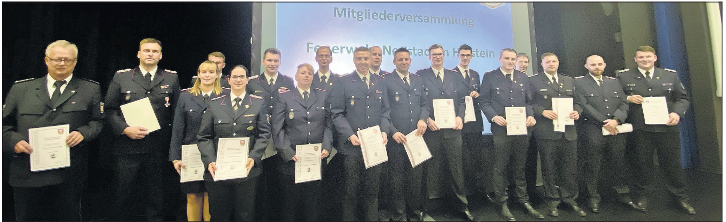
Herzlichen Glückwunsch an alle Geehrten und Beförderten.

Wahlen, Beförderungen und Ehrungen bei der Feuerwehr Neustadt