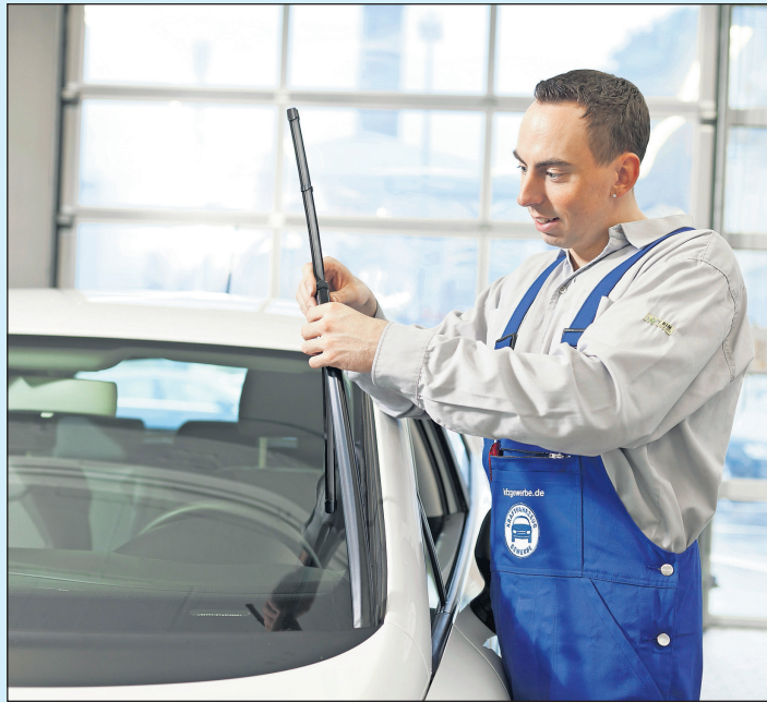
Schmieren die Wischblätter oder lassen ganze Flächen ungewischt, ist ein Austausch fällig.

Der nächste Blick gilt den Wischblättern. Schmierer sie bereits oder lassen ganze Flächen ungewischt, ist ein Austausch fällig. Sonst werden Fahrten bei Regen in der dunklen Jahreszeit zum Blindflug. Und dass die Beleuch-