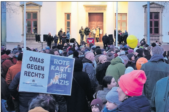
Bei der Mahnwache unter dem Motto „Aufstehen gegen Rechts“ waren die Omas gegen Rechts bereits mit ihren Plakaten dabei.

Für Rückfragen wenden Sie sich gerne an dseidel@stadt-neustadt.de oder nlevetzow@stadt-neustadt.de . Die Veranstaltungen behalten sich vor, vom Hausrecht Gebrauch zu machen und Personen, die rechtsextremen Parteien oder Organisationen angehören, der rechtsextremen Szene zuzuordnen sind oder während der Veranstaltung oder bereits in der Vergangenheit durch rassistische, nationalistische, antisemitische oder sonstige menschenverachtende Äußerungen in Erscheinung getreten sind, den Zutritt zur Veranstaltung zu verwehren oder von dieser auszuschließen. (ko/red)