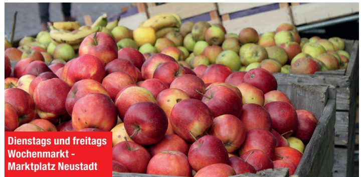
Dienstags und freitags Wochenmarkt - Marktplatz Neustadt

11 bis 17 Uhr - Showtime bei der Eiswelt Scharbeutz, Kurpark, Scharbeutz