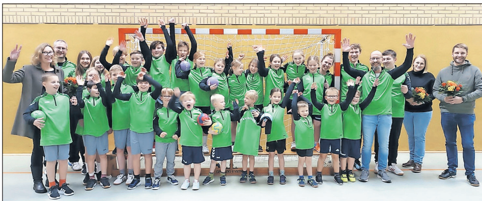
Die Jugendmannschaften freuen sich mit ihren Sponsoren über die einheitlichen Aufwärmpullis.