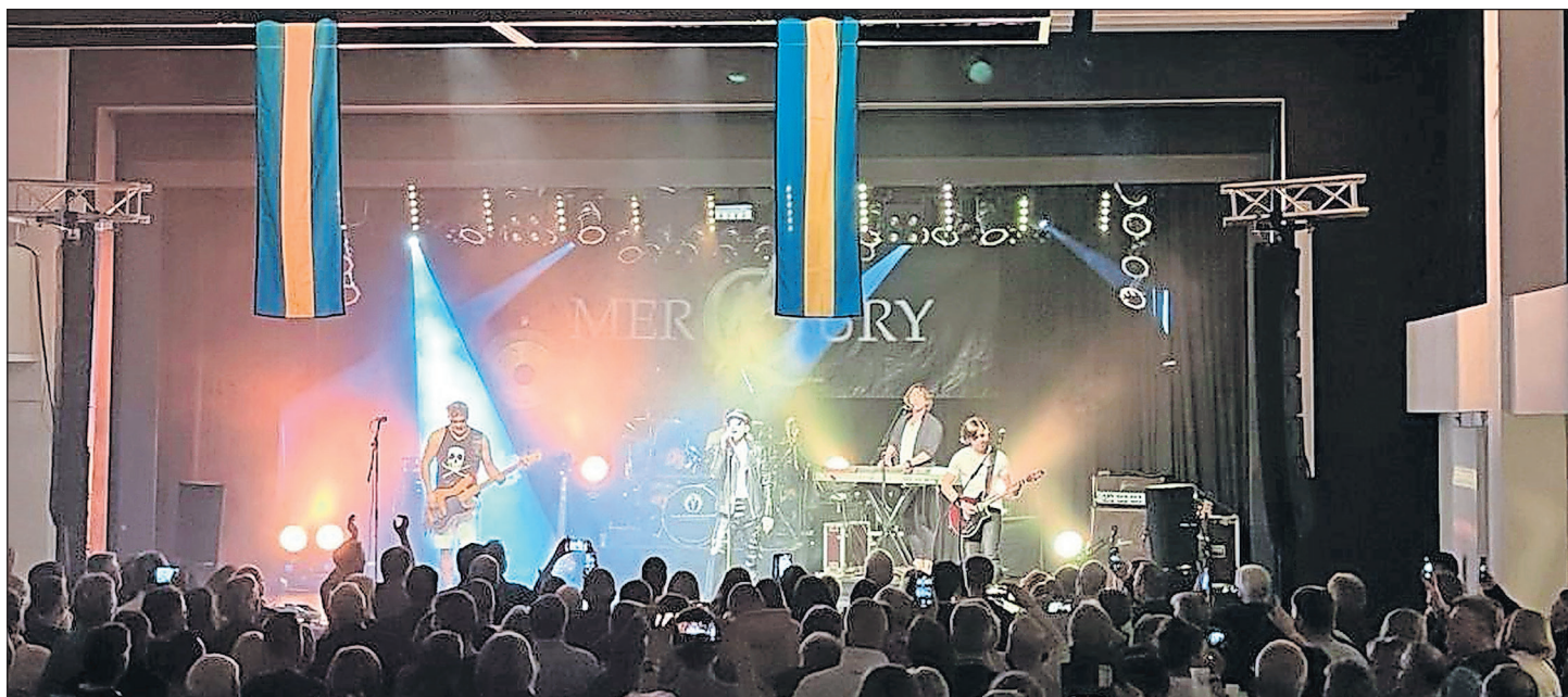
MerQury begeisterte mit brilliantem Sound und einer aufwendigen Lichtshow

Neustadt. Die Lions Fördergesellschaft lud zum Konzerthighlight in den Theatersaal der Jacob-Lienau-Schule ein und die 450 Karten für dieses Event waren binnen weniger Tage ausverkauft: Die Queen-Coverband MerQury begeisterte am vergangenen Samstag mit brilliantem Sound, aufwendiger Lichtshow und schrillen Kostümen. Die Stimmung im Publikum war ausgelassen und fast familiär, denn neben der Musik genossen die Gäste in vollen Zügen die stadtfestähnliche Atmosphäre mit vielen Freunden, Nachbarn und Bekannten, die sich ebenfalls das beliebte Lions-Konzert nicht entgehen ließen. Wie in den Jahren zuvor wird der gesamte Erlös der Veranstaltung über den Karten- und Getränkeverkauf sozialen Projekten in Neustadt zugutekommen. (red)