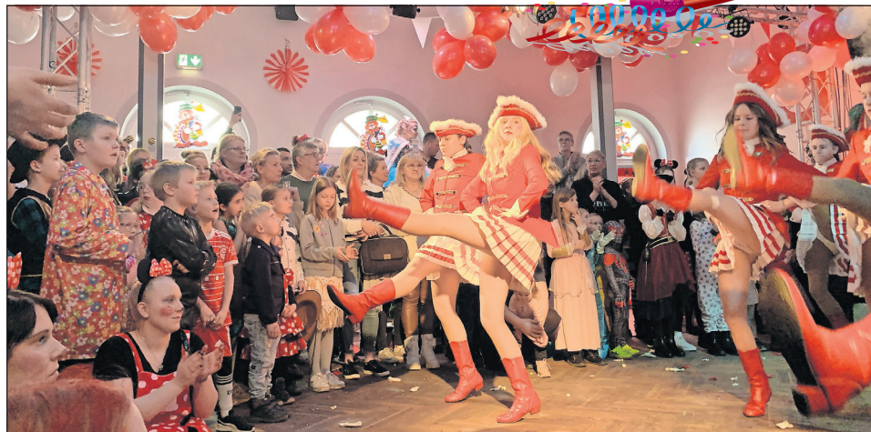
Nach intensiver Vorbereitung haben die Garden jetzt ihren großen Auftritt.