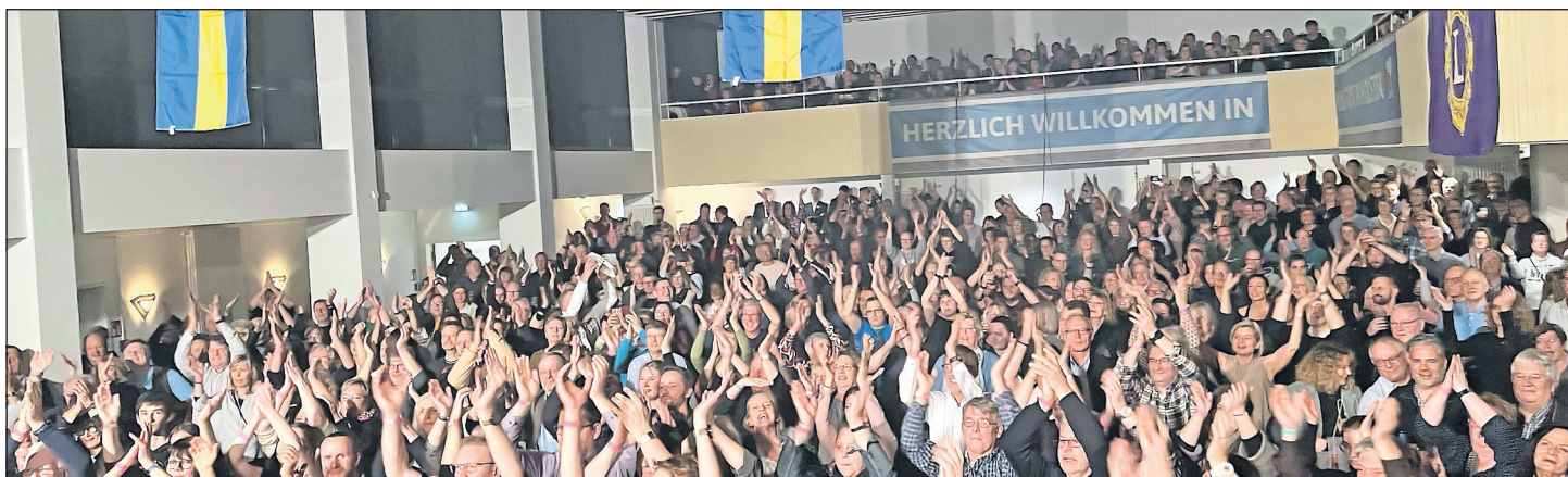
Die Stimmung im Publikum war ausgelassen.