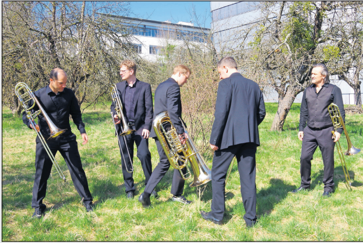
„WPR Low Brass“.

Cismar. Am Samstag, dem 10. Februar um 19.30 Uhr lädt der Förderkreis Kloster Cismar zum letzten Konzert dieser Wintersaison in den „Klosterkrug“. Wenn Posaunen und Tuba im Orchester ihre Instrumente ansetzen, erwartet man tiefe und vor allem laute Töne. Doch das schwere Blech kann auch anders: Für ihren „Karneval des tiefen Blechs“ haben „WPR Low Brass“ einige Überraschungen vorbereitet. Wer hätte gedacht, dass sich vier Posaunisten und ein Tubist an Camille Saint-Saëns' „Karneval der Tiere“ wagen? So vielfältig und überraschend die Tierwelt ist, so flexibel und filigran wird in