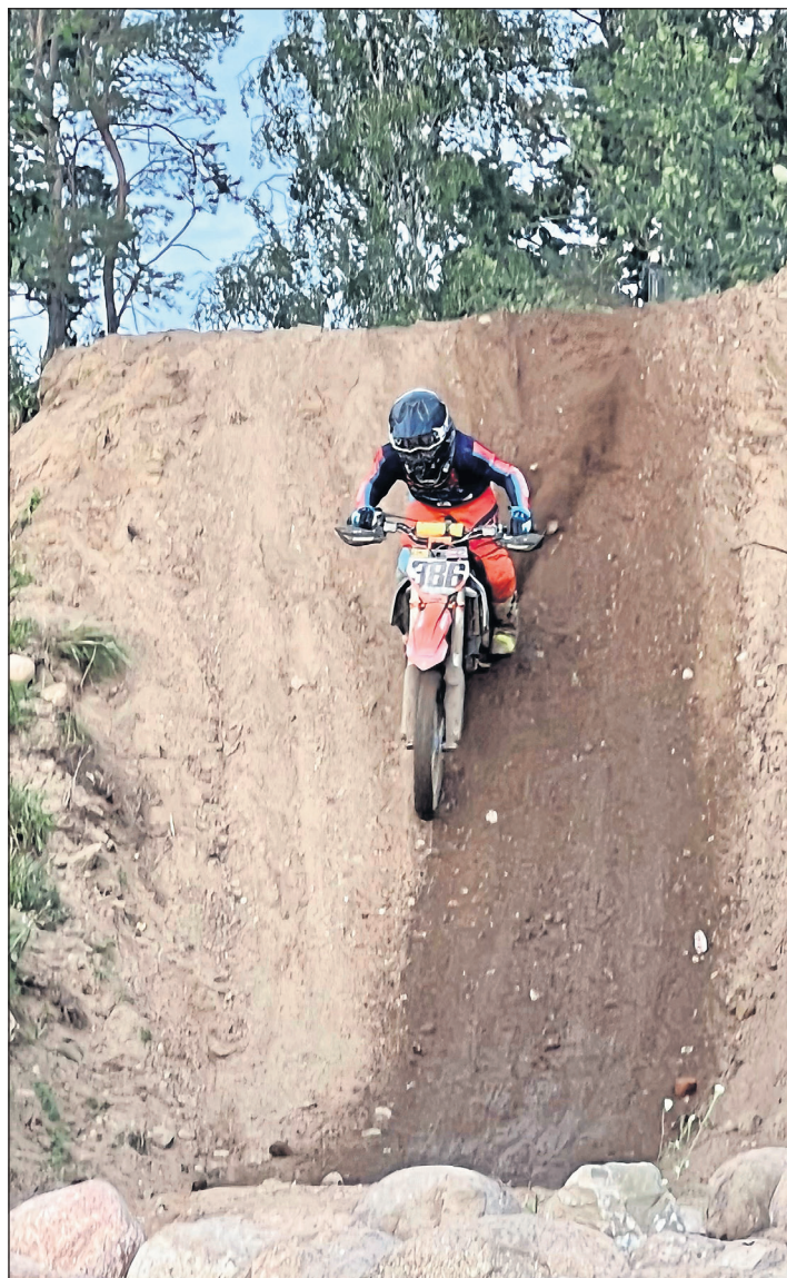
Steil bergab ins Steinfeld - das erfordert viel Konzentration und jahrelanges Training.