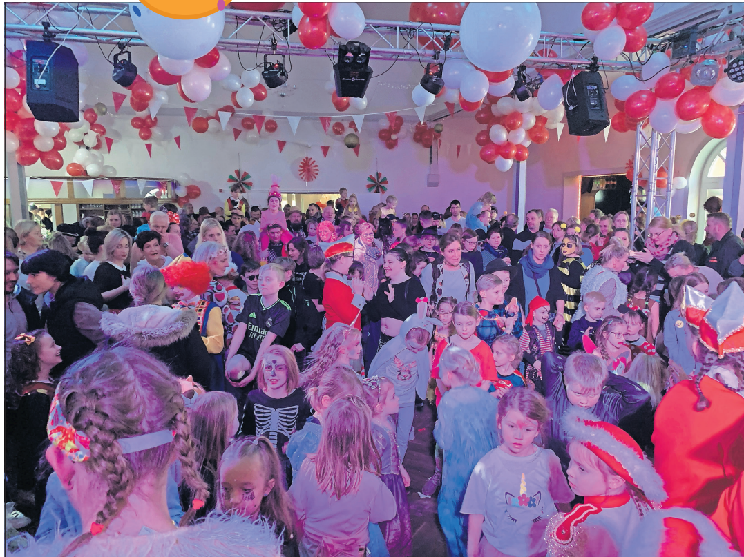
Bei den Karnevalsfeiern im Landhaus Lunau geht es bunt, fröhlich und ausgelassen zu.

Schönwalde. „La-Ba“ - Der TSV Schönwalde steht in den Startlöchern für die närrische Zeit und die Vorbereitungen für den „74. Karneval am Lachsba“ laufen auf Hochtouren. Seit Oktober üben die Kindergarden, die Funkgarde, die Tanzgarde und die Männergarde fleißig ihre Tänze. Es steht außer Frage, dass die Tanzeinlagen die Stimmung auf dem Saal des Landhauses Lunau wieder auf den Höhepunkt bringen werden. Neu in diesem Jahr ist eine Mini-Mix-Garde. Aufgrund der hohen Nachfrage für die kleinste Funkgarde, in der ab Schulbeginn getanzt werden kann, haben die Leiterinnen der Kinder- und Jugendgarden Jennifer