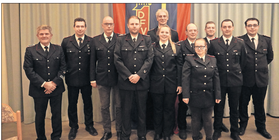
Alle anwesenden geehrten und beförderten Mitglieder.