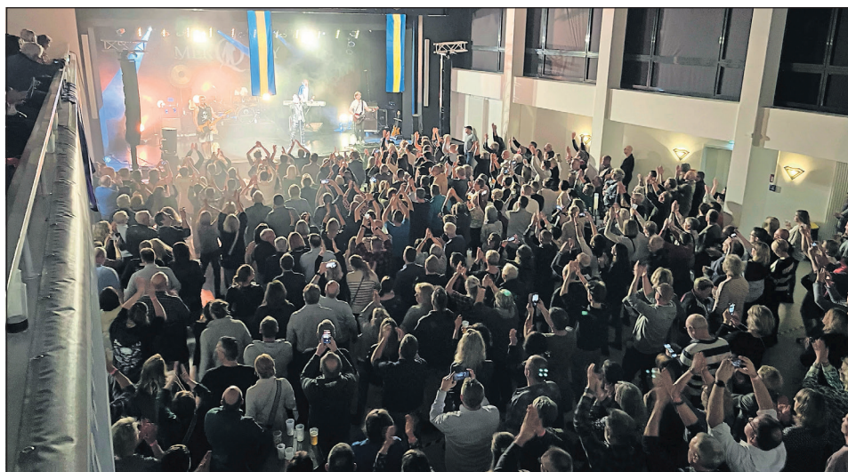
Der Theatersaal war bis auf den letzten Platz besetzt.