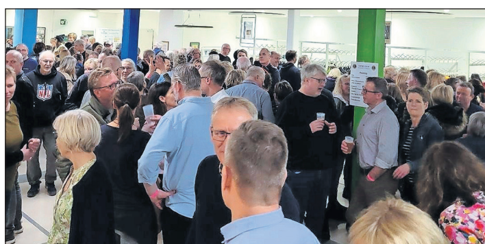
Die Pausen wurden für angeregte Gespräche im Foyer genutzt.