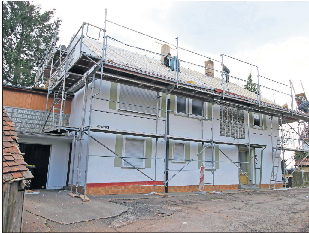
Eine energetische Haussanierung sollte nicht nur im Heizungskeller ansetzen, sondern das gesamte Gebäude im Fokus haben.