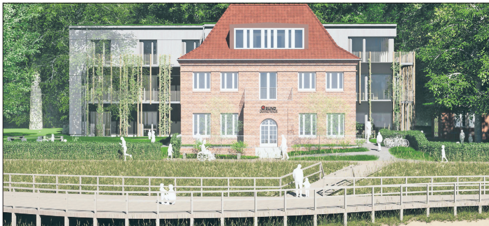
So soll es nach der Fertigstellung aussehen, das BUND Umwelthaus.