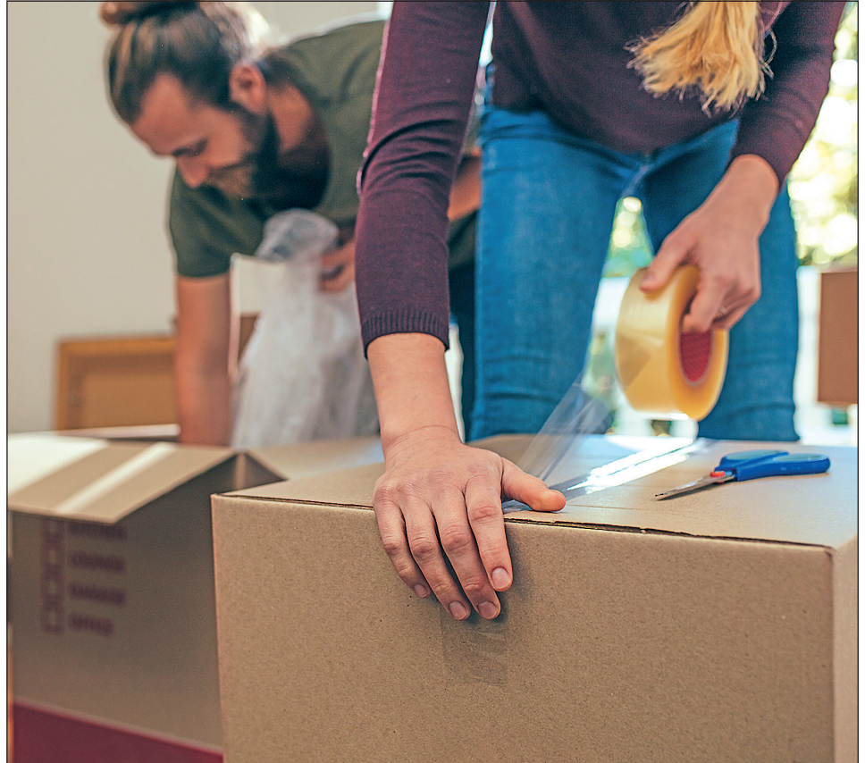
Genügend Kartons, Packpapier und Klebeband gehören zur Grundausrüstung, wenn der Umzug reibungslos laufen soll.

Ein weiterer zentraler Punkt ist das Ummelden: Innerhalb von zwei Wochen nach dem Umzug muss die neue Adresse beim Einwohnermeldeamt