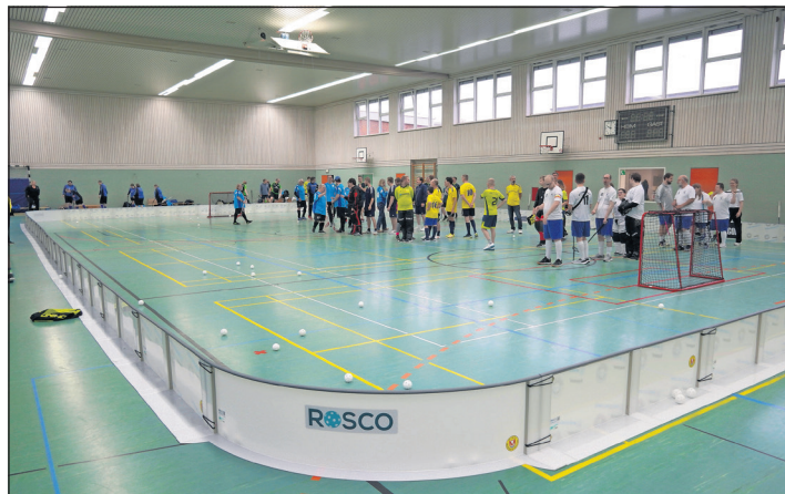
Die neue modulare Bande kam beim inklusiven Floorball-Turnier in Neustadt erstmals zum Einsatz.