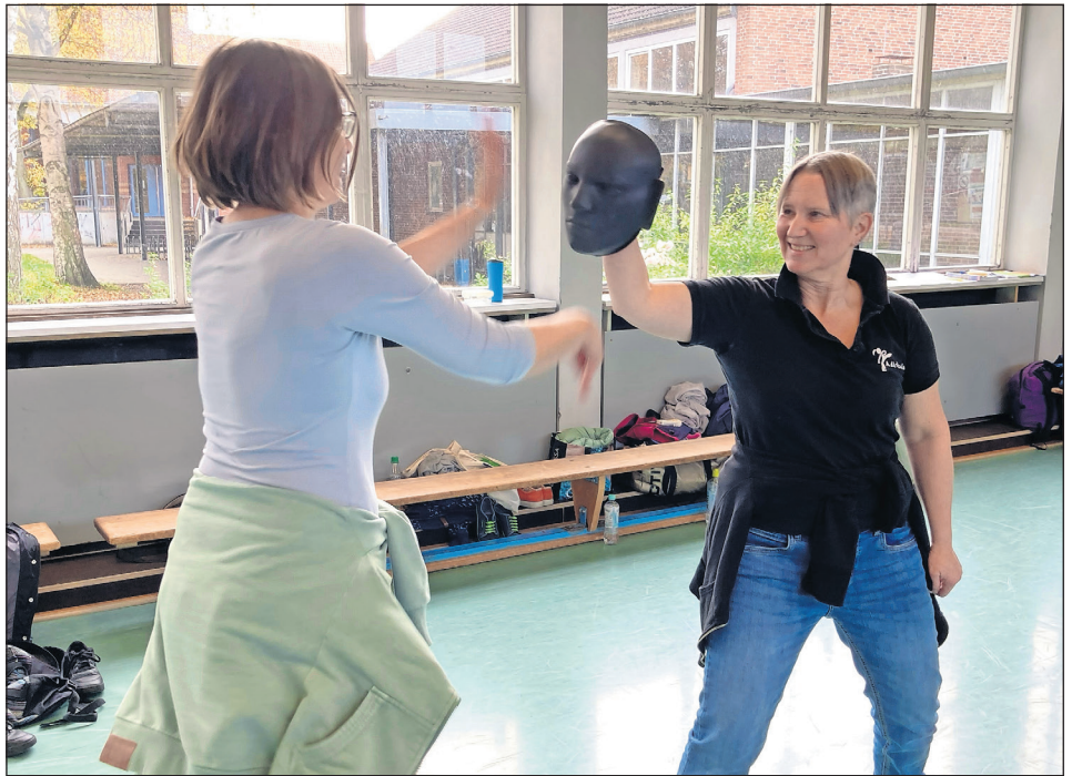
Die Teilnehmerinnen erlernen einfache und dabei sehr wirkungsvolle Techniken zur körperlichen Selbstverteidigung.