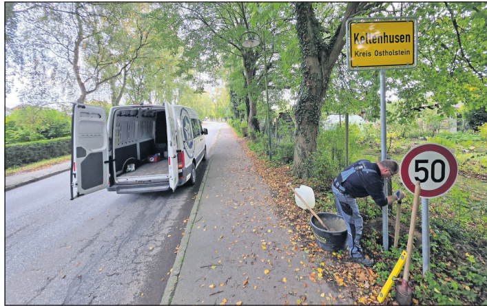
Der Bauhof hat das neue Ortsschild in Kellenhusen aufgestellt und gesichert.

Kellenhusen. Kellenhusen erfreut sich nicht nur bei Urlaubern großer Beliebtheit. Auch das Ortsschild ist als Souvenir gefragt. Zum wiederholten Mal machte sich auch in diesem Jahr wieder jemand daran, das gelbe Ortsschild zu entwenden. Aufgrund der gesicherten Schrauben fiel diesmal die Diebstahllaktion besonders dreist aus: Der Schilderpfosten wurde mit einem Trennschleifer durchgeflext. Damit wurde bei der Polizei nicht nur Diebstahl, sondern auch Sachbeschädigung angezeigt. Nun steht das Ortsschild wieder an seinem angestammten Platz an der Waldstraße, stabiler denn je. Denn um künftige Diebstähle zu verhindern, wurde das Innere des Pfostens ausgegossen und so für maximale Stabilität gesorgt. Die Gemeinde Kellenhusen geht davon aus, dass diese Maßnahme das Schild künftig vor weiteren Diebstahlsversuchen schützt. Wer eine Erinnerung mitnehmen möchte, darf gerne ein Foto machen. (red)