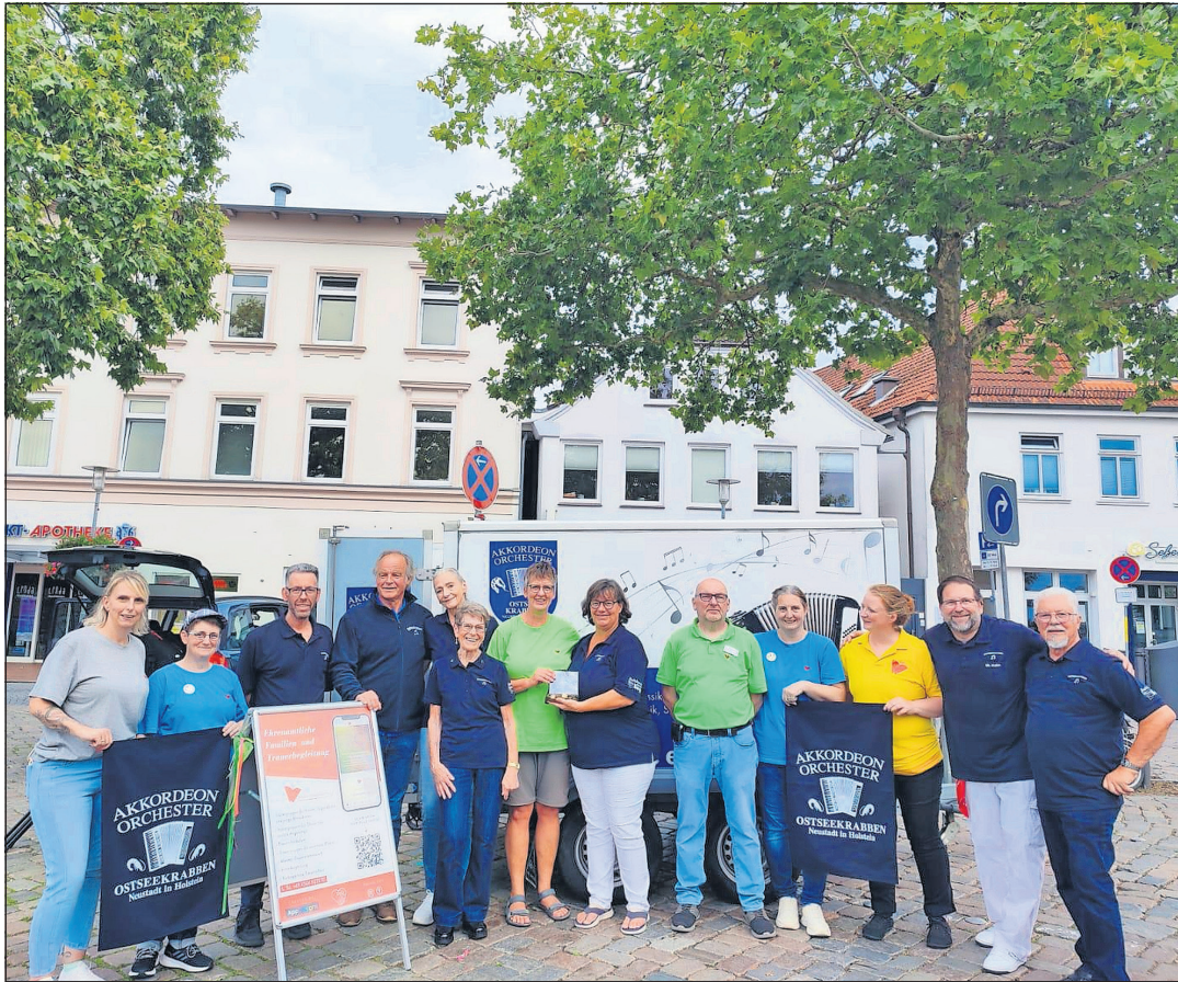
Spendengeldübergabe beim Weltkindertag für den Verein „Kinder auf Schmetterlingsflügeln“ Hospiz in Ratekau.

Neustadt. Das Akkordeonorchester „Ostseekrabben“ lädt am 1. Advent, dem 30. November, um 15 Uhr zum 44. Adventskonzert in die Aula der Jacob-Lienau-Schule, Schulstraße 2, in Neustadt ein. In diesem Jahr steht das traditionsreiche Konzert unter einem besonderen Motto: Das Orchester feiert das Akkordeon, das für 2026 zum „Instrument des Jahres“ gekürt wurde.