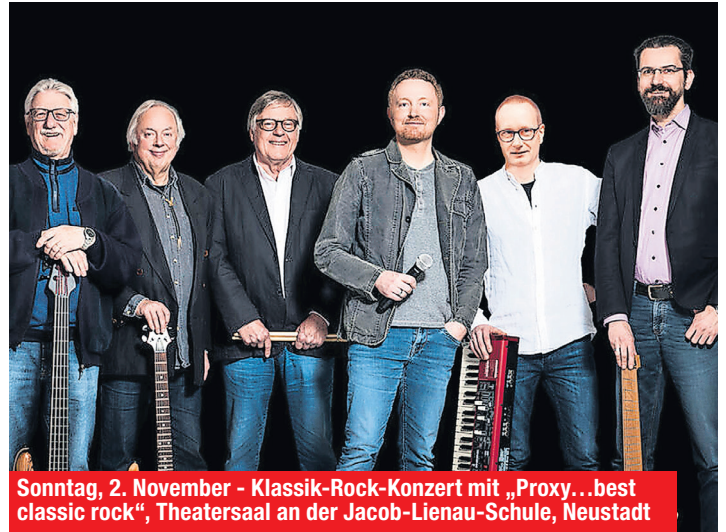
Sonntag, 2. November – Klassik-Rock-Konzert mit „Proxy...best classic rock“, Theatersaal an der Jacob-Lienau-Schule, Neustadt

11 bis 14 Uhr – Mittagessen beim Bürgertreff der Tafel , Sandberger Weg 76, Neustadt