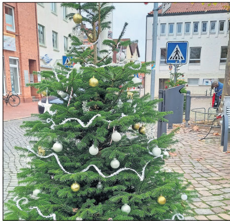
Ziel der Aktion ist, dass möglichst viele Bäume geschmückt werden.

sen, auf dem sichtbar wird, wer diesen Baum geschmückt hat.