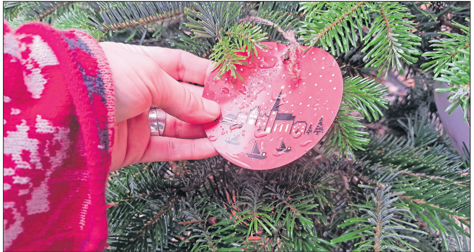
Beim Baumschmuck sollte auf Nachhaltigkeit geachtet werden.

Neustadt. Seit dem Jahr 2020 ruft das Neustädter Stadtmarketing zum Schmücken der Tannenbäume in der Innenstadt und am Hafen auf. Ab dem 27. November können die „Schmück-mich-Bäume“ wieder von Vereinen, Initiativen, Gewerbetreibenden, Einheimischen, Kitas und Schulen geschmückt werden. Diese sogenannten „Schmück mich-Bäume“ werden am 25. und 26. November durch den städtischen Bauhof in der Innenstadt und am Hafen aufgestellt und können dann ab dem 27. November nach Herzenslust geschmückt werden. „Wir freuen uns, wenn auch in diesem Jahr wieder viele Menschen diesem Aufruf folgen und sich für die Dekoration der „Schmück-mich-Bäume“ einsetzen“, ruft Andrea Brunhöber vom Stadtmarketing zum Mitmachen auf und weist darauf hin, dass eigener, ausgedienter Weihnachtschmuck, aber auch Naturmaterialien wie Äpfel oder Zapfen zum Einsatz kommen können. Wer mag kann im Anschluss auch ein Schild hinterlas-