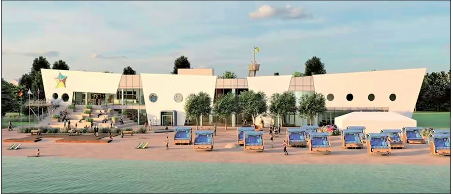
Die Strandansicht des neuen Gästezentrums erinnert an einen Schiffsrumpf und ist in den Ausmaßen nur geringfügig größer als die jetzigen Bauten.