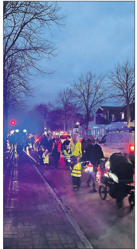
Viele bunte Laternen erleuchteten den Weg durch die Straßen.