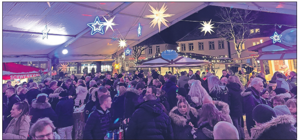
Am Donnerstag, dem 27. November um 17 Uhr wird der Wintertreff mit einer After-Work-Party eröffnet.

Die Tannenbaum-Glücksrad-Aktion wird zugunsten der Neustädter Kitas umgesetzt. Am Holz-Glücksrad gibt es Gutscheine für einen Tannenbaum aus Sierhagen zu gewinnen. An den ersten drei Adventssamstagen gibt es die Gelegenheit, einen der 60 Gutscheine zu gewinnen, die der Neustädter Gewerbeverein für diese Aktion zur Verfügung stellt. Die Gutscheine können dann entweder direkt in Sierhagen eingelöst oder am 20. Dezember von 11 bis 12 Uhr direkt auf dem Wintertreff in einen Tannenbaum eingetauscht werden.