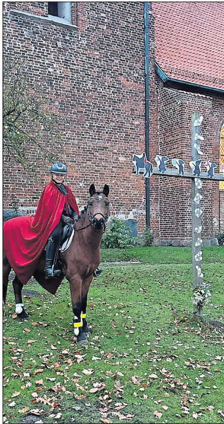
Am 11. November ritt „Sankt Martin“ wieder durch Lensahn.