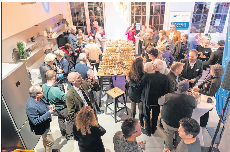
Auch diesmal gab es nach dem inhaltlichen fachlichen Input ausreichend Zeit und Gelegenheit für Gespräche und einen intensiven Austausch aller Beteiligten.

Neustadt. Am 13. November kamen rund 80 Vertreterinnen und Vertreter aus Wirtschaft, Politik und Wissenschaft zusammen, um an der 8. Wirtschafts-Lounge teilzunehmen. Das Unternehmens-Netzwerk der Stadt wurde gemeinsam mit dem Gewerbeverein Neustadt in Holstein und der IHK zu Lübeck mit und bei der Leaders Academy Hamburg-Lübeck im Hafenraum auf der Hafenwestseite veranstaltet. Das Thema des Abends lautete: „Talente an Bord - Fachkräfte finden und binden“ und war bereits im Vorfeld ausgebucht.