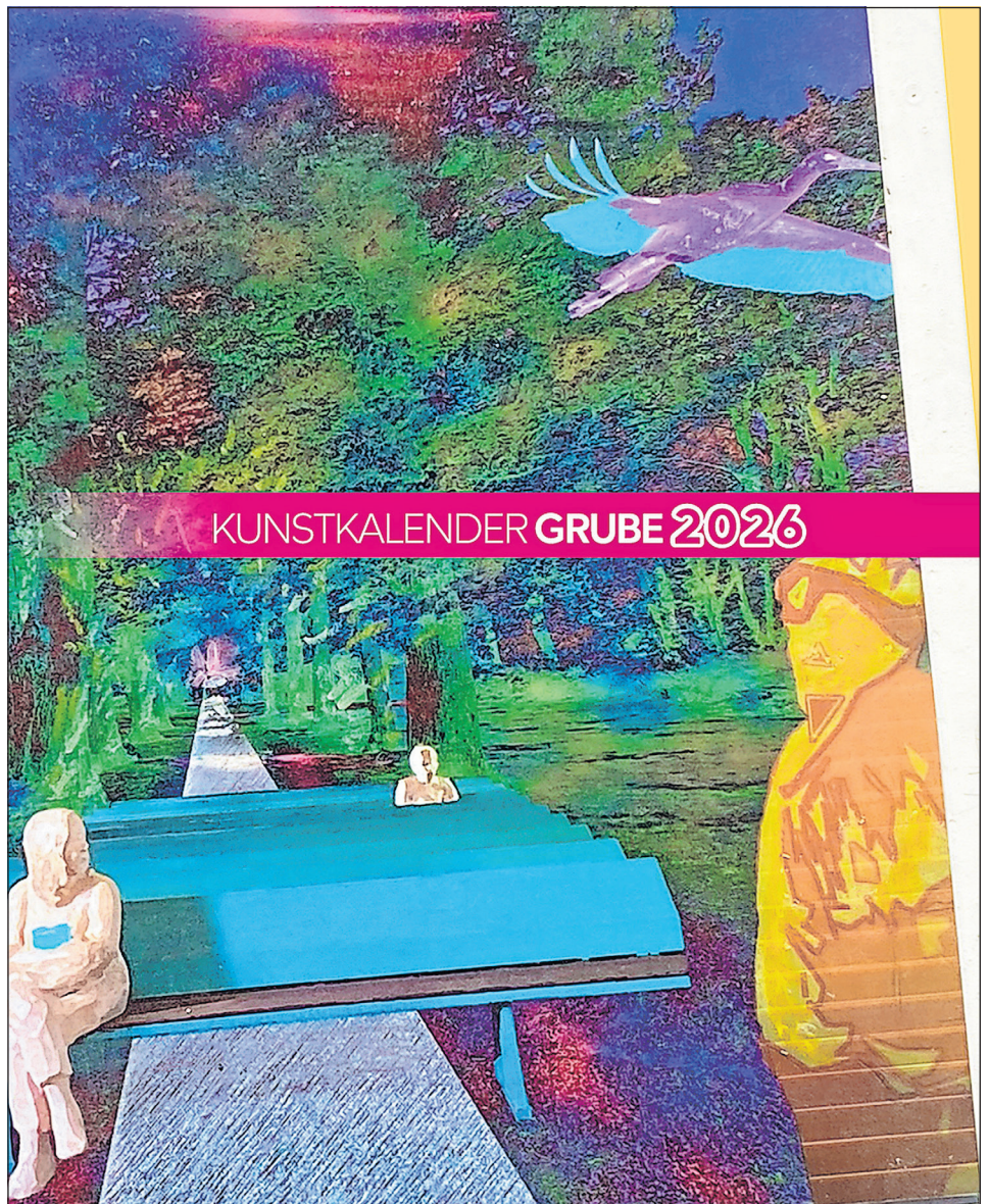
Der Gruber Kunstkalender, hier die Titelseite, erscheint im handlichen Moleskine-Format (A5).