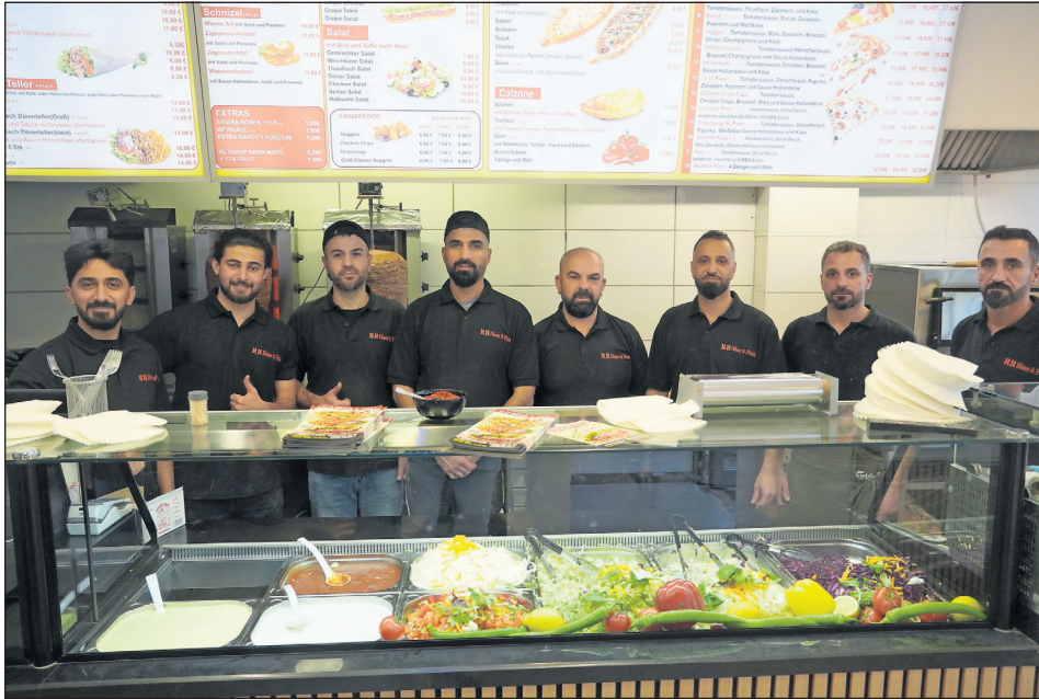
Das Team von „11.11 - Döner & Pizza“ in Lensahn.

„11.11 - Döner & Pizza“ hat in der Lübecker Straße 3 eröffnet