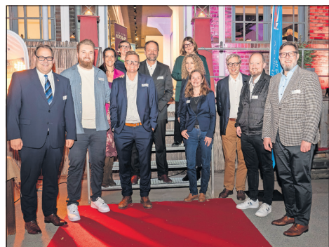
Die Referenten, Veranstalter und Partner der achten Wirtschafts-Lounge freuten sich, dass der Abend so gut ankam.