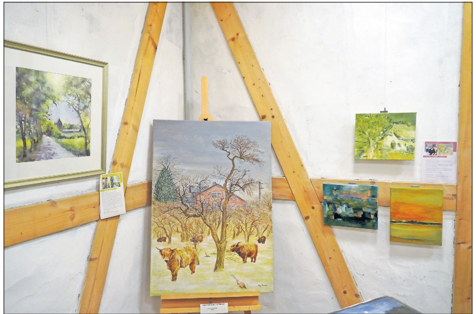
Ausgewählte Werke können erworben werden.

Die Ausstellung wird am heutigen Samstag, dem 29. November von 12 bis 18 Uhr im Rahmen des Gruber Weihnachtsmarktes für die Öffentlichkeit zugänglich sein. Besucherinnen und Besucher können dabei nicht nur den neuen Kalender bestaunen, sondern auch ausgewählte Werke direkt erwerben. Der Gruber Kunstkalender 2026, der zugleich als praktischer Terminkalender nutzbar ist, unterstützt die regionale Kunstszene. Er ist für 19 Euro erhältlich.