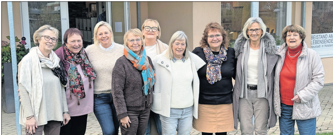
Die Golfdamen mit Vorstandsmitgliedern am Standort des Vereins „Beistand am Lebensende“ Am Holm.

Neustadt. Bei den Damen des Golfclubs Brodauer Mühle geht es um mehr als ein gutes Handicap. Seit 2014 schwingen sie ihre Schläger nicht nur für Punkte, sondern auch