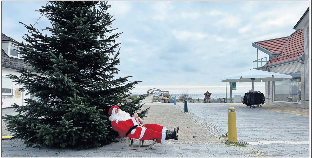
Der Nikolaus auf dem Weg zum Kellenhusener Nikolausfrühstück.

Eine rechtzeitige Anmeldung ist Voraussetzung für die Teilnahme am Nikolaus-Frühstück, da die Plätze begrenzt sind. Eintrittskarten sind in der Tourist-Information in der Waldstraße 1 während der Öffnungszeiten montags bis freitags von 9 bis 16 Uhr erhältlich. (red)