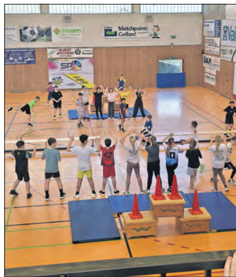
Austragungsort für den schulinternen Wettstreit war die Neustädter Gogenkrog-Halle.

Die 10. Klassen hatten einen speziellen Anreiz, denn sie spielten nicht nur gegeneinander, sondern auch gegen ein Lehrerteam. Die Schüler kämpften ehrgeizig, aber die Lehrer siegten gegen beide Klassen 2:0. Als Siegerteam ihrer Gruppe durften die Lehrer das Endspiel gegen die 9a bestreiten und verloren diese Partie. (red)