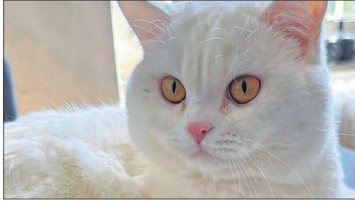
Simba ist ein echter Gentleman auf Samtpfoten.

Vertrauen gefasst hat, zeigt er schnell seine verschmuste und liebevolle Seite. Auch kleine Spieleinheiten mag er gern, insgesamt ist er aber eher der entspannte Genießer. Simba wurde bisher ausschließlich als Wohnungskatze gehalten. Er ist ein Kater, der Gefahren draußen nicht gut einschätzen kann, daher kommt Freigang für ihn nicht infrage. Simba wünscht sich ein ruhiges, strukturiertes Zuhause mit Menschen, die ihm Zeit und viel Zuneigung schenken.