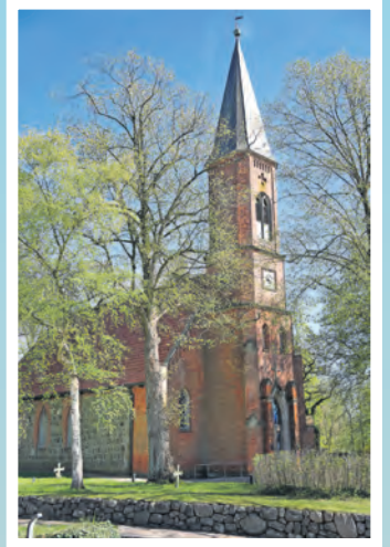
Die Kirche zu Schönwalde ist eine von Benediktinermönchen errichtete Feldsteinkirche aus der Zeit der mittelalterlichen Kolonisation.

Festzuhalten bleibt: Ein Besuch in Schönwalde am Bungsberg lohnt sich. Auch wenn der Ort zwischenzeitlich aufgrund von Baustellen, die für die Einwohnerinnen und Einwohner durchaus eine Belastungsprobe darstellen, schwerer zu erreichen war, überwiegt seine Schönheit. Die vielen sehenswerten und erlebbaren Angebote sollte man sich nicht entgehen lassen. (red)