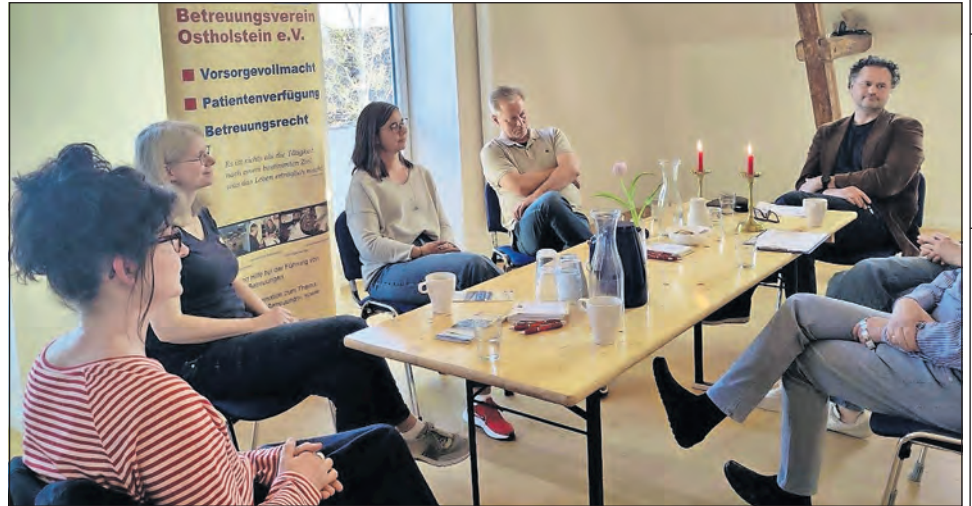
Der Erzähler Salon des Betreuungsvereins Ostholstein bot Raum für Austausch und gegenseitige Stärkung.

Die Schilderungen bewiesen, wie sehr sich vorschnelle Einordnungen relativieren. Menschen sind widersprüchlich, oft anders, als es zunächst den Anschein hat. Diese Offenheit auszuhalten, anzunehmen und sich immer wieder neu einzulassen, gehört für viele zum Kern ihrer Tätigkeit. So entstand das Bild eines Amtes, das fordert und berei-