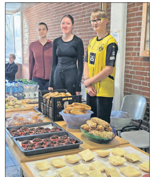
Stärkung am Buffet.