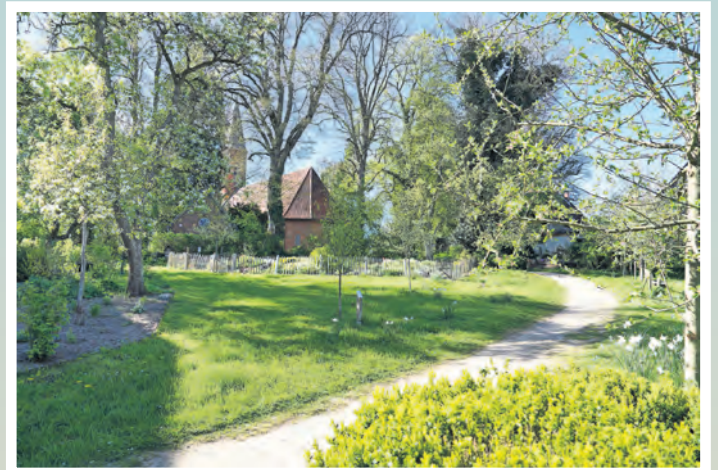
Naturerlebnisraum: Rund um die Schönwalder Kirche lädt eine etwa 4,5 Hektar große Fläche mit Pastorat, Gemeindehaus und Pfarrscheune zum Entdecken und Verweilen ein.