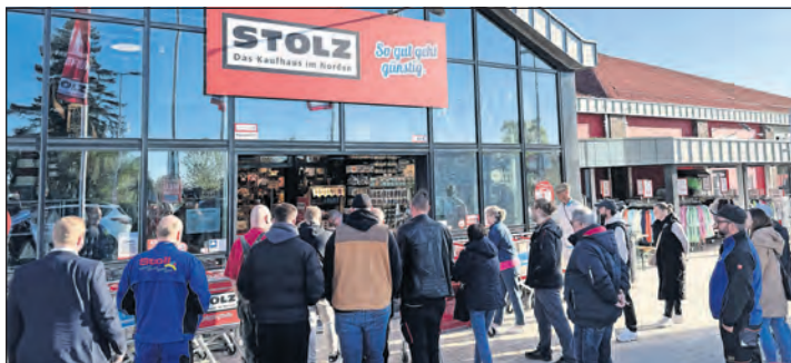
Großer Andrang zur Eröffnung: Zahlreiche Besucher warteten vor dem Eingang, um einen ersten Blick in das neue Kaufhaus Stolz zu werfen.

Das neue Zentrum solle für kurze Wege, setze neue Impulse für den Ort und habe zugleich positive Effekte für die Gemeindekasse. „Ein neues Geschäft bedeutet Leben im Ort“, betonte der Bürgermeister.