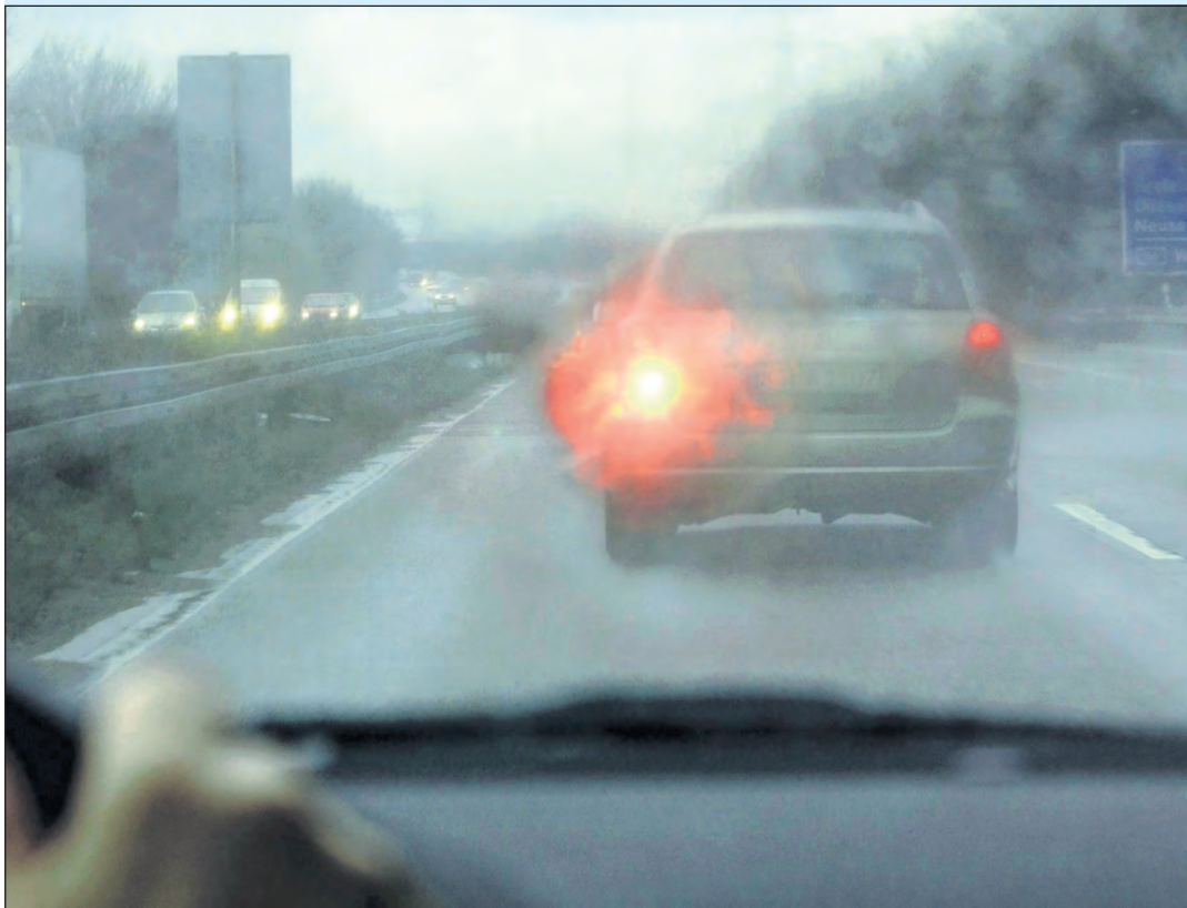
Bei einer Sicht von unter 50 Metern sollte die Nebelschlussleuchte eingeschaltet werden.

So bleiben Autofahrende sicher unterwegs