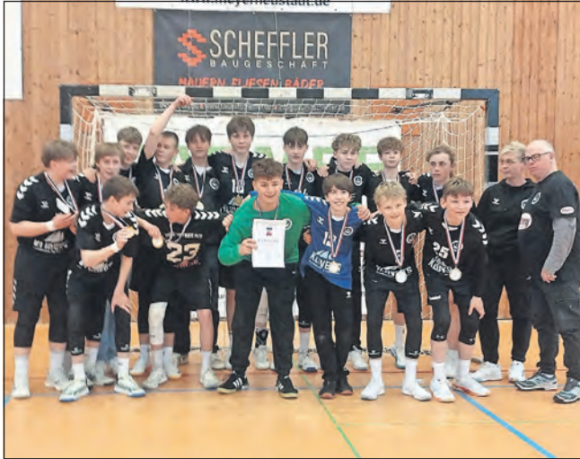
Die Meisterschaftsmannschaft männliche Jugend C1 der HSG Ostsee.