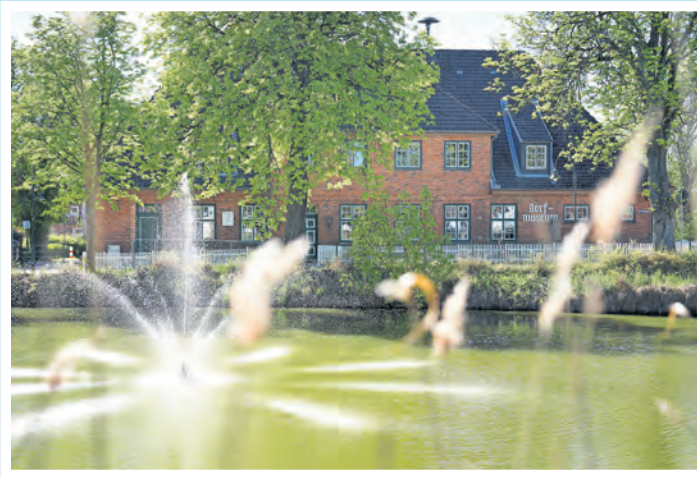
Idyllischer Blick auf Schönwalde: Im Vordergrund der Mühlenteich mit Wasserspiel, dahinter das Dorf- und Schulmuseum in der ehemaligen Dorfschule.

Weitblick, Natur und ländliche Idylle in Schönwalde am Bungsberg