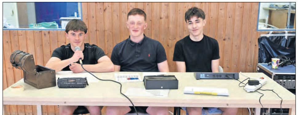
Professionelle Ansage der Spiele.