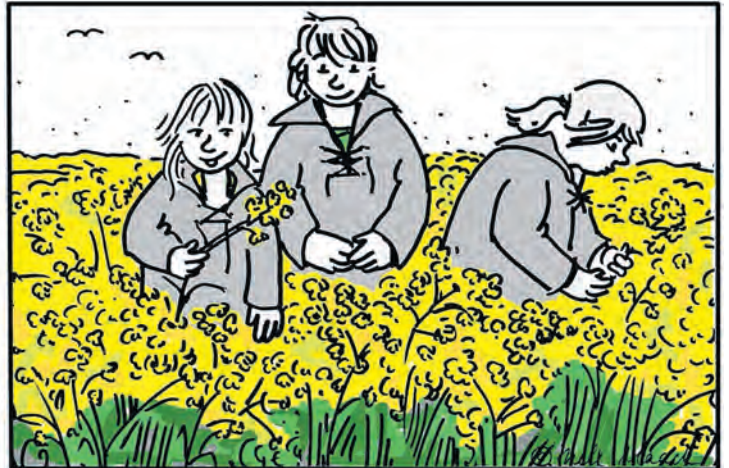
Im rechten Bild sind sechs Fehler versteckt.

In unserem Bilderrätsel stellt der reporter immer am Samstag eine „Aktivität der Woche“ vor, die man bei uns in der Region erleben kann. Dabei erhält man nicht nur interessante Impulse, sondern kann sich gleichzeitig auch auf Fehlersuche begeben. Illustratorin Nele Maack aus Hamburg zeichnete dafür wieder exklusiv eines ihrer beliebten Bilderrätsel. Das reporter-Team wünscht viel Spaß beim Rätseln. Ein warmer Frühlingstag, ein leichter Duft in der Luft und leuchtend gelbe Felder, soweit das Auge reicht. In Ostholstein gehört die Rapsblüte zu den eindrucksvollsten Naturschauspielen des Jahres. Zwischen Küste und Hinterland verwandeln sich ganze Landstriche für einige Wochen in ein intensives Gelb. Besonders schön lässt sich dieses Farbenspiel zu Fuß oder mit dem