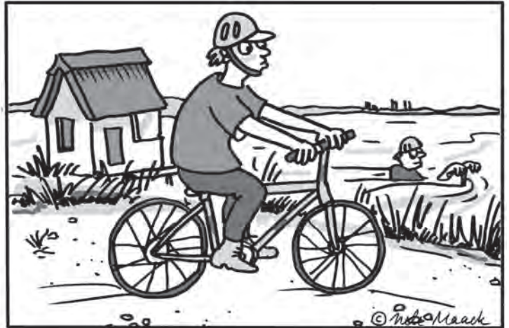
Im rechten Bild sind sechs Fehler versteckt.

In unserem Bilderrätsel stellt der reporter immer am Samstag eine „Aktivität der Woche“ vor, die man bei uns in der Region erleben kann. Dabei erhält man nicht nur interessante Impulse, sondern kann sich gleichzeitig auch auf Fehlersuche begeben. Illustratorin Nele Maack aus Hamburg zeichnete dafür wieder exklusiv eines ihrer beliebten Bilderrätsel.