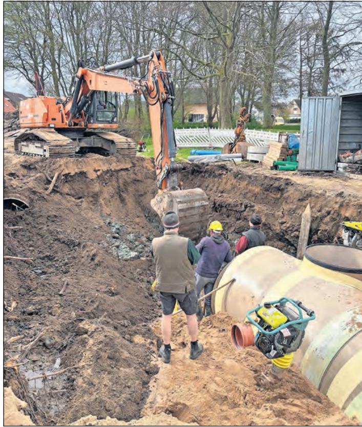
Bauarbeiten am dritten Bauabschnitt in Höhe Gemeindehaus/Geldskapelle.