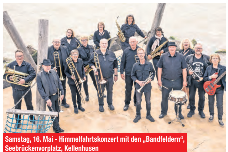
Samstag, 16. Mai - Himmelfahrtskonzert mit den „Bandfeldern“, Seebrückenvorplatz, Kellenhusen