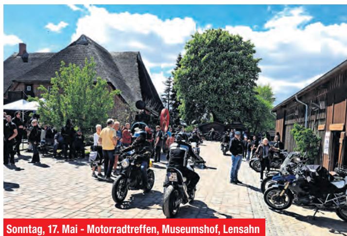
Sonntag, 17. Mai - Motorradtreffen, Museumshof, Lensahn

An der Wiek 7-15, 23730 Neustadt i. H. Telefon: 0 45 61 / 51 38 208 www.pier-19.de Öffnungszeiten: Fr. - Mi. 11.30 - 15 Uhr und 17 - 21 Uhr, Donnerstag Ruhetag