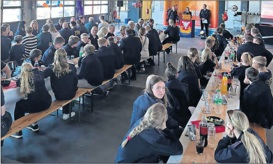
Vertreter beider Jugendfeuerwehren erinnerten beim Festkommers an 40 Jahre Partnerschaft.

Neustadt. Mit einem feierlichen Festkommers wurde am 1. Mai die 40-jährige Patenschaft zwischen der Jugendfeuerwehr Neustadt in Holstein und der Jugendfeuerwehr Neustadt/Hessen gefeiert. Vertreterinnen und Vertreter beider Feuerwehren und Jugendfeuerwehren blickten gemeinsam auf vier Jahrzehnte voller Begegnungen, Freundschaften und gemeinsamer Erlebnisse zurück.