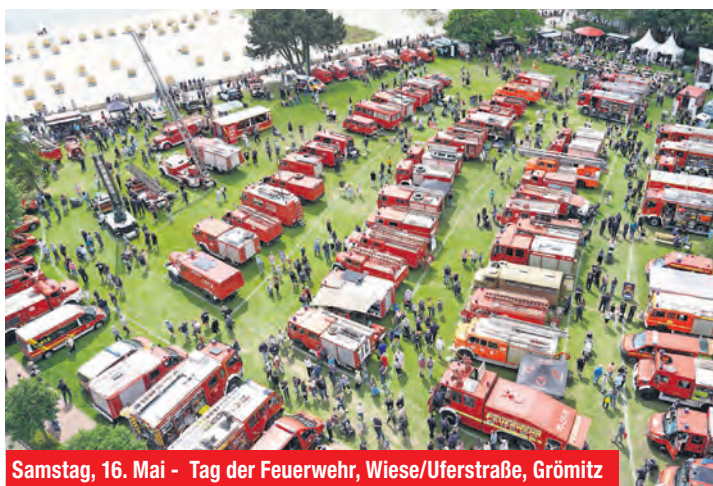
Samstag, 16. Mai - Tag der Feuerwehr, Wiese/Uferstraße, Grömitz

9 Uhr - Gesund & Entspannt - Asiabalance, Strandpromenade 15, Kellenhusen