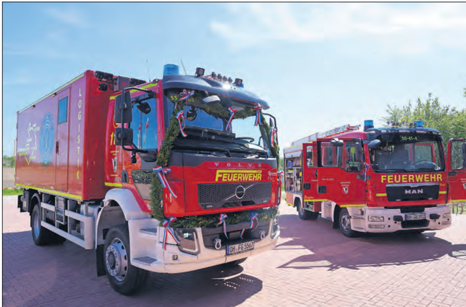
Der ganze Stolz der Gemeindefeuerwehr Grömitz und der Feuerwehr Guttau: Der Gerätewagen Logistik (vorn).