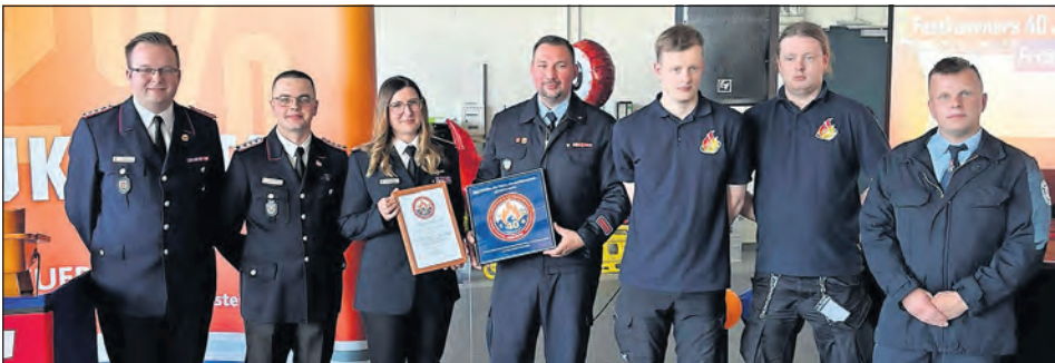
Mitglieder der Jugendfeuerwehr, Wehrführungen und Gäste nahmen am Festkommers teil.