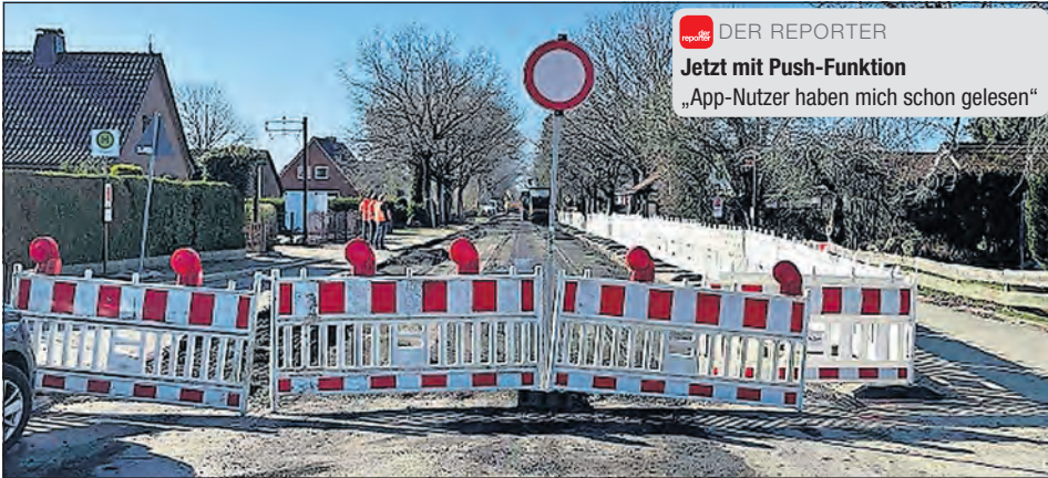
Der Teilabschnitt 1 der Fahrbahnerneuerung L 57 in Schönwalde liegt zwischen Einmündung „Ostpreußenweg“ und Einmündung „Am Steinberg“.

Schönwalde. Die Ortsdurchfahrt der Gemeinde Schönwalde am Bungsberg im Verlauf der L 57 ist sanierungsbedürftig, weil der gebundene Fahrbahnoberbau, der Asphalt, starke Risse aufweist. Außerdem ist er nicht mehr frostsicher. Das bedeutet in Summe, dass die Tragfähigkeit der Straße nicht mehr ausreichend und dauerhaft vorhanden ist (der reporter berichtete).