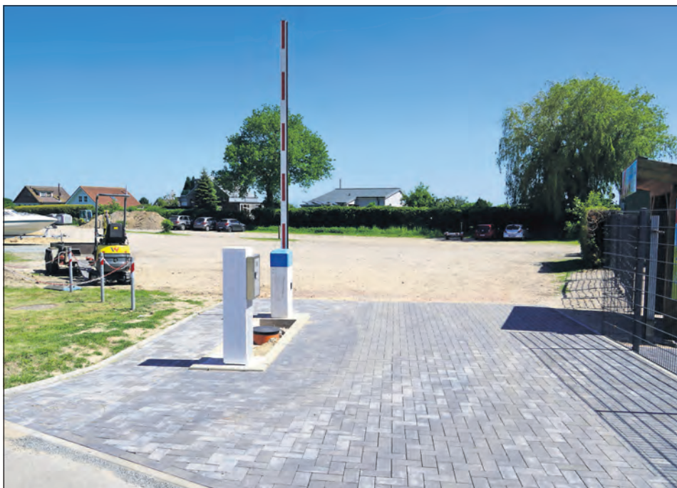
Die neuen Schrankenanlagen dienen der Umsetzung des beschlossenen Parkkonzeptes.

Bliedorf. In Bliedorf sorgt der Bau von Schranken an der Parkplatz-Zufahrt nahe des Restaurants Breeze derzeit für Rätselraten bei Einwohnern und Gästen. Der reporter hat bei Bürgermeister Rainer Holz „kurz nachgefragt“. Des Rätsels Lösung ist die Einführung einer kostenpflichtigen Parkplatznutzung während der Saison.