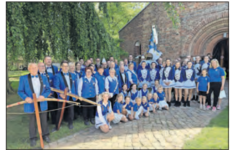
Die Mitglieder des Karnevalvereins Bi-Wa Altenkrempe versammelten sich vor der Kirche zum gemeinsamen Gruppenfoto.