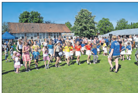
Die traditionelle Mittanzrunde sorgte bei Kindern und Erwachsenen gleichermaßen für beste Stimmung.