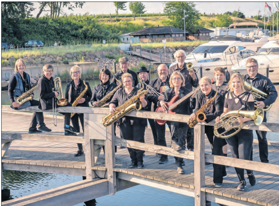
Die Bandfelder versprechen einen unterhaltsamen Abend mit Bigband-Sound.

Grömitz. Ein abwechslungsreicher Konzertabend mit Rock, Pop und Jazz erwartet die Besucher am Montag, 1. Juni, in der Strandhalle Grömitz. Dort gastiert ab 20 Uhr die Bigband „Die BANDfelder“ mit einem rund zweistündigen Programm. Die 20-köpfige Formation präsentiert eine Mischung aus bekannten Klassikern und neuen Arrangements. Auf dem Programm stehen unter anderem „It's not unusual“, „Shallow“ sowie ein