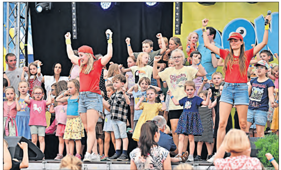
Die Donikk Crew begeistert auf dem Paasch-Eyler-Platz.

Grube. Tanzen, singen hüpfen: Die Power-Kinderband „Donikk Crew“ ist am Mittwoch, dem 8. Juli ab 16 Uhr mit ihrer Kindermusik-Show auf dem Paasch-Eyler-Platz in Grube. Durch Gesang und Rap, Mitmach-Bewegungen, Tanz und Mitsingen werden bei diesem Konzert-Spaß die Kinder zu Stars.