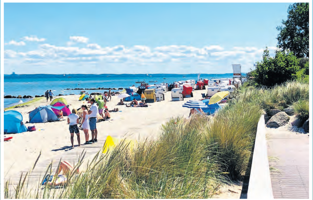
Der Retliner Strand ist besonders schön.

Die Strände von Pelzerhaken und Rettin ziehen Urlauber, Familien und Wassersportler gleichermaßen an. Besonders der in der Szene bekannte Surfstrand Pelzerhaken ist ein Eldorado für Kite- und Windsurfer, die die guten Bedingungen in der Lübecker Bucht schätzen.