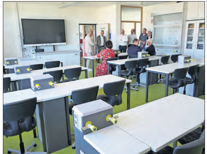
Chemieraum mit modernster Ausstattung.