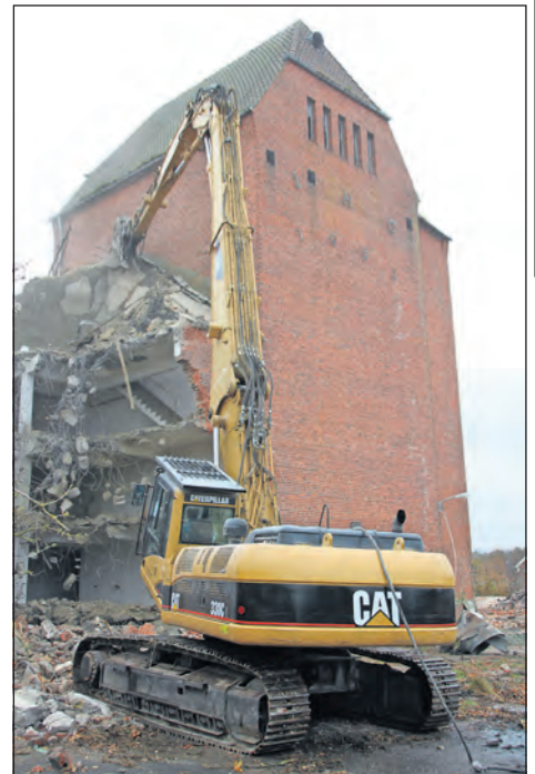
Rückbau der ehemaligen Getreidesilos mittels Hydraulikbagger mit Abbruchschere im November 2011.

Heute verfolgt die Gemeinde auf dem Gelände das Ziel, altersgerechten und sozialverträglichen Wohnraum zu schaffen. „Ein Investor für die Entwicklung der Fläche wird weiterhin gesucht“, betonte Bürgermeister Michael Robien auf der letzten Einwohnerversammlung. (mg)