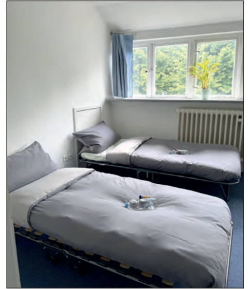
Alle Betten sind aufgebaut und vorbereitet, jetzt können die Gäste aus der Ukraine kommen.

Zum Abschluss des Treffens besichtigten die Gäste mit den Gastgebern gemeinsam die liebevoll vorbereiteten Räume. Dank der neuen Klappbetten können die ukrainischen Kinder dort in den kommenden Wochen nicht nur gut schlafen. Die Ausstattung bleibt dem Kinderschutzbund auch nach der Ferienfreizeit erhalten und kann künftig für weitere Projekte genutzt werden. (gm)