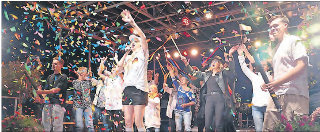
Bei der Playback-Show auf dem Seebrückenplatz feiert ganz Kellenhusen gemeinsam.

Kellenhusen. Morgens beim Frühstück noch ein Klönschnack mit den Gästen, abends als „Star“ auf der Bühne. Am Mittwoch, dem 8. Juli findet auf dem Kellenhusener Seebrückenplatz wieder die traditionelle Open-Air-Playback-Show des Tourismusvereins Kellenhusen statt. Ab 20 Uhr heißt es: „Hurra, das ganze Dorf ist da“ und das ist nicht nur der Titel des Eröffnungsliebes, sondern auch das Motto des Abends. Denn das Besondere an dieser Veranstaltung ist, dass alle Akteure Einheimische sind, die sich seit vielen Jahren ein Programm für die ganze Familie einfallen lassen.