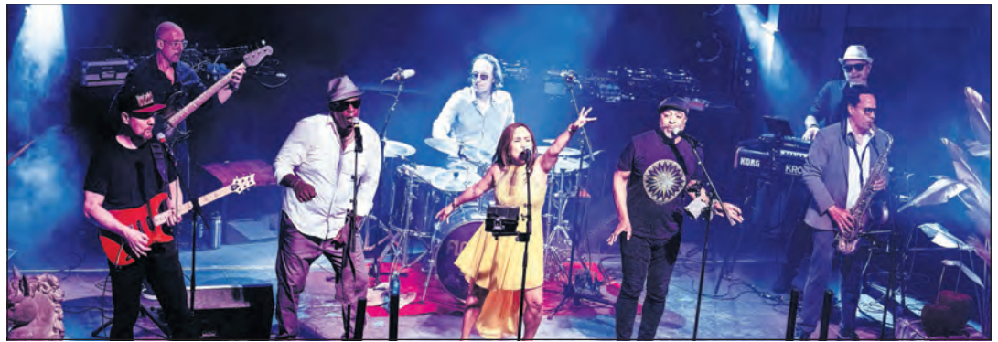
Funk & Soul Band „Floor54“.

Dahme. Am Donnerstag, dem 9. Juli ab 19 Uhr heißt es „Shake your hips to the groove of Funk, Disco & Soul.“ Die Funk & Soul Band „Floor54“ heizt den Kurpark so richtig ein. Der Abend wird von einer Lasershow begleitet und zwischendrin wird der Kinder- und Jugend-Zirkus