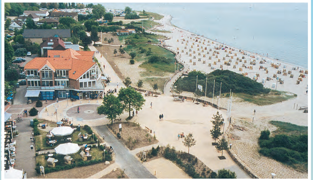
Der Holzsteg über den mit Dünen gesäumten Strand und die neu gestaltete Strandpromenade feiern Jubiläum.

Noch heute verbindet die Promenade Strand, Gastronomie, Geschäfte und den historischen Leuchtturm zu einem der beliebtesten Treffpunkte an der Lübecker Bucht. Die Dünenpromenade bietet einen besonderen