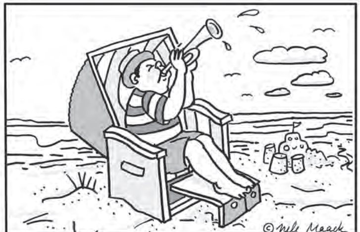
Im rechten Bild sind sechs Fehler versteckt.

In unserem Bilderrätsel stellt der reporter immer am Samstag eine „Aktivität der Woche“ vor, die man bei uns in der Region erleben kann. Dabei erhält man nicht nur interessante Impulse, sondern kann sich gleichzeitig auch auf Fehlersuche begeben. Illustratorin Nele Maack aus Hamburg zeichnete dafür wieder exklusiv eines ihrer beliebten Bilderrätsel.