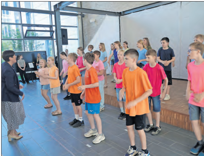
Musikalische Begleitung des Festaktes durch die Klasse 5b.

Die Entwicklung des Küstengymnasiums ist damit jedoch noch nicht abgeschlossen. Mit dem dritten Bauabschnitt, der die Sporthallen und die Außenanlagen umfasst, soll die Modernisierung konsequent fortgesetzt werden. Die erforderlichen finanziellen Mittel sind bereits im Investitionsplan der Stadt vorgesehen. (mg)