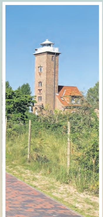
Zu den bekanntesten Sehenswürdigkeiten zählt der Leuchtturm in Pelzerhaken.

Auf den folgenden Seiten zeigen sich Pelzerhaken und Rettin von ihrer schönsten Seite. Entdecken Sie besondere Orte, spannende Unternehmen und viele gute Gründe für einen Besuch an der Ostsee. (gm)