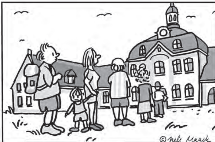
Im rechten Bild sind sechs Fehler versteckt.

In unserem Bilderrätsel stellt der reporter immer am Samstag eine „Aktivität der Woche“ vor, die man bei uns in der Region erleben kann. Dabei erhält man nicht nur interessante Impulse, sondern kann sich gleichzeitig auch auf Fehlersuche begeben. Illustratorin Nele Maack aus Hamburg zeichnete dafür wieder exklusiv eines ihrer beliebten Bilderrätsel.