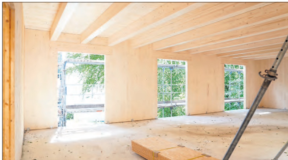
Holzgeruch liegt in der Luft, der Neubau des Umwelthauses wird unter Verwendung von nachhaltigen Baumaterialien und vor allem mit Firmen aus der Region errichtet.

Wir gratulieren zum Richtfest und freuen uns auf die Fertigstellung 2027!