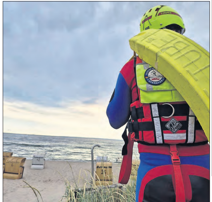
Ein Rettungsschwimmer der Feuerwehr brachte den Hund sicher an den Strand zurück.

Scharbeutz. Am Donnerstagmorgen wurden die Feuerwehr Scharbeutz, die DLRG Haffkrug-Scharbeutz und die Polizei zu dem Alarmstichwort „Tier in Not“ an den Strand in Scharbeutz alarmiert. Ein Hund war in der Ostsee baden und ist dabei immer weiter vom Strand abgetrieben. Der Hundebesitzer konnte seinen Hund nicht selbstständig aus der misslichen Lage befreien, woraufhin der Notruf gewählt wurde.