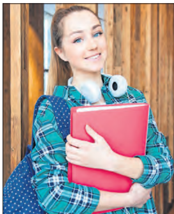
Freie Ausbildungsplätze jetzt im „reporter“ bewerben.

Neustadt. Sind Sie auf der Suche nach einem oder einer Auszubildenden? Haben Sie noch freie Ausbildungsplätze für 2026 zu vergeben? „der reporter“ hilft bei der Suche nach passenden Bewerberinnen und Bewerbern. Auf unseren Sonderseiten „Ausbildung“ am Mittwoch, dem 15. Juli haben Sie die Möglichkeit mit einer Anzeige gezielt potenzielle Nachwuchskräfte anzusprechen. Gerne beraten wir Sie und erstellen passende Anzeigenentwürfe. Sie erreichen uns montags, dienstags und donnerstags von 8.30 bis 18 Uhr, mittwochs 8.30 bis 16 Uhr und freitags von 8.30 bis 15.30 Uhr telefonisch unter 04561/51700, per Fax unter 04561/517090 oder per Mail an info@der-reporter.de . (red)