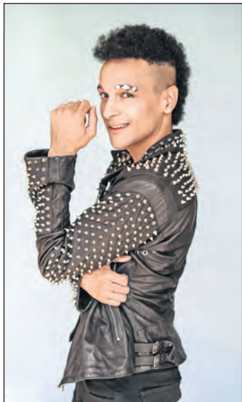
Prince Damien.

Dahme. Am Donnerstag, dem 16. Juli feiert Dahme die dritte Dahmer Schlagerparade mit bestem Entertainment aus Schlagermove und großartiger Bühnenshow. Wieder wird mit einem bunten Schlager-Umzug durch die Gemeinde zum Nystedplatz gereist, wo im Rahmen einer