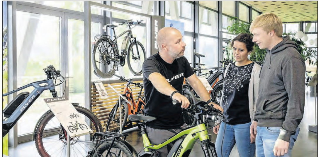
Am besten kauft man Elektroräder im Fachhandel.

Ein Elektrofahrrad ist deutlich schwerer und wiegt selten unter 25 Kilogramm. Neuere Modelle mit größeren Akkus bringen sogar noch mehr auf die Waage. Dank Motorunterstützung spielt das Gewicht des E-Rads beim Fahren selbst zwar keine Rolle, beim Aufsteigen, Schieben, Wenden, Tragen in den Keller oder beim Transport mit Bahn und Auto jedoch sehr wohl.