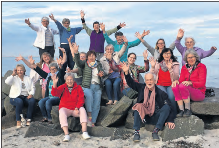
Der Altkrempfer Basilika-Chor lädt zum offenen Singen ein.