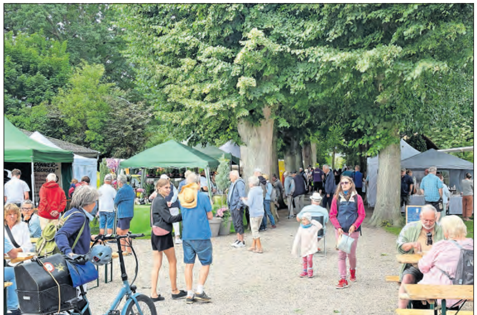
Die vielen Besucherinnen und Besucher konnten schlemmen, stöbern und genießen.