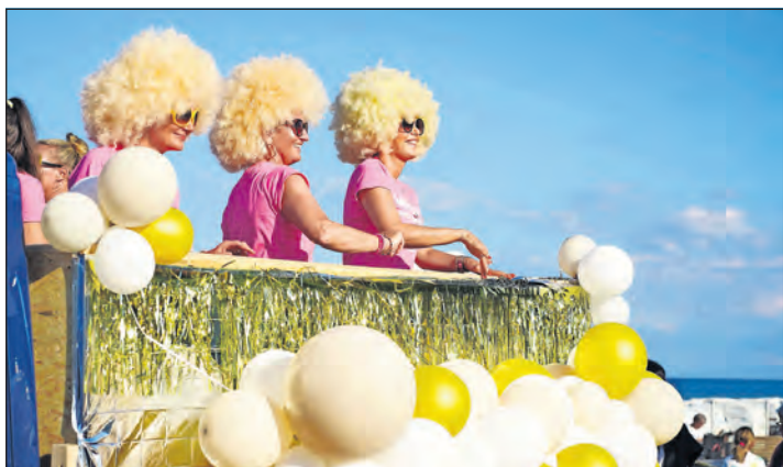
Ladies in Pink.

das richtige Schlagerfeeling sorgen. Gesammelt wird sich ab 17 Uhr auf dem Nebenplatz vom Nystedplatz, um gegen 18 Uhr auf die Reise zu gehen. Der Tourismus-Service fordert Gäste, Einheimische, Vereine und Verbände auf, gern schrill und bunt am Schlager-Umzug teilzunehmen. Der Eintritt ist mit Ostseecard frei. (red)