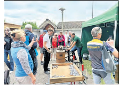
Bei der Alten Gruber Bürgergilde konnte das Kugelgießen live beobachtet werden.