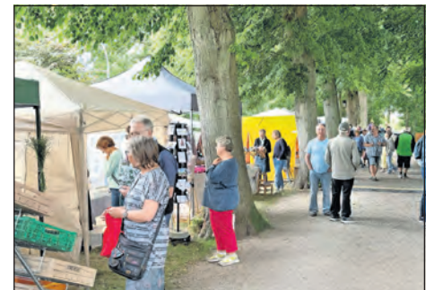
Liebevoll hergerichtete Kunsthandwerkerstände luden mit ihrem Angebot zum Stöbern ein.