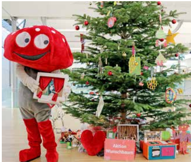
Los-Sparer-Maskottchen Lottie und die Wünsche unterm Weihnachtsbaum.

Kreis Plön. (t) Mehr als 70 Kindergärten, Kitas und ähnliche Einrichtungen haben an der Vorweihnachts-Aktion der Förde Sparkasse teilgenommen. Für 20 von ihnen gehen ihre Weihnachtswünsche im Wert von jeweils bis zu 1.000 Euro in Erfüllung. Eine neue Küche für die Puppenecke, ein stabiles Klettergerüst mit Schaukeln, weiche Turnmatten für den Bewegungsraum – in den Kindergärten, Kitas & Co. gibt es viele kleine und große Wünsche. Gemeinsam mit den Kindern haben die Erzieher*innen diese Wünsche kreativ umgesetzt: Es wurde fleißig gebastelt, gebacken und gemalt. Am Ende wurden über 70 Wünsche als Kreativarbeiten in den Filialen der Förde Sparkasse abgegeben.