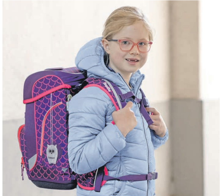
Mit den Blinkis an Ranzen oder Jacke sind Kinder besonders in der dunklen Jahreszeit besser sichtbar.