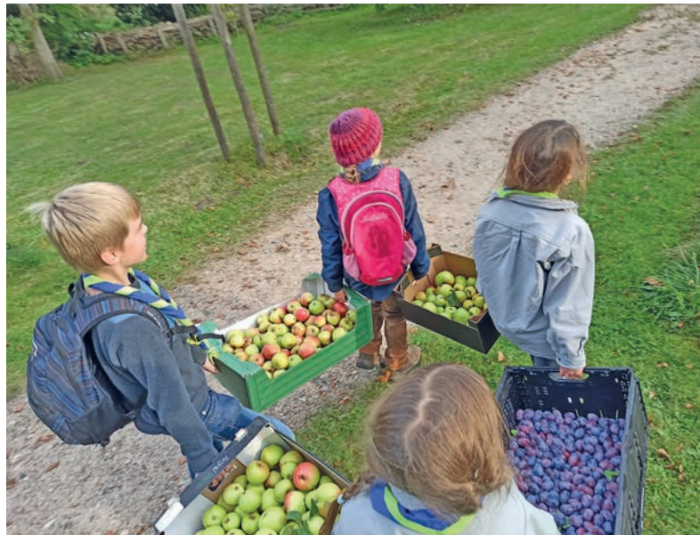
Obsternte der Pfadfinder.

ist es uns nun gelungen, einen beachtlichen Ofen hochzuziehen. Dabei hatten wir vielerlei Hilfe und Unterstützung. Um uns für die Früchte und Gaben der Erde, die täglich unsere Bäuche füllen und für die ganze Unterstützung beim Bau des Ofens zu bedanken, laden die Kirchengemeinde Schönwalde a.B. und wir, der VCP Pfadfinderstamm „Swentana“, am 2.10.2022 um 10 Uhr in die Schönwalder Kirche zum Erntedankfest ein. Im Anschluss an den Gottesdienst möchten wir unseren Ofen angemessen mit euch auf dem Gelände der Pfadfinder einweihen. Neben ein wenig Programm wird es dort ebenfalls Suppe, Flammkuchen aus dem Lehmofen, Marmelade, Kaffee und Kuchen geben. Wir freuen uns bereits darauf, mit vielen von euch ein schönes Erntedankfest zu feiern.