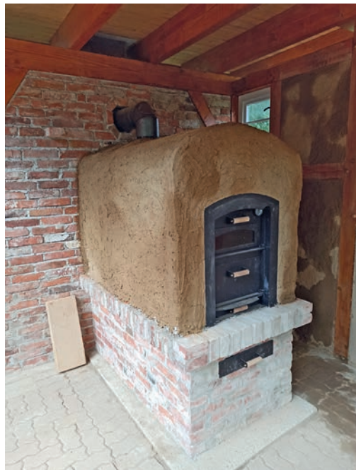
Der neue Lehmbackofen.

Schönwalde. (nw) Wohin man auch zur Zeit blickt, überall ist es zu erkennen, der Herbst ist da. Abends wird es bereits merklich dunkler, die Bäume fangen an ihr Blätterkleid zu färben und in den Gärten werden auch die letzten Früchte reif. Auch wir Pfadfinder haben auf dem Pfarrhof in Schönwalde viele Früchte sammeln können. Diese haben wir in den letzten Wochen fleißig eingekocht und zu leckeren Marmeladen verarbeitet. Parallel dazu ist auch in den vergangenen Monaten unser Lehmbackofen gereift. Durch liebevolle Handarbeit