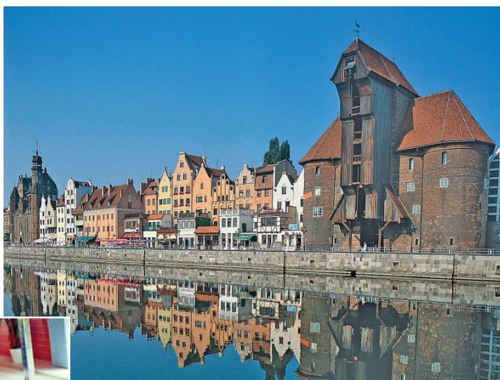
Ein großer Panorama-Ausflug in die alte Hansestadt Danzig ist der Höhepunkt der großen Kurier-Kur-Reise an die Bernsteinküste.

OLDENBURG / LENSNAH (t) Herrliche Entspannung und allerbeste Erholung verspricht die herbstliche Sonder-Reise der Kurier-Leser-Reisen vom 1. bis 5. November 2022 zum absoluten Sonderpreis von nur 249,90 Euro an die berühmte Pommersche Bernsteinküste, wo unsere Leser im bestens bewerteten Top-Kur-Hotel in der Nähe von Kolberg, in direkter Nähe zum Meer, mit den endlosen schnee-weißen Sandstränden residieren werden. Das Wellness- und Kur-