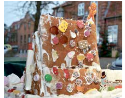
Eine besondere Ausstellung: Bis zum Abholtag am 23. Dezember werden die kreativen Backwerke bei Kiek mol! Optik am Rathaus im Schaufenster präsentiert.

Geöffnet ist montags, dienstags, donnerstags und freitags von