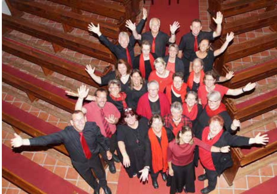
Die Giekauer Gospel JOYces wollen mit ihrem Konzert musikalische Weihnachtsfreude überbringen

Nach zwei Jahren Corona-Pause, in der der Chor zu Weihnachten nur online und auf CD zu hören war, freuen sich die etwa 25 Sängerinnen und Sänger, in diesem Jahr endlich wieder vor Publikum singen zu können. Und damit diese Freude auch direkt aufs Publikum überspringt, hat