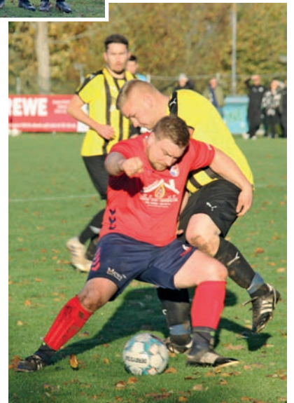
Fußball, Wentorf im Derby gegen FC Kaköhl