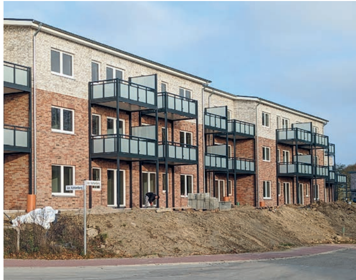
Mehrfamilienhaus ehemalige Kaserne kurz vor Fertigstellung, Am Kahlenberg

Bürgermeister Dirk Sohn berichtete über den Bau von Eigentums- und Mietwohnungen, Einfamilienhäusern sowie Genossenschaftswohnungen auf dem alten Kasernengelände, wo z.Zt. insgesamt ca. 250 Wohnungen entstehen. Auch kam die Entwicklung des Grundstückes Eetzweg 20 – ehem. Zahnfabrik- zur Sprache, wofür z. Zeit der B Plan erstellt wird, um die Fläche für Wohnbebauung zu ermöglichen und weiter zu entwickeln. Ähnliches gilt für das ehemalige Altenheim, Gieschenhagen 2. Nach Auszug der Flüchtlinge wird der Investor das Haus abreißen und plant dort einen Neubau in gleicher Größe für Wohngemeinschaften, betreutes Wohnen und Tagespflege, wenn die Aufstellung des B Planes mit Beteiligungsmöglichkeiten erfolgt ist. In der Panker Straße, der Plöner Straße sowie