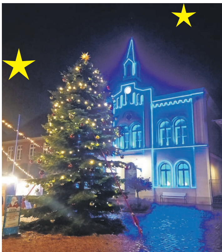
Stimmungsvolles Ambiente auf dem Oldenburger Marktplatz

fügt noch 100 Milliliter trockenen Weißwein hinzu und lässt alles noch einmal kurz einköcheln. Zur Verfeinerung 200 Milliliter Schlagsahne aufschlagen und unter die Suppe rühren. Nun noch 100 Gramm gewürfelten Speck – oder als vegetarische Alternative klein geschnittenen Räucher tofu – in einer Pfanne knusprig braten. Die Suppe auf vier Tellern verteilen. Knusprige Speck- oder Tofuwürfel über die Suppe streuen und mit Sahnehäubchen, Chiliflocken und Spekulatiusbrösel dekorieren. Tipp: Die restliche selbstgemachte Spekulatiuscreme eignet sich als leckerer winterlicher Brotaufstrich. Wer mag, kann die übrige Creme auch in einem Einmachglas verpackt verschenken. Hierzu noch ein paar zerbröselte Spekulatiusstücke und gemahlene Chiliflocken als Topping über die Creme streuen und das geschlossene Glas mit einer hübschen Schleife verzieren. Luftdicht verpackt, hält sich die Spekulatiuscreme im Kühlschrank rund sechs Wochen.