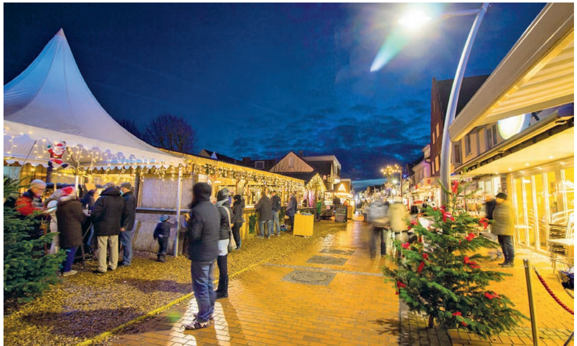
Der „Büsumer Winterzauber“ ist ein traumhafter Wintermarkt mit vielen regionalen Spezialitäten aus Dithmarschen.

Oldenburg/Lensahn. (t) Grenzenlos schlemmen und genießen können unsere Leser beim 1. Kurier-Winter-Fest am Samstag, den 7. Januar 2023, das sich ideal auch als attraktive Weihnachts-Geschenk-Idee eignet, und erstmals zum ganz besonders günstigen Komplettpreis von nur 49,90 € offeriert wird. Zunächst führt uns der Kurs im erstklassigen Fernreisebus direkt ab Oldenburg und Lensahn zum so beliebten Fährhaus an der Eider zum sehr großzügigen Winter-Schlemmer-Buffer mit Spezialitäten aus Schleswig-Holstein und Grünkohl mit allen Beilagen sowie knusprig-leckeren Dithmarscher Spanferkel, frisch aus dem Rohr, mit vielen knackig-frischen Gemüsebeilagen aus der Eider-