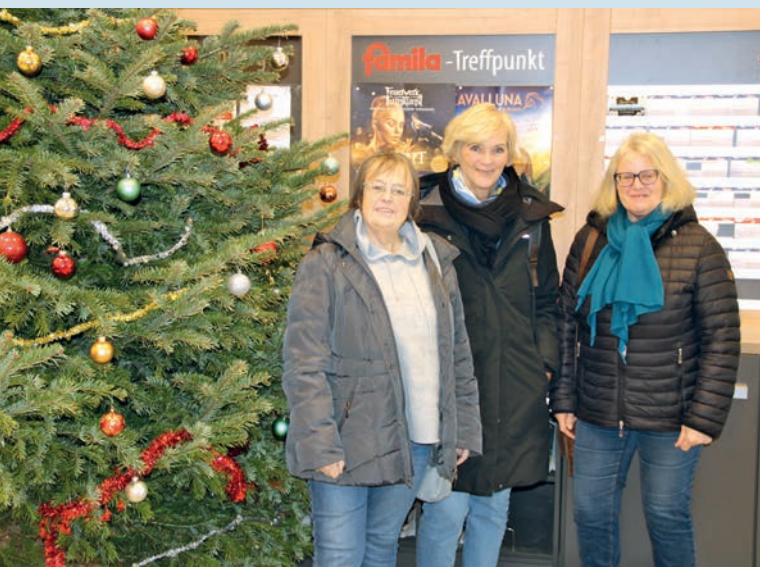
Freude auf die Weihnachts-Ausgabe am 22. Dezember.

Überra- e. Damit leich viel ohn kürz- ön richtet hren Ein- thofstra- enburger in bege- eldbetrag