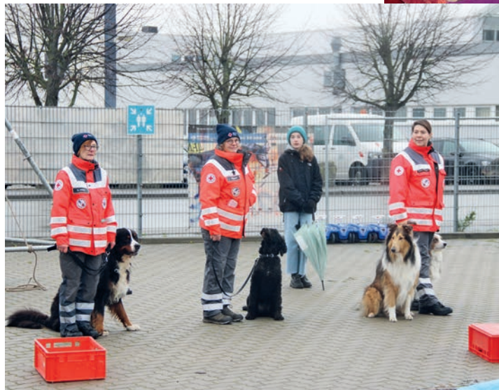
Die Hundestaffel bereitet sich auf ihre Vorführung vor.

ebenfalls die Hundestaffel, die natürlich auch in Aktion zu sehen war.