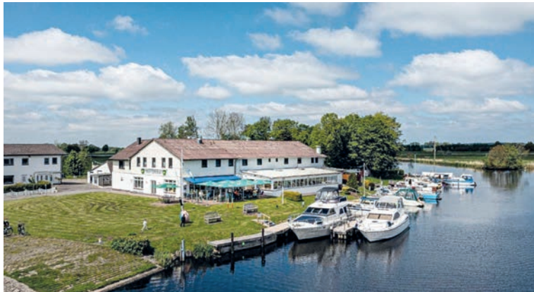
Im berühmten Fährhaus an der Eider erwartet unsere Leser das große Winter-Schlemmer-Buffer mit vielen regionalen Spezialitäten.

Region, vielfältigen Kartoffel-Variationen, Dips und Saucen sowie großem und marktfrischen Salat-Buffer und zum Finale ein reichhaltiges leckeres Eis- und Dessert-Buffer. Gut gestärkt geht der Erlebnis-Törn weiter ins mondäne Seebad Büsum, wo unsere Leser