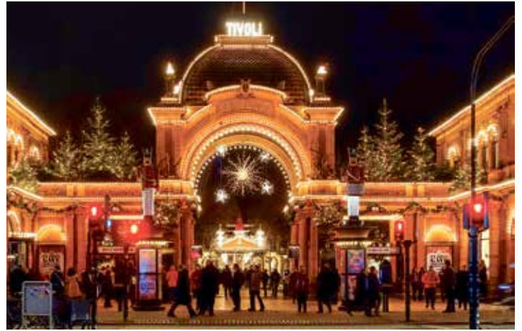
Im weihnachtlichen Festtags-Kleid erwartet der Tivoli in Kopenhagen unsere Leser zum Weihnachtsmarkt-Besuch.

Lensahn / Oldenburg. (t) Skandinaviens schönste Hauptstadt erwartet unsere Leser zum Schnupperpreis von 49,95 Euro im festlich-illuminierten Weihnachts-Kleid am malerischen Öresund. Mit dem Reporter-Bus geht es direkt ab Lensahn, Oldenburg und Heiligenhafen Kurs Nord mit den Grossfähren der Vogelfluglinie, mit nur 45 minütiger Überfahrt direkt nach Rødby in Dänemark. So dann geht es zügig weiter mit einer nur zweistündigen Anfahrt nach Kopenhagen zum ganz besonders attraktiven skandinavischen Weihnachts-Shopping-Bummel während der vierstündigen Freizeit. Außerdem besteht Gelegenheit zum Besuch des weltberühmten Tivoli-Weihnachtsmarktes im einmaligen Lichterglanz (Foto) im Herzen der Stadt – Skandinaviens größter und schönster Weihnachtsmarkt. Folgende Termine sind für unsere Leser ab sofort buchbar: 19.11.2022 (Verkaufsoffener Samstag vor dem Fest), 26.11. (1. Advent),