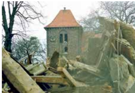
Abriss Hotel Lensahn – nur die Frontmauer bleibt erhalten (1991)