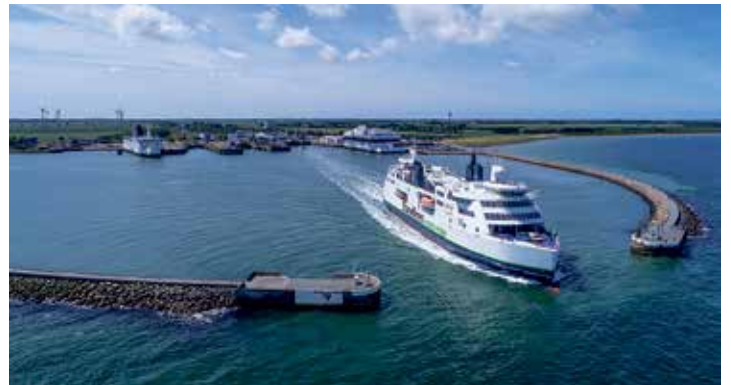
Kurs Nord mit Scandlines: In nur 45 Minuten erfolgt die Überfahrt auf der Vogelfluglinie nach Dänemark hin und zurück.

10.12. (3. Advent), 17.12. (4. Advent) und Sondertermin 29.12.2022 direkt in den Weihnachtsferien. Die Rückkehr in die Heimatorte erfolgt ca. 19.00 bis 20.00 Uhr. Anmeldungen sind ab sofort möglich bei den Reporter-Leser-Reisen des Burg-Verlages in Eutin, täglich 9 bis 13 Uhr, per Telefon 04521/701130 oder direkt per Mail unter „leserreisen@der-reporter.info“.