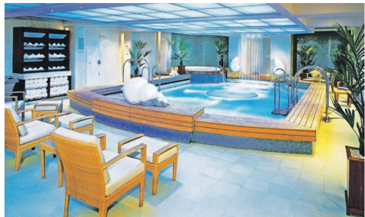
Ein grossartiges Wellness- & Fitness-Center mit Pools erwartet unsere Leser an Bord.

mer-Schnupper-Kreuzfahrt mit einem der größten und berühmtesten Kreuzfahrtschiffe der Welt als traumhafte Bus- & Flug- & Kreuzfahrtschiff-Kombination zum absoluten Schnäppchen-Preis mit der legendären „Queen Mary 2“. Während der 3-tägigen Luxus-Kreuzfahrt von Hamburg nach England erleben unsere Leser mit der „Queen Mary 2“ eines der schönsten Kreuzfahrtschiffe der Welt mit dem legendären „White-Star-Service“ und erlebnisreicher Gourmet-Vollpension an Bord. Deutsche Speisekarten und