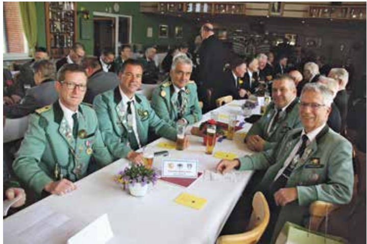
Die Vertreter der Neustädter Gilde

Die Gilden mit ihren Ältermännern aus Grube, Petersdorf, Eutin, Heiligenhafen, Harmsdorf, Lensahn, Neustadt, Groß- enbrode, Preetz, Landkirchen,