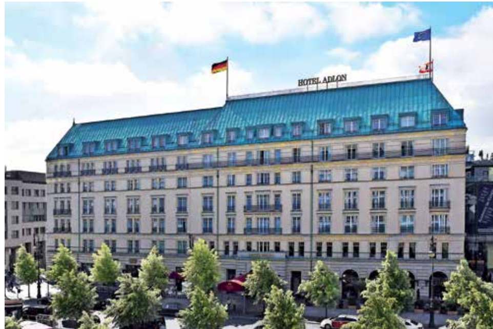
Das „berühmteste Hotel der Welt“ am Pariser Platz in Berlin können die Kurier-Leser im August 2023 ausführlich genießen.

Als kulturellen Höhepunkt der dreitägigen Sonder-Reise zum Top-Termin vom 15. bis 17. August 2023 zum sehr günstigen Komplettpreis von nur 475,00 Euro genießen unsere Leser eines der erfolgreichsten Kabarett-Europas mit den „Stachelschweinen“ mit größtem Vergnügen mit dem grandiosen