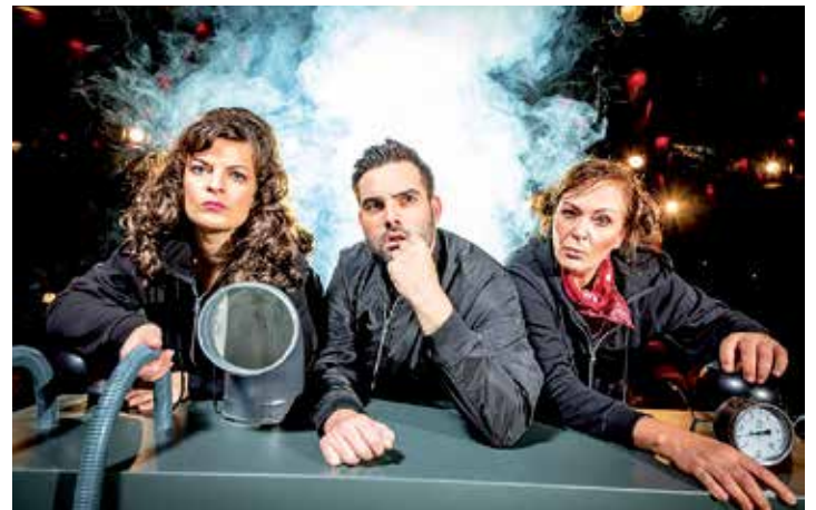
Gnadenloses Erfolgs-Kabarett erleben unsere Leser mit großem Vergnügen bei den berühmten „Stachelschweinen“ in Berlin.

Anmeldungen sind ab sofort möglich bei den Kurier-Leser-Reisen des Burg-Verlages in Eutin, täglich von 9 bis 13 Uhr, per Telefon 04521/7011-30 oder direkt über Mail unter „leserreisen@der-reporter.info“.