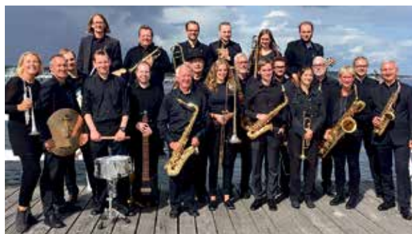
Die Big Band der Universität zu Kiel

Oldenburg. (cb) Die Big Band der Universität zu Kiel spielt ein „Dankeschön Konzert“ am 18. Mai 2023 im Stadttheater Oldenburg in Holstein. Die Big Band der Universität zu Kiel ist der Einladung des Seniorenbeirates der Stadt Oldenburg in Holstein gefolgt und gibt als „Dankeschön“ für die Seniorinnen und Senioren ein Konzert im Stadttheater (Aula des Freiherr-vom-Stein-Gymnasiums). Das „Dankeschön Konzert“ findet am Donnerstag, den 18. Mai, Christi Himmelfahrt, um 15 Uhr statt. Der Einlass ist ab 14:30 Uhr geöffnet. Der Eintritt ist frei. Die Big Band der Christian-Albrechts-Universität zu Kiel besteht aus 35 Mitgliedern aller Berufsgruppen. Ihr Repertoire umfasst von Swingklassikern und Jazzstandards bis zu modernen Hits alles was sich das musikalische Herz wünscht.