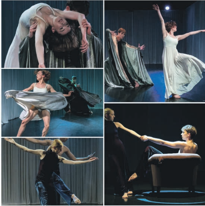
copyright MOHA Gesellschaft für Bewegungskunst – Siklós Pito

rist-Info Eutin 04521-709 70, www.luebeck-ticket.de zzgl. Vorverkaufsgebühr, Abendkasse