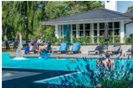
Traumhafte Hotel-Anlage mit großem Pool direkt am Meer

Oldenburg / Lensahn. (t) Die weltberühmte Felsen-Insel in der Ostsee mit malerischen Fischereihäfen, traumhaften Sandstränden und den weltberühmten Rundkirchen erwartet die Reporter-Leser im farbenfrohen „Goldenen September“ im Jahr 2023 zu Top-Ter-