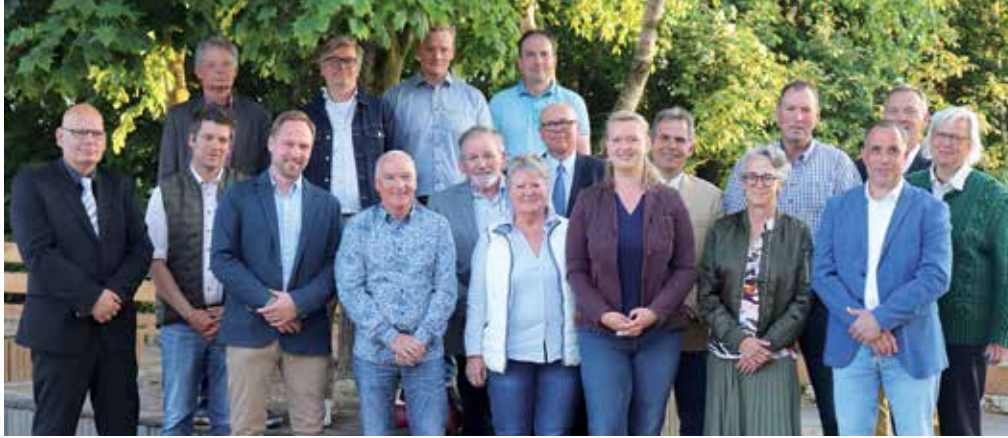
Alle neuen Gemeindevertreter und die wählbaren Bürger.

Am 05.06.2023 hat die Gemeinde auf der konstituierenden Sitzung die Weichen für die kommenden fünf Jahre Kommunalpolitik gestellt. Den Wahlergebnissen vom 14.05.2023 folgend, wurden 9 Sitze der Gemeindevertretung von der Bürgergemeinschaft