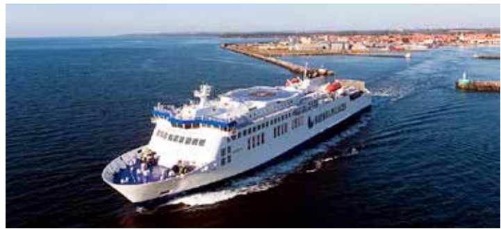
Schnell und direkt: Mit den neuen Großfähren reisen die Reporter-Leser via Rügen nach Bornholm und zurück.

Zum großen Leistungspaket der Sonder-Reisen gehören neben der Fahrt im erstklassigen Fernreisebus ab Oldenburg und Lensahn die „Ostsee-Kreuz-