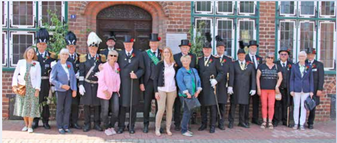
Die Abordnung der St. Johannis Toten- und Schützengilde mit Ihren Gildeschwestern

Oldenburg. (sg/mc) Gegenseitige Besuche zwischen der Oldenburger St. Johannis Toten- und Schützengilde und der Bürger-Schützen-Gilde Wilster haben schon eine gewisse Tradition. Durch persönliche Freundschaften einiger Gildebrüder entstanden, gab es schon in der Vergangenheit gelegentliche Besuche. Am ersten Juniwochenende machte sich nun eine Abordnung der Oldenburger St. Johannis Toten- und Schützengilde auf den Weg zu den Freunden im Kreis Steinburg, um mit den dortigen Gildebrüdern und -schwestern deren jährliches Gildefest zu feiern. Den Ostholsteinern wurde am Samstag ein überaus herzlicher Empfang zu teil. Während des Gildeballs konnten sie sich dann ein Bild von der Traditionspflege ihrer Gastgeber machen. So berief der 1. Gildeschreiber der Wilsteraner während des Balls die Gildebrüder der Bürger-Schützen-Gilde in die neuen Ämter. Zudem fanden die Ehrungen der Sport-Schützen in den verschiedenen Klassen statt. Das Sonntagsprogramm begann mit einem plattdeutschen Gottesdienst in der prunkvollen St. Bartholomäus Kirche zu Wilster. Es folgte eine Führung durch das spätbarocke Gotteshaus. Den Rest des Tages nahmen die Oldenburger an den traditionellen Abläufen der befreundeten