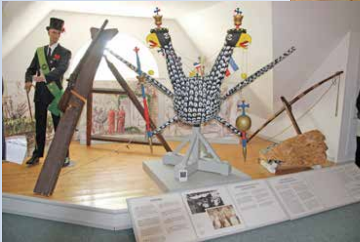
Als Exponat zu sehen, der Oldenburger Gildevogel