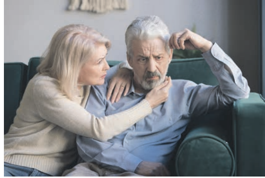
Frauen werden weniger als Männer von einer ‚Midlife-Crisis‘ erfasst, da sie sich in ihrem sozialen Umfeld mehr über ihr Seelen- und Gefühlsleben austauschen und sich dabei Rat holen.