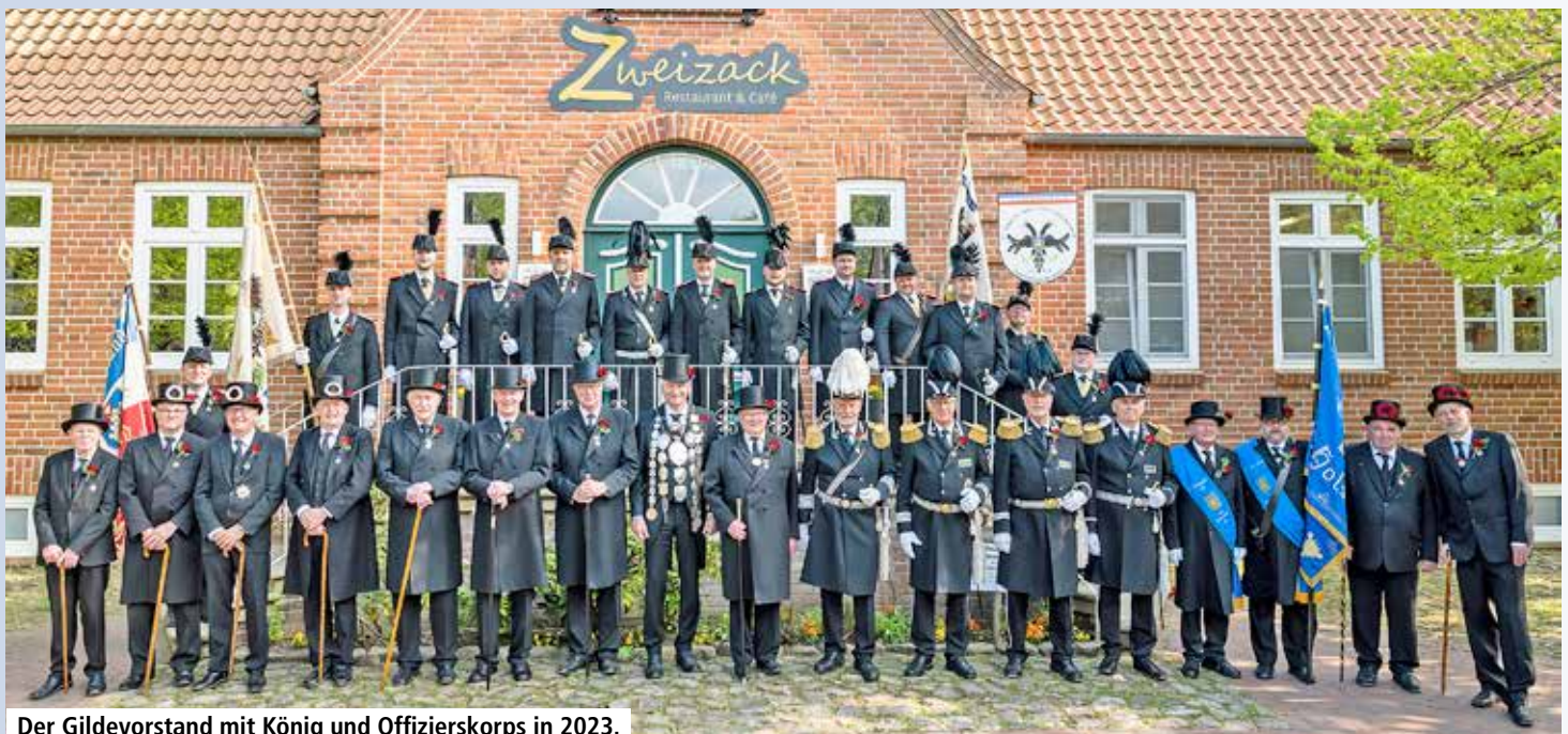
Der Gildevorstand mit König und Offizierskorps in 2023.