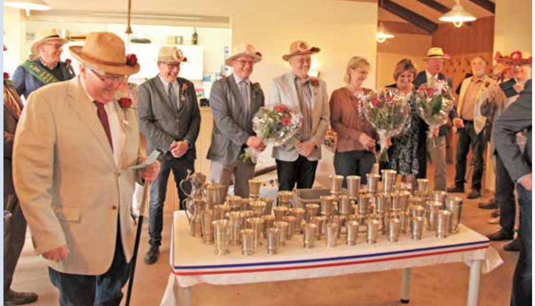
Die Bierschaffer mit ihren Frauen nach der „Becher -Abnahme“.