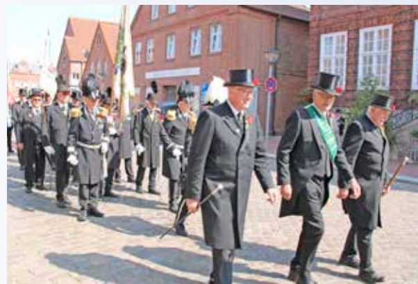
Gildebrüder der St. Johannis Toten- und Schützengilde im Festumzug der Bürger-Schützen-Gilde Wilster