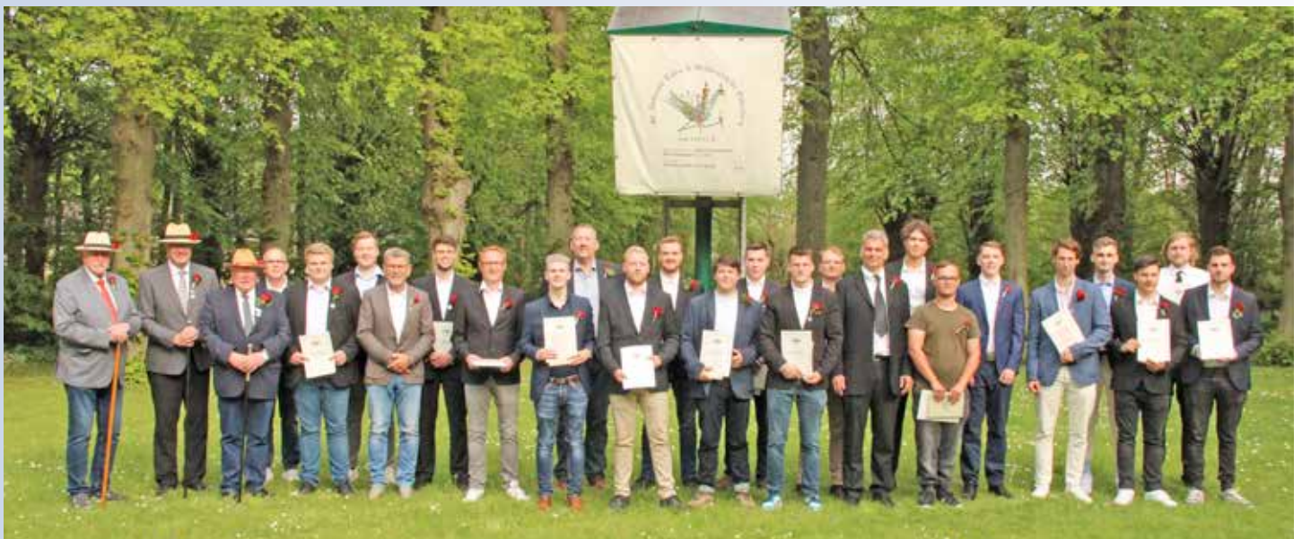
Die neuen Gildebrüder 2023