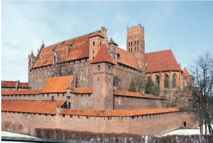
Die Marienburg des deutschen Ordens in Maribor bei Danzig.