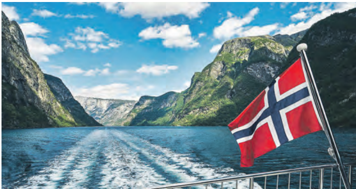
Die Schifffahrt auf dem weltberühmten Geirangerfjord ist für unsere Leser:innen einer der Höhepunkte der großen Fjord-Rundreise.

Bereits als Auftakt genießen unsere Gäste die große Norwegen-Küsten-Kreuzfahrt auf völlig neuer Route mit den eleganten Jumbofähren der Fjord-Line ab Dänemark direkt in die Hansestadt Bergen, auf dem Rückweg