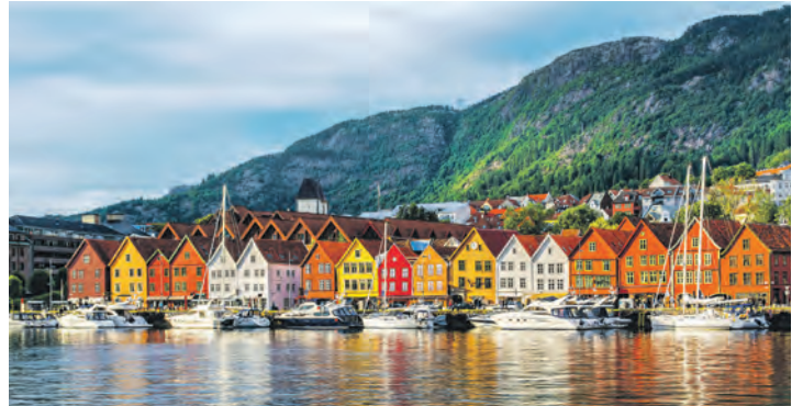
Bei einer großen Stadtrundfahrt mit Reiseleitung entdecken unsere Leser:innen die alte Hansestadt Bergen.