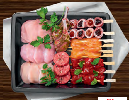
Raclette-Tapas-Platte anteilmäßig gemischt für 4-5 Personen, ca. 1000 g