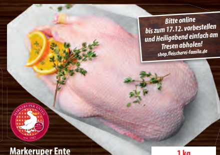
Markeruper Ente ca. 1,7-3 kg so muss eine Ente schmecken aus natürlicher Aufzucht