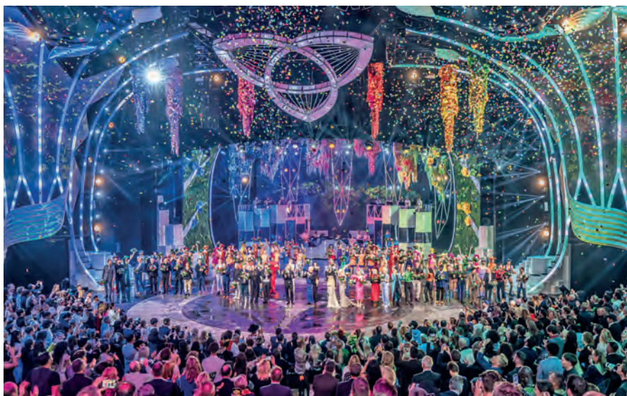
Weltklasse-Show like Las Vegas: Die Weltpremiere „Blended by Delight“ begeistert das Publikum in Berlin.

Als kulturellen Höhepunkt der dreitägigen Sonder-Reise zum Termin vom 20. bis 22.03.2026 zum sehr günstigen Komplett-Preis von nur 475,00 Euro genießen unsere Leser:innen inklusive Eintritt ohne Warteschlangen und inklusive Hin- und Rück-Transfer das weltberühmte