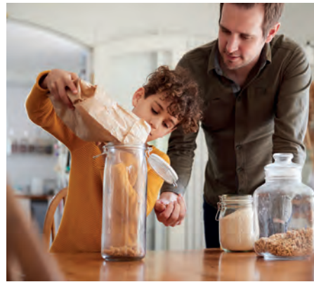
Getrennte Aufbewahrung von allergenen und ungefährlichen Lebensmitteln erleichtert die Handhabung zuhause.

Lebensmittelallergie, die schon im Kleinkindalter auftreten kann. Bei einer Lebensmittelallergie reagiert der Körper mit einer überschießenden Abwehrreaktion auf normalerweise ungefährliche Stoffe. Die Erdnussallergie ist eine sogenannte Typ-I-Allergie. Voraussetzung dafür ist ein Erstkontakt mit dem Allergen, der in der Regel symptomlos verläuft und auch als Sensibilisierung bezeichnet wird. Erst beim zweiten Kontakt kommt es dann zu Symptomen. Schon kleinste Mengen einer Erdnuss können ausreichen, um innerhalb von Sekunden oder Minuten lebensbedrohliche Symptome wie Atemnot, Blutdruckabfall bis hin zum Kreislaufschock