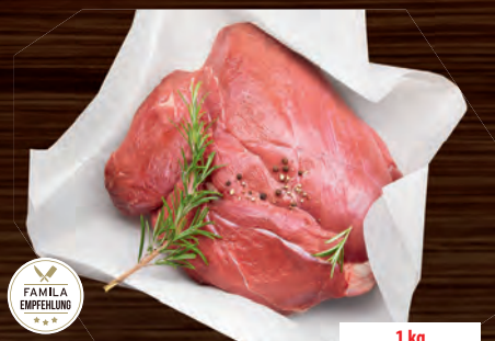
Rehkeule gefr. die Königin des guten Geschmacks aus Norddeutschland