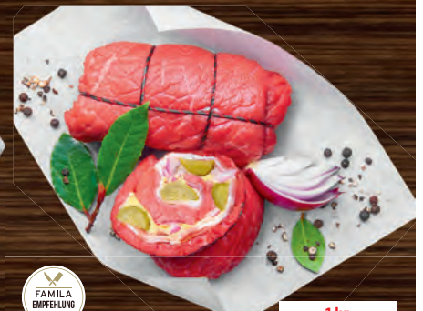
Deli. Rinderrouladen lecker gefüllt und gebunden