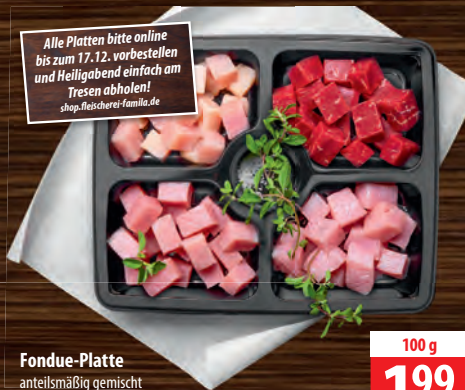
Fondue-Platte anteilmäßig gemischt für 4-5 Personen, ca. 1000 g

Alle Platten bitte online bis zum 17.12. vorbestellen und Heiligabend einfach am Tresen abholen! shop.fleischerei-famila.de