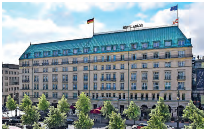
Das „berühmteste Hotel der Welt“ am Pariser Platz in Berlin können die Leser:innen im März 2026 ausführlich genießen.

Preislagen zur Verfügung. Zum großen Leistungspaket der Leser-Reise gehören neben der Busfahrt im erstklassigen Fernreisebus direkt ab Oldenburg, Lütjenburg und Lensahn zwei Übernachtungen mit Gourmet-Frühstücksbuffet im Hotel Adlon, eine große Stadtrundfahrt mit fachkundiger Reiseleitung sowie die Eintrittskarte ohne Warteschlangen in das Barberini-Mu-