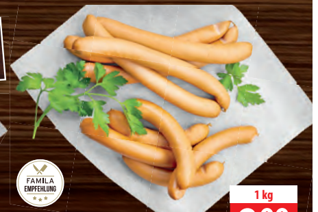
Wiener Würstchen groß und klein, knackig im Biss