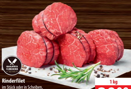
Rinderfilet im Stück oder in Scheiben, zum besten Preis vor Weihnachten gefr./angetaut, Steakhouse-Ware