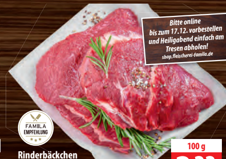
Rinderbäckchen lecker zum Schmoren einfach zuzubereiten, saftig und zart