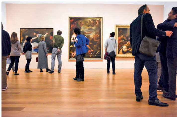
Das derzeit berühmteste Kunst-Museum Europas erwartet unsere Leser:innen in Potsdam mit dem Barberini-Museum mit der sensationellen neuen Max-Liebermann-Ausstellung.

seum inklusive Hin- und Rück-Transfer sowie viel Freizeit zum Stadt- und Shopping-Bummel auf Grund der einmaligen Lage des Hotels im Herzen Berlins. Anmeldungen sind ab sofort möglich bei den Reporter-Leser-Reisen des Burg-Verlages in Eutin, täglich von 9 bis 13 Uhr, per Telefon 04521/7011-30 oder direkt im Internet online unter „leserreisen.der-reporter.info“.