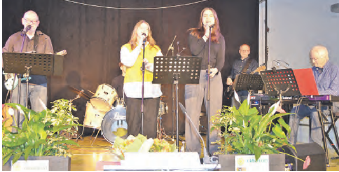
Die Lehrerband Raum 26 sorgte für beste Unterhaltung.

Aber es gab auch viele kleinere Dinge, welche das Leben in Lütjenburg so liebens- und lebenswert machen: ein großes Stück voran- kommen ist das Projekt Schienenbus, dieser steht jetzt am alten Bahnhof und wird hoffent- lich schon bald die ersten Fahrten aufnehmen. Es gab einen Schulleiterwechsel an der Grund- schule, die Stadt wurde fahrradfreundlicher