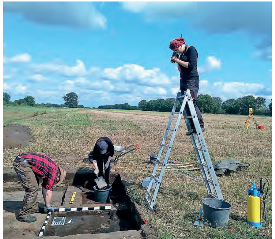
Dokumentation der Grabungsergebnisse von Nostorf.

Sein Forschungsschwerpunkt liegt seit seiner Studienzeit vor allem auf den Metallzeiten. Seit seiner Tätigkeit in Mecklenburg-Vorpommern forscht er verstärkt zur Zeit der Slawen und seit mehreren Jahren am Fundplatz in Nostorf bei Boizenburg an der Elbe.