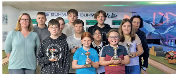
Das Bild zeigt die Sieger und Platzierten der Jugend Vereinsmeisterschaft.

Oldenburg in Holstein (tg). Das Jahr ist erst ein paar Wochen alt, aber für die Oldenburger Kegler/innen stehen schon viele sportliche Termine an. Nach zwei schon sehr erfolgreichen Kreismeisterschaftsdurchgängen findet für die Jugendabteilung, der abschließende 3. Durchgang, auf der Heimbahn in Oldenburg statt. Die im Dezember ermittelten Vereinsmeister und Platzierten werden dann versuchen den Grundstein für die höheren Meisterschaften zu legen und so viele Pokale wie möglich in Oldenburg behalten zu können. Gerne würden sich die Kinder am 08.02.2026 über Unterstützung freuen. Die Meisterschaft beginnt um 10 Uhr, die ersten Oldenburger greifen ab 12.30 Uhr ins Geschehen ein. Die Siegerehrung wird um 15.15 Uhr erwartet. Im Erwachsenenbereich gab es für die Herrenmannschaft in der 1. Bundesliga schon am 2. Januarwochenende einen Auswärtspunkt gegen SG Eberswalde zu feiern. Für zwei weitere