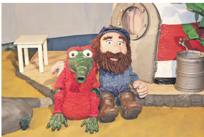
Wer diese beiden kleinen Gestalten kennenlernen möchte, sollte das Kindertheater im Gemeindehaus am Markt in Plön nicht verpassen. Auf dem Programm steht die vielversprechende Geschichte „Es kam aus Übersee“.

Die Karten sind im Vorverkauf online zum selbst ausdrucken über www-theater-zeitgeist.de erhältlich (Einzeltickets kosten 5 Euro, Familientickets zu vier Per-