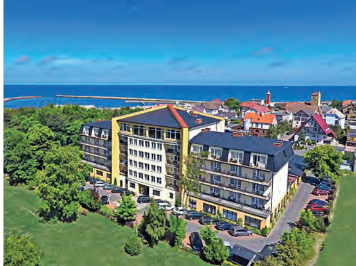
In Top-Lage am Meer befindet sich das exklusive Verwöhn-Hotel „Lidia“ an der Pommerschen Bernsteinküste.

Dampfbad & Außen-Whirlpool sowie einer Flasche Wasser zur Begrüßung auf dem Zimmer, eine große Panorama-Rundfahrt mit Reiseleitung „Auf den Spuren des Bernstein“ mit Abstecher in den bekannten Slowinski-Nationalpark sowie gegen Aufpreis von nur 15,00 Euro eine Ostsee-Küsten-Rundfahrt mit fachkundiger Reiseleitung mit Besuch im weltbekannten Seebad Kolberg