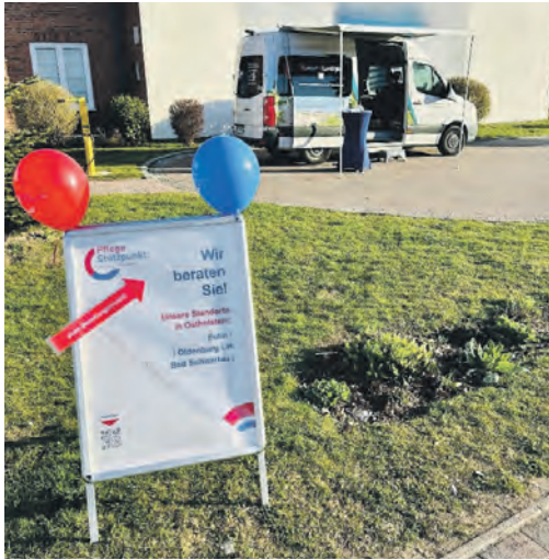
Beratungsmobil im Einsatz.

In Lensahn steht das Beratungsmobil zum ersten Mal am 27.01.2026 auf dem Edeka Jens Parkplatz für Ratsuchende bereit. Der Einsatz in Lensahn ist für zunächst 6 Termine jeden 4. Dienstag im Monat eingeplant. Danach erfolgt eine Evaluation des Standortes, denn nicht überall wird das Angebot gleich stark angenommen. So entfällt die mobile Beratung in Heiligenhafen. „Wir haben die Nachfrage aus den Gemeinden sorgfältig im