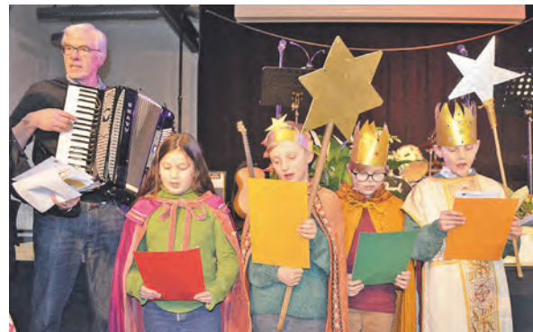
Die Starnsinger segneten auch in diesem Jahr das Haus und alle, die darin ein- und ausgehen.