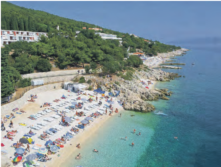
Traumhafte Strände bei warmen Temperaturen erwarten unsere Leser:innen bei der großen Verlags-Sonderfahrt nach Kroatien.

Abendessen ohne Begrenzung im Reisepreis mit enthalten (Weine/Biere/Softdrinks, Wasser). Zum großen Leistungspaket gehören neben der komfortablen Busreise im erstklassigen Fernreisebus mit Waschaum/WC, Bordküche ab Oldenburg, Lensahn und Lütjenburg auf der Hin- und Rückreise jeweils eine komfor-