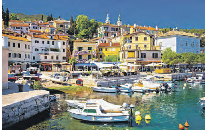
Malerische Städte und mediterranes Klima prägen die azurblaue Urlaubs-Küste in Kroatien in den Herbstferien.

table Zwischenübernachtung in Bayern mit Halbpension sowie 4 Nächte mit Halbpension und abendlichem Getränke-Paket, ein großer Panorama-Ausflug in das weltberühmte mondäne Seebad Opatija mit seiner einmaligen Gründerzeit-Architektur und herrlichen Stränden. Gegen Aufpreis von 25,00 Euro ist zudem ein großer, ganztägiger Erlebnisausflug „Küsten-Rundfahrt“ mit fachkundiger Reiseleitung mit den einmaligen historischen Küstenperlen Rovinj, Porec und Pula und den schönsten Küstenformationen Kroatiens zusätzlich buchbar. Die Kurtaxe ist im Reisepreis bereits enthalten. Anmeldungen sind ab sofort möglich bei den Leser-Reisen des Burg-Verlages in Eutin, Telefon 04521/7011-30, täglich von 9 bis 13 Uhr oder online direkt im Internet unter „leserreisen.derreporter.info“.