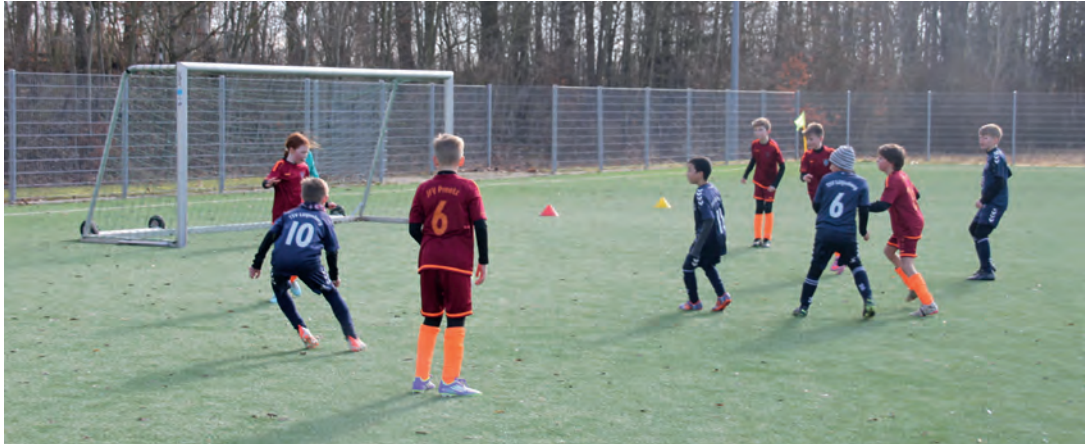
Die roten Preetzer konnten das Spiel der E-Jugend in Lütjenburg mit einem 4:3 für sich entscheiden.

Lütjenburg (rr). Die Lütjenburger E-Jugend, die Neun- und Zehnjährigen, trafen in einem Nachholspiel auf dem Kunstrasenplatz in der Kieler Straße nun auf JFV Preetz. Die Jugendfußball Abteilungen von vier Vereinen, FT Preetz, Preetzer TSV, Schellhomer Gilde und die SG Kühren, haben sich zusammengefunden, um den Fußball der jungen Spieler auf neue Beine zu stellen. Das gilt natürlich auch für den TSV Lütjenburg. Es wurde zwei Mal 25 Minuten bei bestem Wetter am Vormittag miteinander gefightet. Jeweils sechs Spieler und der Torwart. Da sind auch Eltern und Großeltern als Zuschauer gerne dabei. Die sportliche Entwicklung der Kinder ist nun einmal bedeutungsvoll. Es gab einige tolle Ballaktionen, die deutlich machen, dass Spaß und Freude am Fußball zu spüren ist und das natürlich Tore fallen müssen. Die Fußballer spielen ohne Schiedsrichter, denn die Trainer und Betreuer greifen, wenn es