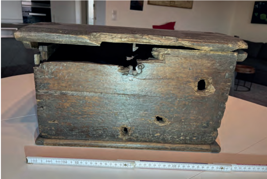
Rätsel geben die Schusslöcher der Lade auf.

Zeitung (Vorläufer der KN) berichtet von der Wiederentdeckung des lange verschollenen handschriftlichen Stammbuchs der Gilde. Es lag verborgen in