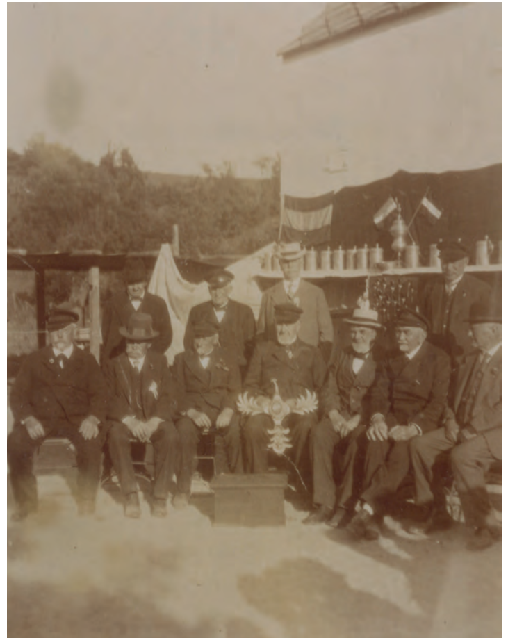
Gildefeier 1930: Das Foto zeigt die Gildelade und „Hans utn Schossteen“ mit dem Gildevogel.

Was genau damals geschah, bleibt offen, da es keinerlei Informationen oder tradierte Erzählungen gibt. Wurde vor, während oder nach der Zeit des Zweiten Weltkriegs versucht, die Lade gewaltsam mit Hilfe von Schusswaffen zu öffnen?