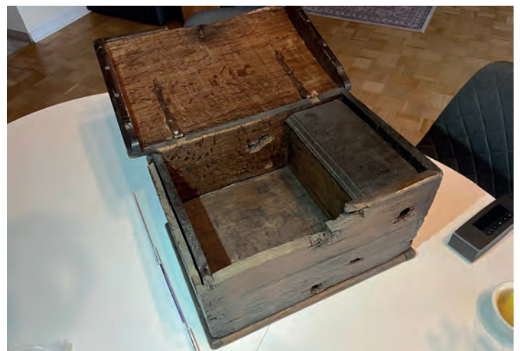
Die Gildelade stammt aus dem 17. Jahrhundert.

War sie Ziel eines Einbruchs, einer Drohgebärde oder bloßer Zerstörung? Und befanden sich zu diesem Zeitpunkt noch wichtige Dokumente in ihr?