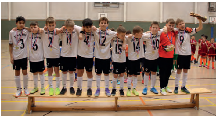
Der TSV Selent

tei. Die Pokale warteten auf die Finalteilnehmer. Da konnte TSV Selent gegen den Raisdorfer TSV über ein 3:2 jubeln, der größere Pokal war gewonnen. Die Selenter zeigten viel kreativen Fußball, und waren mit einem 3:0, 2:0, 1:0, 2:0 und 2:0 schon in der Vorrunde der Favorit. Alle hatten Spaß an den Begegnungen. „Das war nicht ergebnisbezogen, und alle spielten einen überraschend guten Fußball“, so die die Turnierleitung beim Start in die beiden Hallenfußballtage.