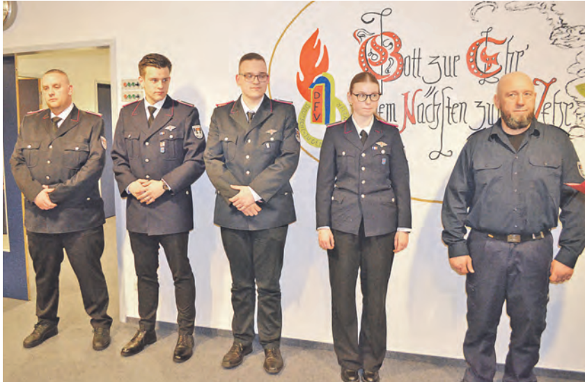
Fünf der sieben beförderten Kameradinnen und Kameraden waren anwesend.

So war der Einstieg der Lf7/8 aus dem Baujahr 1997 nicht mehr lieferbar und es gab den Vorschlag, sich an den Oldtimerhandel im Mercedes Museum zu wenden, glücklicherweise wurde man dann im Internet fündig. Der Oldtimer LF 8 hat mittlerweile das stolze Alter von 67 Jahren erreicht (Baujahr 1959) und ist Mitglied der Ehrenabteilung, welche Wehr hat schon ein eigenes Fahrzeug in der Ehrenabteilung! Positiv wusste