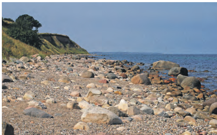
Treffen der Geschiebesammler

Öffnungszeiten: Mo.-Do. von 8-17 Uhr und Fr. 8-12 Uhr