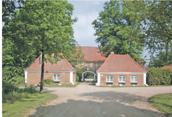
Torhaus von Gut Schmoel aus dem Jahr 1699

Der Gutshof empfängt die Teilnehmer mit seinem Torhaus aus dem Jahr 1699, das von Detlev Reventlow und seiner Frau Dorothea erbaut wurde. Auf dem Hof selbst sind die Hafer-scheune aus dem Jahr 1706 und die Weizenscheune aus dem Jahr 1697 mit ihren neuen Reetdächern zu bewundern. Vom Gutshof aus geht es mit Blick auf die Ostsee durch die Gutsfelder zum Schmoeler Biotop. Dieses wird umrundet, der Grenzgraben zur Probstei überquert und nach kurzer Zeit wird der Ort Stakendorf erreicht. In den Dörfern Bendfeld und Stakendorf ist die ursprüngliche Rundlingsanlage sehr gut zu erkennen. In Stakendorf selbst sind etliche Bauwerke von Hermann Göttsch zu bewundern. Nach weiteren vier Kilometern steht am Ortseingang von Schönberg mit der „Villa Dietrich“ der wohl prachtvollste Bau von Hermann Göttsch.