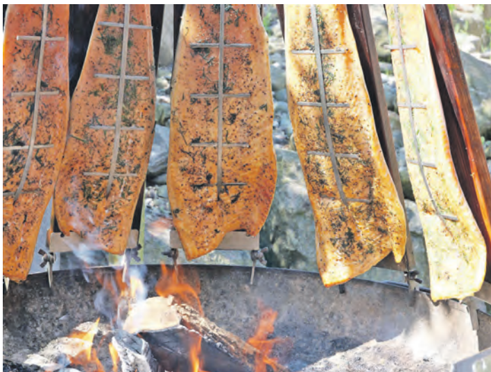
Leckeren Feuerlachs gibt es beim Museumsfest.

Kommen Sie ins Eiszeitmuseum um die Begeisterung für Fossilien und Geschiebe miteinander zu teilen. In entspannter Atmosphäre