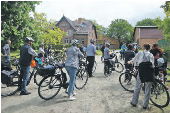
Hof Wiese in Krumbek.

Die ca. 25 km lange Tour kann von allen bewältigt werden. Selbstverständlich gibt es keine Einwände gegen die Benutzung eines Elektrofahrrads. Trinkbares und Verpflegung sollten mitgeführt werden, da keine Einkehrmöglichkeit besteht. Den Regenschutz bitte nicht vergessen, denn gefahren wird nicht nur bei gutem Wetter. Die Teilnahme kostet pro Person 4,00 €. Da die Teilnehmerzahl begrenzt ist, bitten wir um Anmeldung unter 04344 3174 oder über die E-Mail-Adresse info@probstei-museum.de . Die Teilnahme an der Radtour erfolgt auf eigenes Risiko. Die nächste Radwanderung führt am 12.05.2026 nach Probsteierhagen.