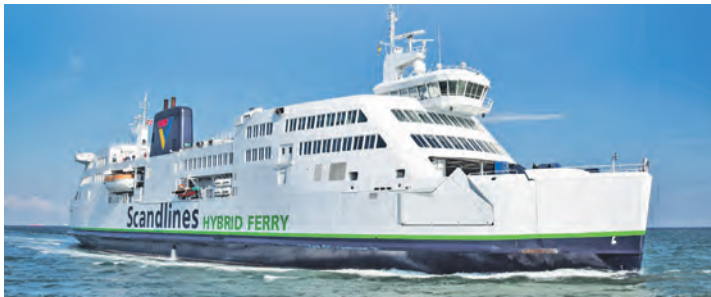
Kurs Nord mit den modernen Großfähren der Scandlines auf der Vogelfluglinie.