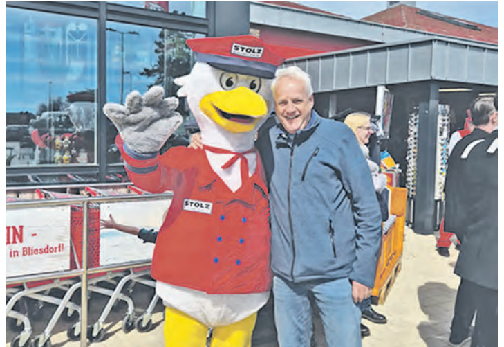
Sogar aus Lübeck waren Gäste zur Eröffnung angereist, wie dieser Herr, der sichtlich gute Laune hatte.