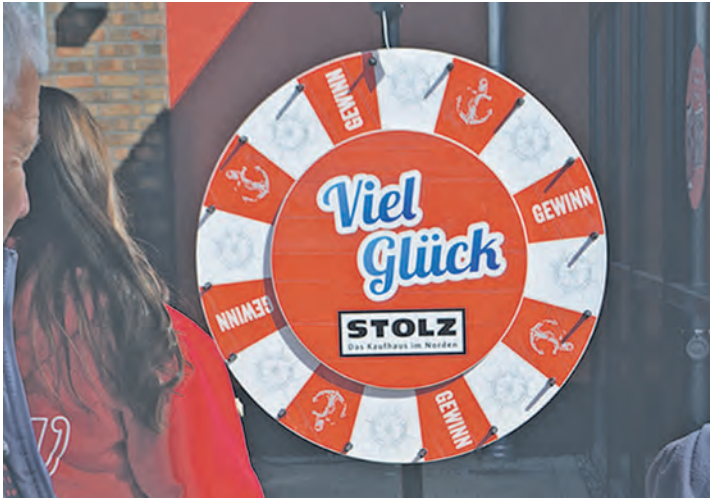
Das Glücksrad erfreute sich großer Beliebtheit, es gab Sachgewinne aber auch Einkaufsgutscheine.

Wer an diesem Tag kam, musste Geduld und Glück bei der Parkplatzsuche mitbringen (obwohl mit 100 Plätzen ausreichend vorhanden!), schon am Morgen strömten die Menschen auf das Gelände, um das eine oder andere Schnäppchen anlässlich der Eröffnung zu ergattern, Fortuna am Glücksrad herauszufordern