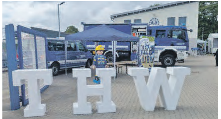
Das THW zum Voßberg Tag 2025.