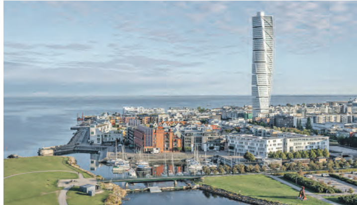
Die südschwedische Hafen-Metropole Malmö am Öresund entdecken unsere Gäste bei der großen Stadtrundfahrt

Fehmarnsundbrücke und die Passage der Vogelfluglinie mit den SCANDLINES-Großfähren nach Rödby, weiter über 4 dänische Inseln und über die 3 kilometerlange Storströmen-Faro-Brücke Kurs Kopenhagen. Sodann folgt der absolute Höhepunkt der Tour mit dem Top-Erlebnis der Reise mit der Passage der 16 Kilometer langen Öresundbrücke zwischen Dänemark und Schweden mit Kurs Malmö, wo unsere Leser die