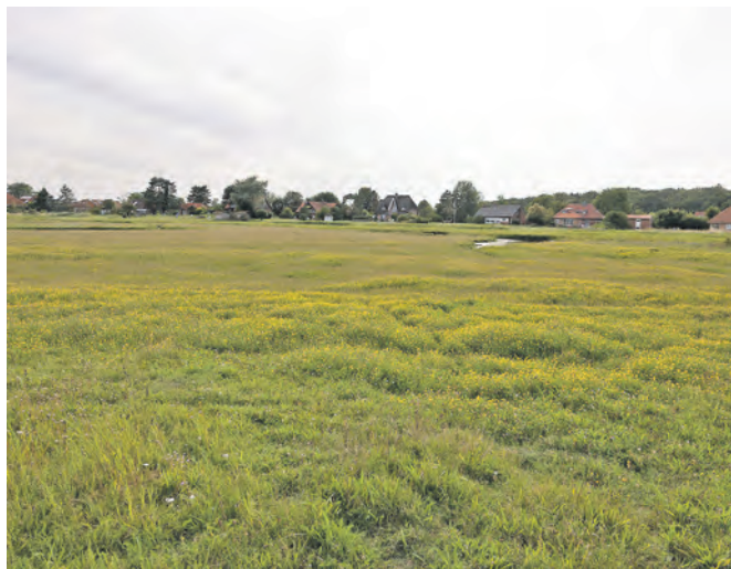
„Blühende Artenvielfalt im Naturschutzgebiet Sehlendorfer Binnensee bei Hohwacht“

enthalten sind“, sagt die Exkursionsleiterin. Sie möchte anregen, dies im eigenen Garten zu probieren und damit gleichzeitig ein Paradies für Insekten und Schmetterlinge zu schaffen. Die Exkursion mit anschließendem Kaffee-Klönssnack und kleinen Kräuterköstlichkeiten findet am 10. Mai um 10 Uhr statt und soll etwa 2-3 Stunden dauern. Der Treffpunkt wird bei Anmeldung bekannt gegeben. Email: nsg-sehlendorf@nabu-luetjenburg.de oder Tel: 0151-152 570 78.