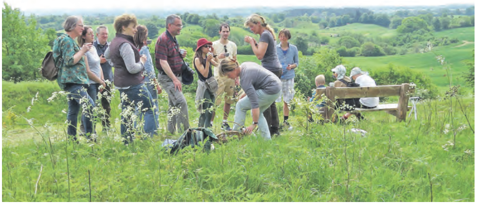
„Kräuterwanderung im herrlichen Nienthal“