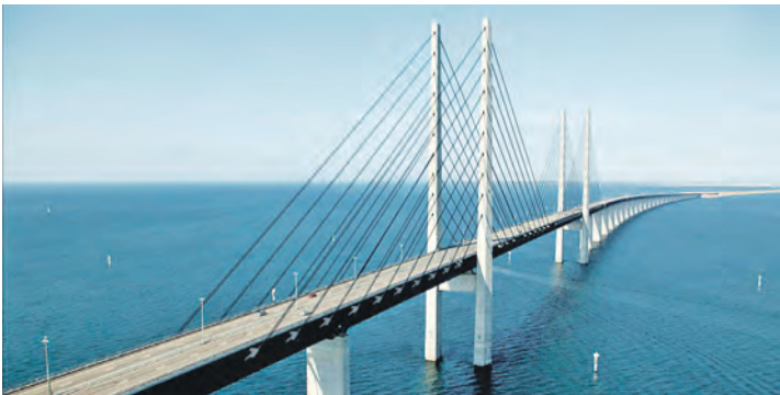
Hautnah genießen unsere Leser:innen die gigantische Öresund-Brücke zwischen Kopenhagen und Malmö

südschwedische Metropole am Öresund bei der großen Stadtrundfahrt mit allen Höhepunkten mit unserem fachkundigen Reiseleiter Jan Bütje hautnah entdecken und die anschließende Freizeit zum Stadtbummel genießen können. Die Rückfahrt erfolgt auf gleicher Strecke mit nochmaliger Passage der Öresundbrücke, die Rückkehr erfolgt gegen 20 Uhr. Zum großen Leistungspaket der Sonderfahrten am 26. Juni 2026