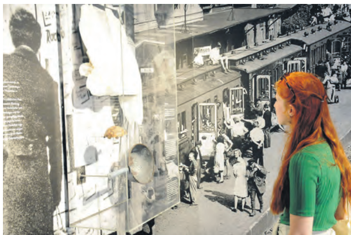
Ausstellungen entdecken - das Haus der Geschichte in der Königsberger Straße.