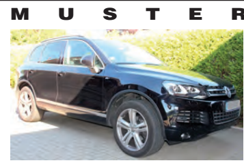
ausschließlich für PRIVATE Kleinanzeigen

Für eine PRIVATE Kleinanzeige in Farbe berechnen wir Ihnen nur 5,- € Aufschlag. (Farbe: Rot, Blau, Grün)