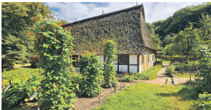
Historische Häuser und Gärten entdecken - Pringens Hof.

Freilichtmuseum zu Kiekeberg ( www.kiekeberg-museum.de ). Dort erhalten die Teilnehmer in einem geführten Rundgang durch das „lebendige“ Museum einen Eindruck des ländlichen Lebens in der Lüneburger Heide von