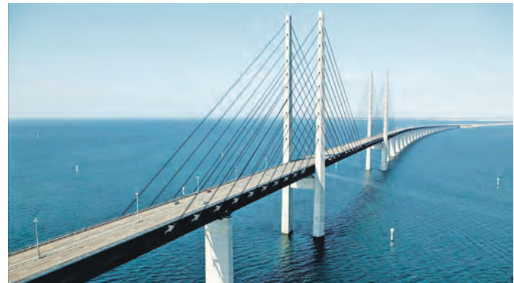
Verbindet Dänemark mit Schweden: Das Jahrhundert-Bauwerk der Öresundbrücke

sagen auf Hin- und Rückfahrt mit Scandlines-Großfähren auf der Vogelfluglinie sowie die Hin- und Rückfahrt über die weltberühmte Öresund-Brücke, sodann drei Übernachtungen im Best-Western-First-Class-Hotel (Landeskategorie) im Süden von Stockholm mit dreimal Schlemmer-Frühstück vom Buffet und die große Stadtrundfahrt Stockholm mit fachkundiger Reiseleitung und natürlich viel Freizeit