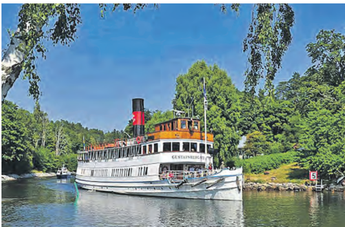
Fotostopp am weltberühmten Göta-Kanal, der Stockholm und Göteborg quer durch das Land verbindet

tag von 9 bis 13 Uhr, per Telefon 04521/701130 oder direkt online im Internet unter „leserreisen.der-reporter.info“.