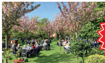
Foto-Motiven im pulsierenden Welthafen. Nach dem Altländer Mittagessen in Jork erwartet Sie das so beliebte Kirschen-Fest mit großem Kirschen-Markt direkt im Ort.

Schlemmen & Genießen zum romantischen Kirschen-Fest in Jork im Herzen des „Alten Landes“ inklusive Mittagessen und Obsthof-Besichtigung. Top-Erlebnis Elbe-Schiffahrt auf der Anreise von Hamburg bis Finkenwerder mit den modernen Hadag-Hafenfähren als kleine Stadtrundfahrt auf dem Wasser mit vielen spannenden