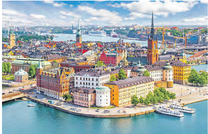
Ein Sommertraum: Die malerische Altstadt von Stockholm, umgeben vom Wasser

Kanal“, der die Städte Göteborg und Stockholm verbindet. Zum großen Leistungspaket unserer großen Verlags-Sonder-Reise gehören neben der Fahrt im erstklassigen Fernreisebus ab Lütjenburg, Lensahn und Oldenburg die zwei Fährpas-