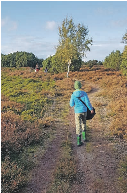
Kinder sollten genügend Zeit bekommen, ihre Umwelt in Ruhe zu entdecken.

Die ERNA-Mitarbeiter erleben es häufig, dass Kindern die Fantasie fehlt. Bei gebuchten ERNA-Aktivitäten stehen manche Kinder oft ratlos dabei und brauchen eine Anleitung – es wird nicht mehr