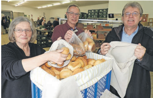
Werden bei der Eutiner Tafel Brötchen in Plastiktüten gespendet, werden sie in Leinenbeutel umgepackt und weitergegeben.