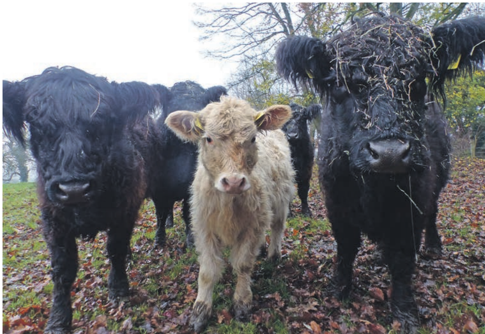
Der Kleine hier in der Mitte ist ein Weideunfall – Galloways sind in der Regel schwarz und wuschelig, leben eigentlich im Südwesten Schottland und sind, wie man sieht, zurückhaltend, aber freundlich. Zudem sind sie nicht nur ausgezeichnete Landschaftspfleger sondern liefern auch hochwertiges, sehr köstliches Fleisch.