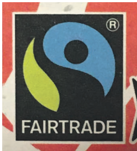
Das Fairtrade-Siegel bürgt dafür, dass das Produkt wie auch seine Rohstoffe unter fairen Bedingungen hergestellt wurde.

Noch immer werden in vielen Ländern der Welt Arbeitskräfte ausgebeutet, Bauernfamilien kommen mit ihrem Ertrag kaum über die Runden und Kinder arbeiten von früh bis spät, anstatt zur Schule zu gehen, damit wir in den reichen Industrieländern auch exotische Produkte wie Kakao, Kaffee, Bananen, und Baumwolle, aber auch alltägliche vermeintlich bedenkenlose Produkte wie Wein, Honig, Zucker und Rosen möglichst günstig und in großen Mengen zur Verfügung haben. Fairtrade, in Deutschland durch die 1992 gegründete Initiative TransFair e.V. vertreten, setzt sich für fairen Handel, angemessene Löhne, sowie ökologische und ökonomische Standards ein und markiert entsprechende Produkte für den Konsumenten deutlich sichtbar mit einem Fairtrade-Siegel.