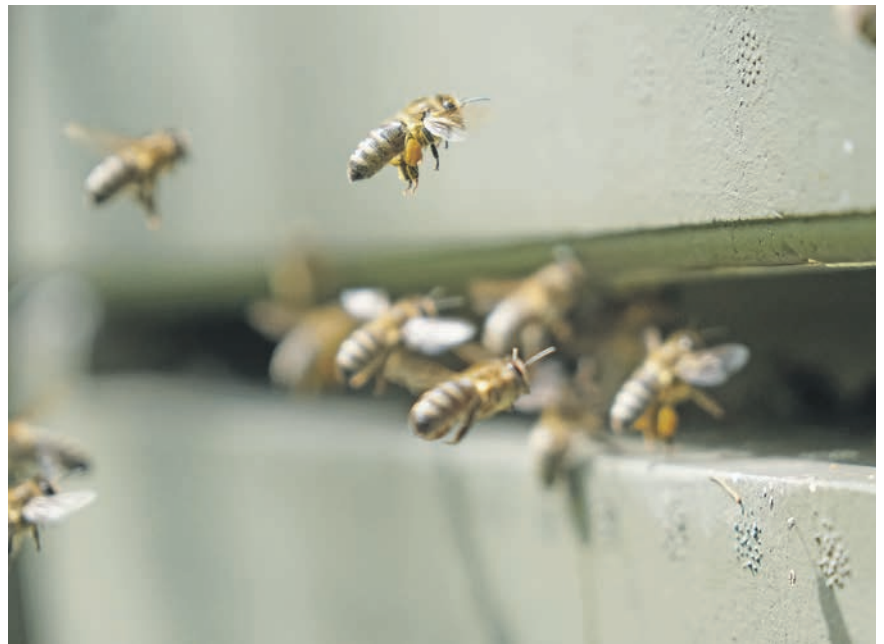
Fleißige Bienen im Anflug: In ihrem bis zu sechs Wochen langen Leben produziert eine Honigbiene zwei Teelöffel Honig.

Neben der Honigbiene, die im Bienenstock ihres Imkers lebt, existieren in Deutschland zudem rund 560 Wildbienenarten – davon 296 Arten leben nicht im Verbund, sondern als Einzelgänger. Das Weibchen baut allein ein Nest mit Brutzellen und versorgt in ihrem knapp sechs Wochen langen Leben nacheinander bis zu 30 Larven. Dennoch: Rund 50 % der Wildbienen werden bei uns als zum Teil stark gefährdet eingestuft und befinden sich