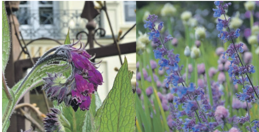
Pflegeleichter, bienenfreundlicher und hübscher als ein Wimbledon-Rasen: Ein Staudenbeet mit Katzenminze, Beinwell und Co.

gar eine Nistmöglichkeit, kein Wurm würde sich in ein Beet voller Kies wagen. Ähnlich verhält es sich mit dem vermeintlich pflegeleichten Rasen, der, ist er überhaupt erstmal lückenlos und sattgrün angelegt, sein wahres Gesicht offenbart: Er will nicht nur jede Woche gemäht, zweimal im Jahr vertikutiert und gedüngt und