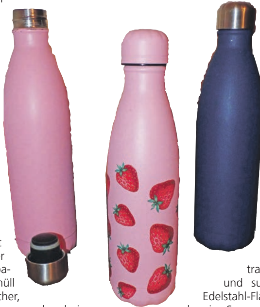
Heiß geliebt und wirklich mitgenommen: Edelstahlflaschen voll mit frischem Leitungswasser.

und Co mitzunehmen. Hier sind ein paar Tipps, wie Sie Verpackungsmüll und Plastikverbrauch ein bisschen reduzieren und auch noch Spaß haben dabei.