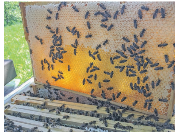
Eine verdeckelte Honigwabe im Rahmen vor der Ernte. Für einen Kilo Honig fliegt ein Bienenvolk drei bis fünf Millionen Blüten an.