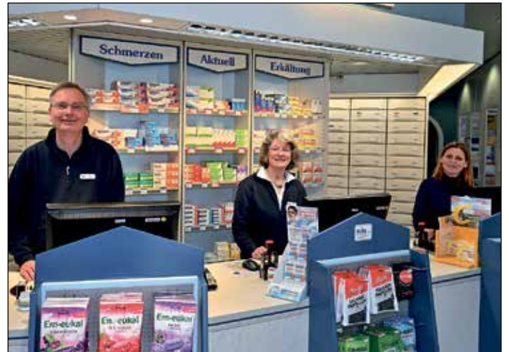
Das Team der Schlossapotheke hat auf einen zweigeteilten Schichtdienst umgestellt, denn wer sich nicht begegnet, kann sich auch nicht gegenseitig infizieren.