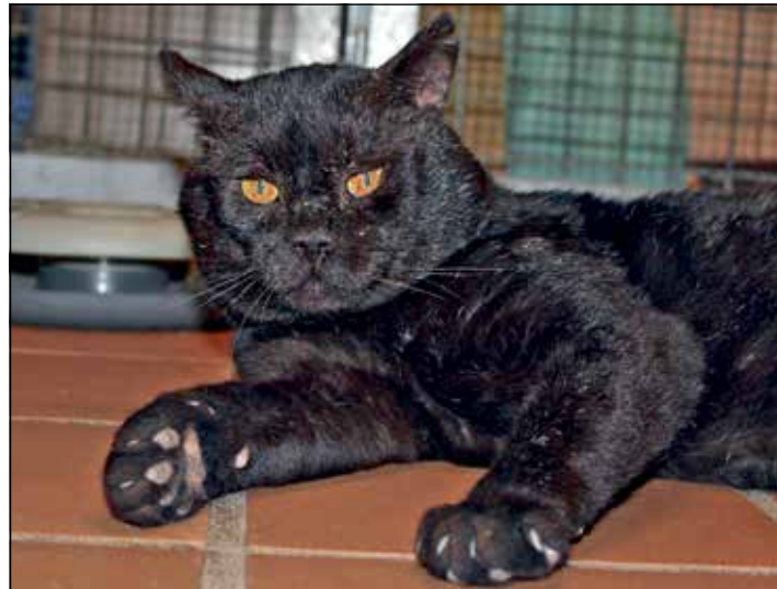
... und Toni.

mal nicht so an.“ Hach ja, Toni ist einfach der coolste Kater von Kossau!