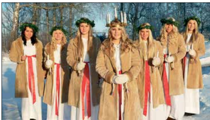
Den großen Lucia-Festumzug in Malmö genießen unsere Leser zum traditionellen schwedischen Lichterfest.

Pretz/ Plön (t). Auf der Weihnachtsstraße Kurs Skandinavien reisen unsere Leser zu zwei der schönsten Weihnachtsmärkte im Norden mit dem absoluten Höhepunkt des weltberühmten Lucia-Lichterfest in der romantischen Weihnachtsstadt Malmö, das jeweils am 13. Dezember eines Jahres besonders stilvoll und opulent in der südschwedischen Metropole am Öresund gefeiert wird, wo Lucia an den Ufern des Öresundes mit ihrem Gefolge anlandet und als Lichterkönigin mit Ihrem Gefolge, weiss gekleidet und mit fantastischen Lichterkronen geschmückt, zur festlichen Lucia-Feier im Herzen der Stadt auftritt. Gemeinsam mit Chören, Sternsängern und Kutschen formiert sich zudem ein Festzug durch die Strassen der Stadt und traditionelle Weihnachtslieder erklingen. Die Gäste der Reporter-Leser-Reisen haben während einer besonders preisgünstigen Sonder-