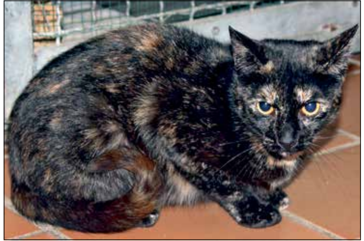
Suchen liebevolle „Katzenversther“, die auf sie eingehen: Bonny...

An der B430 · 24306 Kossau/Lebrade · Tel. 04522 / 2389