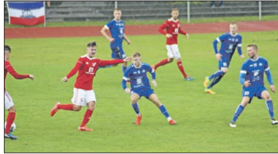
Preetzer Teamwork bringt einen Zähler beim Spitzenreiter