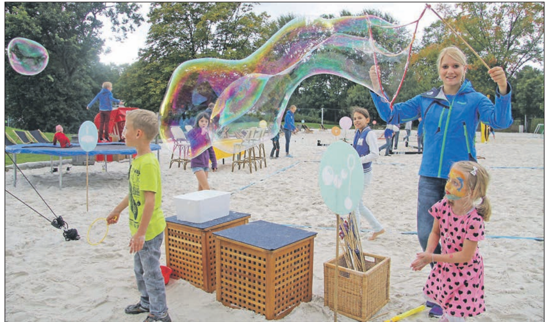
Wer macht die größten Seifenblasen?

Um große fliegende Seifenblasen zu erzeugen, gibt es die erforderlichen Materialien und Seifenblasenringe vor Ort. Für ein gutes Gelingen ist das persönliche Fin-