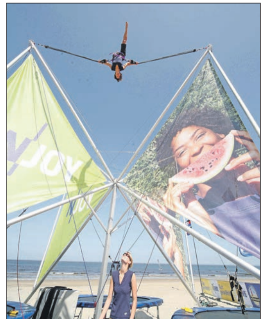
Spielmacher aus Laboe schickt große und kleine Besucher in die Lüfte.

Die Sprungstation „Quattro High-jump“ lädt zu wahren Höhenflügen ein. Die Sprungeinrichtung hat es „in sich“ und ist bekanntlich nichts für schwache Nerven. Bis zu neun Meter Höhe können die Teilnehmer beim Springen erreichen und dazu noch gemeinsam in die Luft gehen: Bis zu vier Springer können gleichzeitig hüpfen. Für ihren spektakulären Höhenflug werden sie mit Gummiseilen gesichert – und los geht’s.