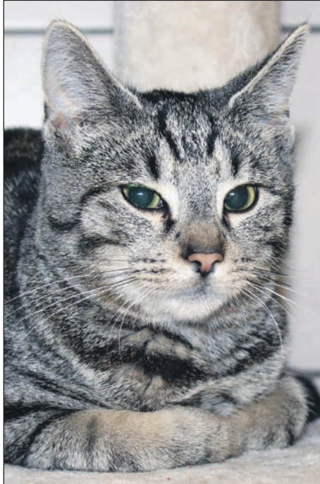
Ein kuscheliges Duo: Nicky...

Kossau/ Lebrade (t). Auch in dieser Ausgabe wollen wir Ihnen wieder tolle Bewohner des Tier-