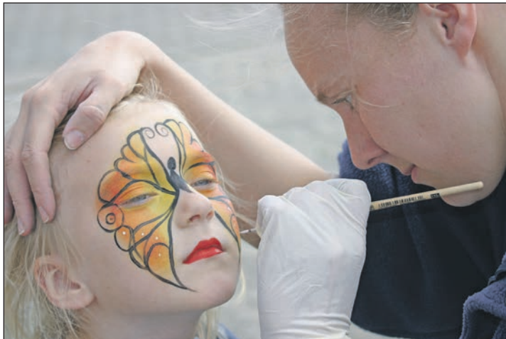
Verwandelt: Mit ein bisschen Farbe im Gesicht werden Kinder zu Schmetterlingen

Mit Pinselstrich und schönen Tönen bringen die Künstler an der Schminkstation zauberhafte