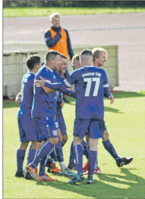
Drei weitere Landesligapunkte für den Preetzer TSV.

Zu verlieren haben die Schusterstädter eigentlich nichts, Punkte sollen natürlich trotzdem her. Tipp: Man trennt sich Unentschieden. Auch die Verbandsliga ist im Spielmonat November angekommen. Dies bedeutete aber auch: Langsam muss man sich wohl auf die ersten Spielauffälle einstellen. In der Hoffnung, dass das Antrreten am Wochenende noch komplett ausgetragen wird, hier die Duelle: Am Samstag um 13 Uhr eröffnet Concordia Schönkirchen die Spiele mit seinem Heimauftritt gegen die SG aus Dobersdorf und Probsteiheragen. Während Cordi das mit Abstand treffsicherste Team, ist, hält man sich bei der Spielgemeinschaft doch ein wenig zurück. Wichtig für