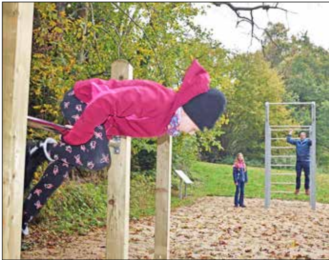
Rad schlagen, Aufschwung üben oder Klimmzüge für den Biceps zählen: Die Sandkuhle bietet für Fitness und Sport viele Möglichkeiten, ist aber zugleich ein Ort zum Spielen.

Noch ist die Anlage in der Sandkuhle nicht komplett ausgestattet: Eine marode Schaukel, die anlässlich ihres Zustands bei den Baumaßnahmen bereits entfernt wurde, soll 2023 durch ein Nachfolgemodell ersetzt werden, verspricht Henningsen.