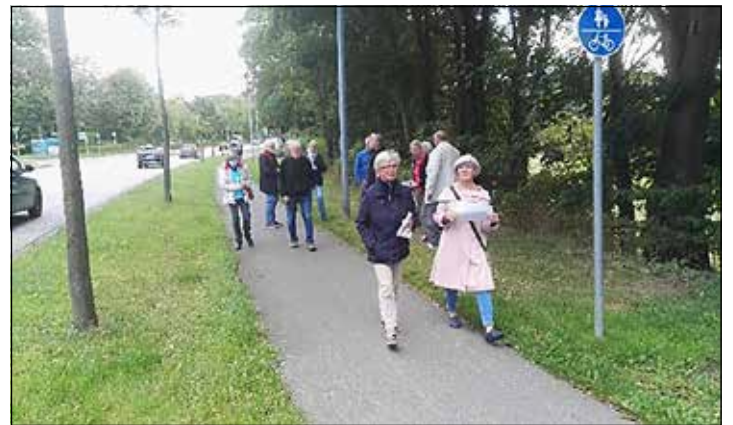
Die Spurensucher bei einer Ortsbegehung in der Rautenbergstraße auf Höhe des Stadtwäldchens.

aus Richtung der Stadtmitte - vor dem Bau der Umgehungsstraße noch der Eutiner Straße als ursprüngliche Ortsdurchfahrt an. Das letzte Haus auf der Seeseite wurde Anfang der 1960er Jahre auf dem Steilhang zum Stadtwäldchen hin erbaut. Zu diesen gut 30 Häusern auf dieser Straßenseite haben die Spurensucher