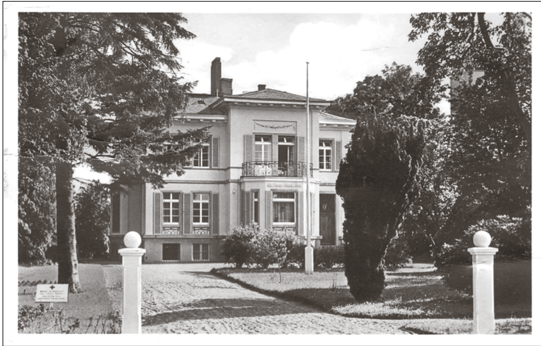
Diese prächtige Villa wurde 1968 für Wohnblöcke, Parkplätze und Garagen abgerissen.

Plön (t). Die Spurensucher an der Kreisvolkshochschule Plön haben als Zeitzeugen schon zu vielen Plöner Häusern und Straßen Erinnerungen an Bewohner und Betriebe zusammengetragen. Nun hat die Arbeitsgruppe ihre Ergebnisse zur Seeseite der Rautenbergstraße fertig gestellt. Es erscheint als 44. Band der kreisweiten Projektreihe und als