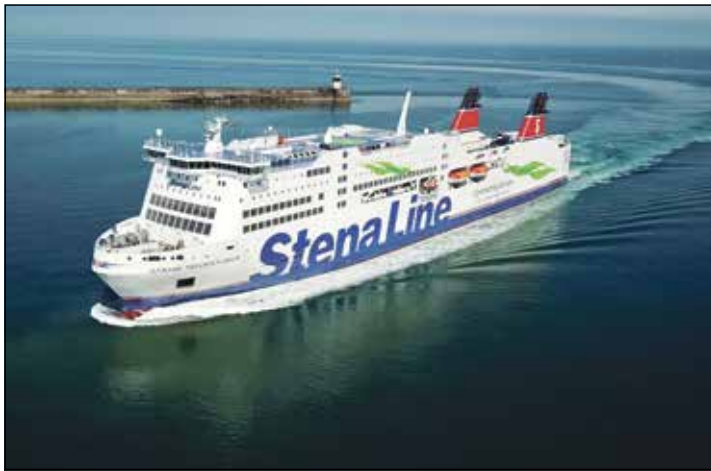
Mit dem Reporter in den Weihnachtsferien zum Superpreis von nur 119,90 auf Schweden-Kreuzfahrt nach Göteborg.

Anmeldungen sind ab sofort möglich im Reporter-Verlagsbüro des Burg-Verlages in Eutin, täglich von 9 bis 13 Uhr, per Telefon 04521-701130 oder direkt per Mail unter leserreisen@der-reporter.info .