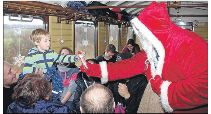
Wieder in Aktion: Der Nikolaus fährt mit der Schönberger Museumsbahn mit.

gemütliche Tour durch die Landschaft. Prominentester Fahrgast ist dabei der Nikolaus. Und der hält für alle Mitfahrer zwischen 3 und 14 Jahren sogar eine kleine Überraschung bereit. Der Ausflug mit der Museumsbahn hat eine Dauer von rund 45 Minuten und endet wieder in Schönberger Strand am Bahnhof. Dort besteht auch die Möglichkeit zu einer Fahrt mit einer der historischen Straßenbahnen, die vor Ort über das Museumsgelände kreisen. Die Nikolausfahrt kostet 7 Euro pro Fahrgast. Der Preis gilt ab 3 Jahren. Begleitete jüngere Kinder - unter 3 Jahren - fahren ohne Sitzplatzanspruch kostenlos mit. Info: Die Museumsbahnen bieten über den Link Adventsfahrten die Möglich-