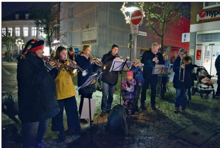
Der Posaunenchor der evangelischen Kirchengemeinde begleitete die vielstimmig gesungenen Weihnachtslieder