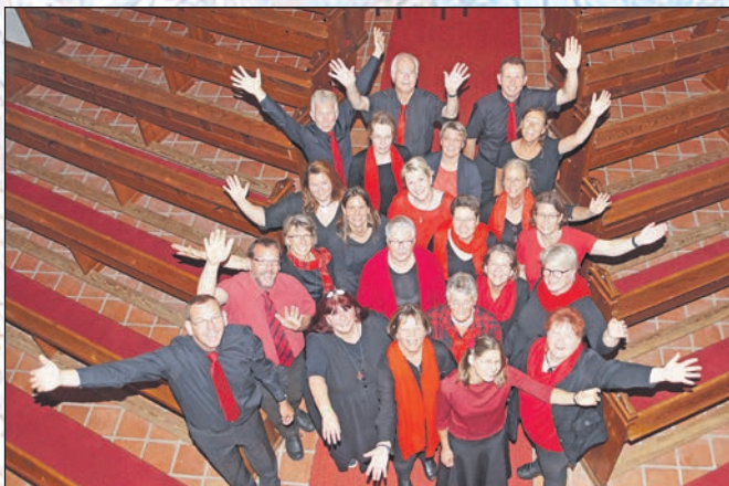
Musikalische Weihnachtsfreude: Giekauer Gospelchor Joyces singt am 2. Advent.

res Programm vorgenommen. „Auf unserem Chor-Wochenende Anfang November haben wir einige neue Stücke erarbeitet, die richtig swingend und mitreißend sind“, freut sich der