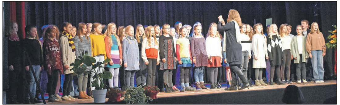
Die Chöre aus Unter- und Mittelstufe stimmten „Hall of fame“ an.