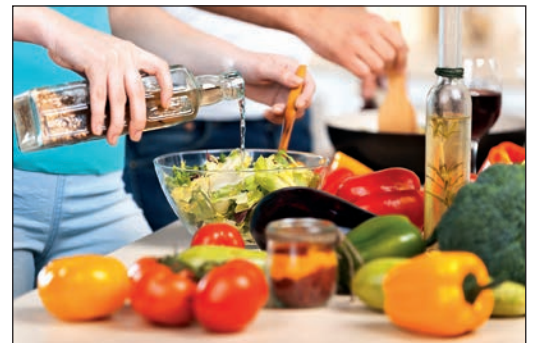
Das neue AOK-Kursprogramm gibt wertvolle Inspirationen für die Gesundheit.

im neuen Kursprogramm zum Beispiel ‚Fingerfood- Leckere, Snacks für die Party‘ und den Workshop ‚Achtsamkeit‘. Zusätzlich gibt es Online-Vorträge zu den Themen ‚Müssen Sportler anders essen?‘ oder ‚So bleibt der Darm gesund‘ und ‚Wenn weniger mehr ist: Zusatzstoffe in Lebensmitteln‘. Auch hier kann sich jeder bequem von zu Hause per Internet dazu schalten und Neues erfahren. Die Gesundheitskasse hat darüber hinaus ihre Kooperation mit dem Online-Kursanbieter Cyberfitness erweitert: Jeder, der an einem mehrwöchigen Präventionskurs teilgenommen hat, bekommt kostenlos den Online-Premium-Fitnessclub für ein halbes Jahr, um weiter aktiv zu bleiben. Alle AOK-Präventionsangebote sind exklusiv und kostenfrei für AOK-Kundinnen und –Kunden. Sie werden von qualifizierten Fachkräften geleitet. Das neue Kursprogramm ist im Internet unter aok.de/nw abrufbar oder kann beim AOK-Kursteam unter der Telefonnummer 0800 2655-185229 angefordert werden. Kursanmeldungen sind ebenfalls bei dem AOK-Kursteam ab sofort möglich.