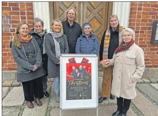
Werben für die Benefizveranstaltung „Home for Christmas“: Die Mitglieder des ambulanten Hospizvereins Lütjenburg.

Mit dem Ziel „Helfen für die Helfer“ geht ein Teil des Erlöses aus dem Kartenverkauf und dem Ver-