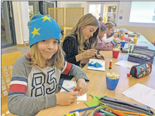
Kinder werden kreativ beim Pop-up-Workshop.

Preetz (t). Pop-up-Workshops, ein Leseclub sowie Netzwerktreffen für Ehrenamtliche stehen auf der Agenda der Preetzer Initiative, die sich für das Lesen einsetzt und Kindern die Welt der Bücher öffnen