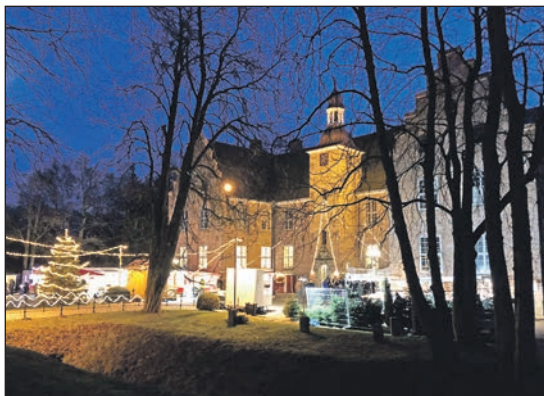
Stimmungsvolle Adventszeit: An den Wochenenden (3., 4., 10. und 11. Dezember) öffnet der Weihnachtsmarkt im und am Herrenhaus Schloss Hagen in Probsteierhagen.

Für die Kinder hat sich extra der Weihnachtsmann angemeldet, der sich jeweils um 14 Uhr auf dem Schlossvorplatz gerne Gedichte und Weihnachtswünsche der kleinen Besucher anhört (es gibt auch eine kleine Belohnung...).