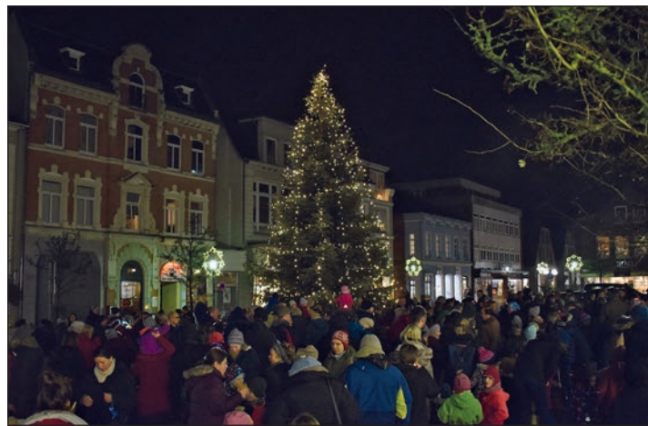
Beim traditionellen Anleuchten läuteten Groß und Klein feierlich die Adventszeit ein

Preetz (tg). Mit dem traditionellen Anleuchten des großen, mit selbstgebasteltem Schmuck verzierten Tannenbaums auf dem Marktplatz und dem Singen bekannter Weihnachtslieder wurde die Adventszeit auch in der Schusterstadt feierlich eingeleitet. Für die passende musikalische Begleitung sorgte wieder der Posaunenchor der evangelischen Kirchengemeinde. Bei heißem Punsch, stiehlt über dem offenen Feuer erwärmt, und kleinen Snacks kamen Freunde, Familien und Bekannte miteinander ins Gespräch. „Der Baum wurde wirklich auf den letzten Drücker beschafft“, berichtete