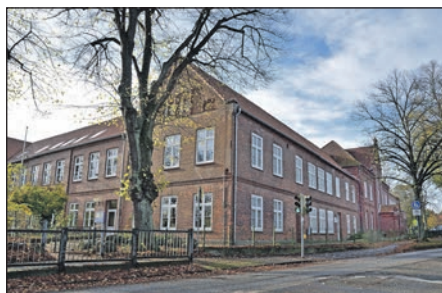
Der Vortrag „Tee aus Indien“ findet am 6. Dezember in den Schulen am Hufenweg in Preetz statt und beleuchtet eine spannende Wirtschafts- und Kulturgeschichte.