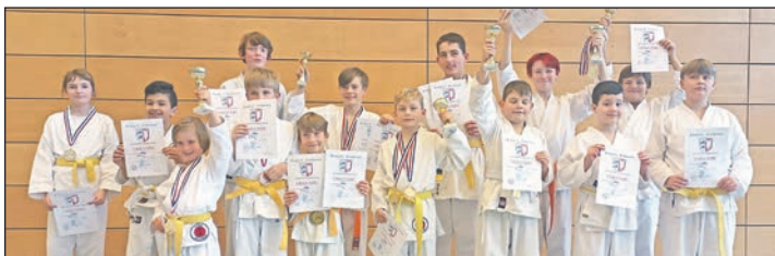
Freude über sportliche Erfolge bei den Teilnehmern des Adventsturniers in Eckernförde.