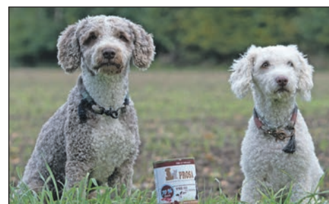
Elli und Teyo würden PROSA empfehlen.