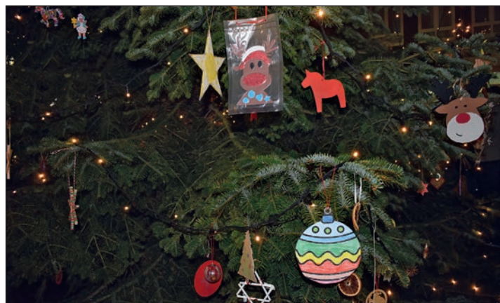
Mit selbstgebastelten Sternen, Tieren und Kugeln wurde die große Tanne auf dem Marktplatz bunt verziert