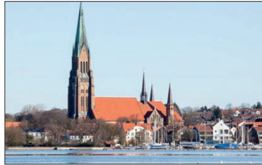
Das Gotteshaus wird zum großen Weihnachtsmarkt: Unsere Leser im berühmten Dom an der Schlei in Schleswig besonders stimmungsvolle Vorweihnachten mit vielen Ständen und weihnachtlicher Musik.

führt der Kurs Nord weiter zum berühmten Dom in Schleswig, wo ein traumhafter Weihnachtsmarkt im Herzen des großen Gotteshauses mit vielen weihnachtlichen Ständen aus Dänemark und Deutschland die Besucher begeistern wird. Am Nachmittag