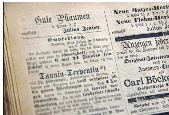
Sie beleuchtet damalige Gebräuche und Gepflogenheiten: die viel versprechende Werbung aus längst vergangenen Jahrzehnten.