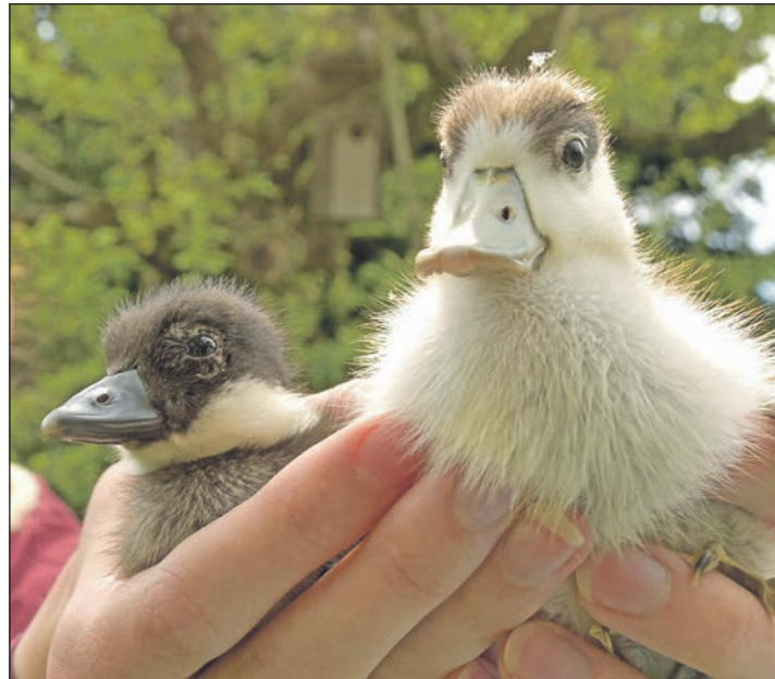
Sie erhalten in Preetz eine zweite Chance: verwaiste oder verunglückte Küken ebenso wie geschwächte Igel. Unter anderem im Rahmen der Kooperation der BUND Umweltberatungsstelle Preetz mit dem Wildtierheim Preetz, die sich für Umweltbildung einsetzen, engagieren sich viele Jugendliche für Tiere und Naturschutz.

Die Heikendorfer Gruppe hat in den vergangenen Jahren zwei größere Projekte mit Unterstützung von BINGO durchgeführt: den Heikendorfer Wasserweg und das Grüne Klassenzimmer auf der Bulach'schen Wiese. Die Gruppen in Preetz und Lütjen-