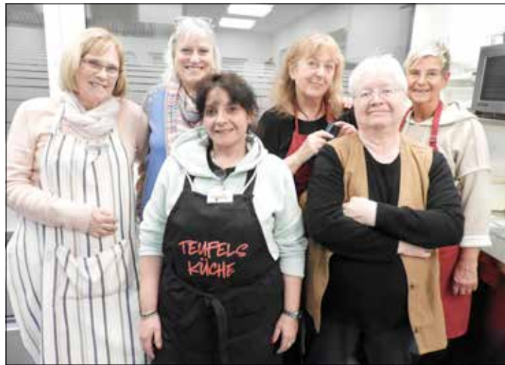
Gemeinsam essen, lachen, trauern – das ist das Konzept von „Trauer & Klöße“.

Eutin (aj). „Immer dem fröhlichen Lachen nach!“ – so könnte die Wegbeschreibung lauten für Menschen, die sich zum ersten Mal zur Kochgruppe der Eutiner Hospizinitiative angemeldet haben und nun an der Tür der Diakonie-Tagespflege im Eutiner Ebereschenweg stehen. Fröhliche Geschäftigkeit, ein lockerer Spruch gehören hier genauso dazu wie das Salz in der Suppe. Nicht umsonst haben sich die Initiatorinnen vor gut einem Jahr einen Namen für ihr Angebot überlegt, der nicht bierernst daherkommt, sondern ein Augenzwinkern inklusive hat: „Trauer & Klöße“ heißt die Gruppe, die sich einmal im Monat trifft, um gemeinsam zu schnippeln und zu genießen, zu lachen und zu weinen. An diesem kalten Januarabend wird ein Griechischer Salat die Vorspeise sein. Und so buntgemischt wie der knackige Mix in der Vorspeisenschale ist auch die Runde, die hier in