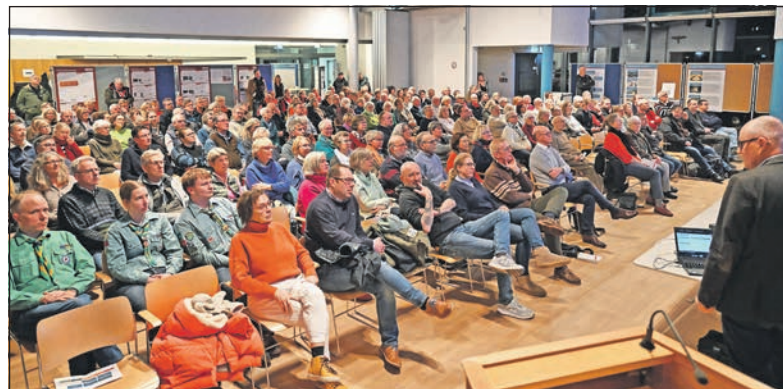
Die Infoveranstaltung zum Marken- und Leitbildprozess lockte zahlreiche Besucher in die Aula Am Schiffsthal.