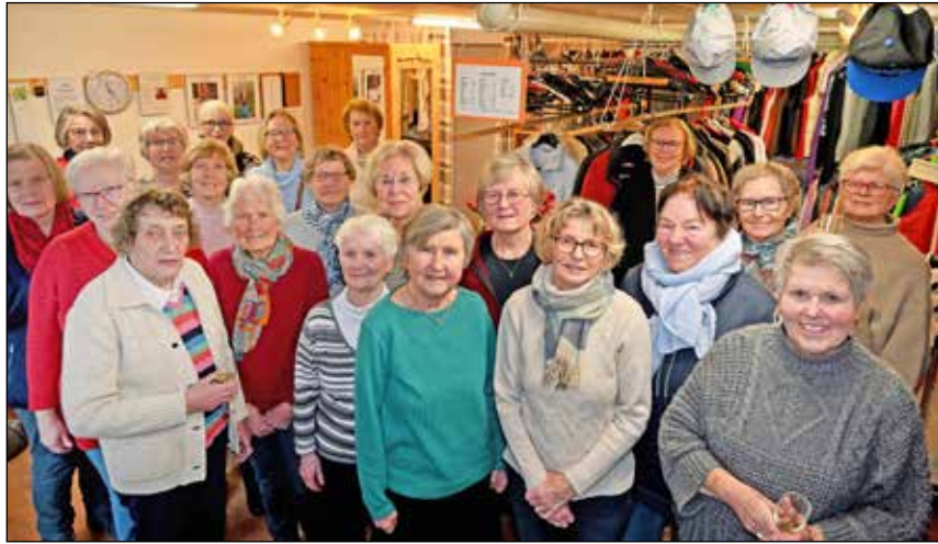
40 Jahre „Kleidergarage“- den Anlass nutzten die Plöner Ehrenamtler für eine zünftige Feierstunde.

Seit vier Jahrzehnten ist die „Kleidergarage“ eine feste Institution innerhalb der Evangelisch-Lutherischen Kirchengemeinde Plön und