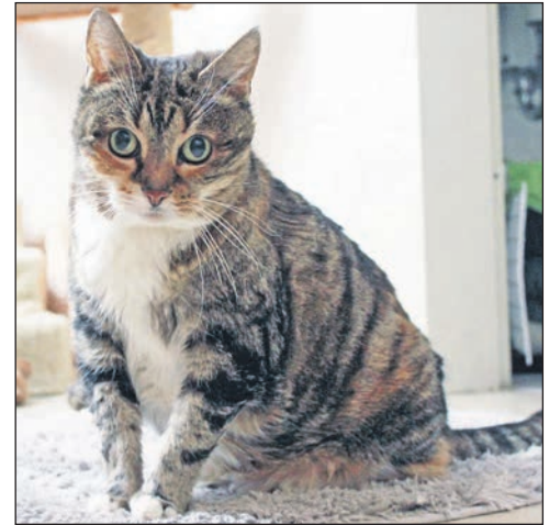
... Katzendame Tamy dagegen kann man als richtige Plaudertasche bezeichnen.

An der B430 • 24306 Kossau/Lebrade • Tel. 04522 / 2389