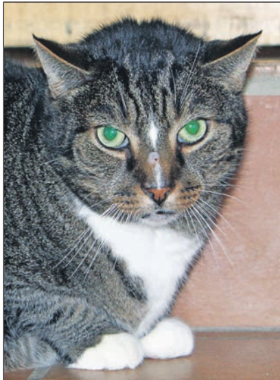
Kater Felix ist ein echter „Grummelmatz“ ...

Kossau (t). Auch in dieser Ausgabe stellt „der reporter“ den Lesern wieder tolle Bewohner des Tierheims Kossau-Lebrade vor, die ein neues und liebevolles Zuhause mit großem Garten suchen. Den Anfang macht Kater Felix. Er ist ein wunderschöner, grau-