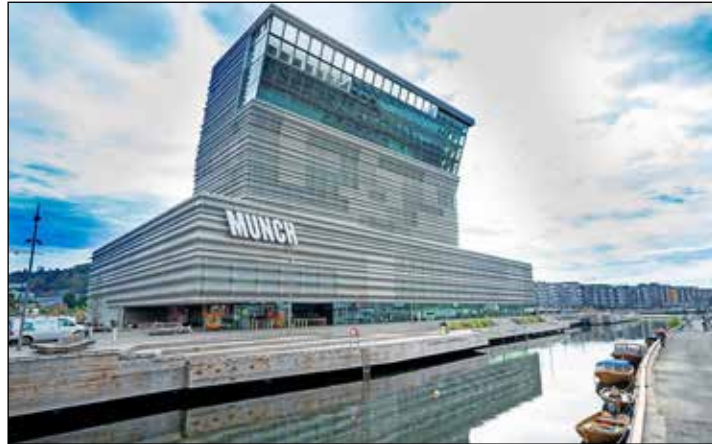
Das neue Munch-Museum in Oslo gilt als derzeit spektakulärstes Kunstmuseum der Welt.

Plön/Preetz (t). 27.000 Gemälde, 13 imposante Geschosse in einmaliger Lage am Hafen und Opernhaus und 280 Millionen Baukosten: Nur mit absoluten Superlativen ist das frisch eröffnete Munch-Museum in Oslo zu beschreiben. Die Reporter-Leser-Reisen präsentieren nunmehr aufgrund sehr großer Nachfragen weitere viertägige Sonderreisen für Kunstfreunde. Mit dem Reiseveranstalter Color Line geht es an zwei Terminen ab Kiel direkt ins frühlingshafte Oslo: vom 8. bis 11. April 2024 in den Osterferien und vom 13. bis 16. Mai 2024. Während der Überfahrten genießen unsere Gäste echtes „Kreuzfahrt-Feeling“ mit den Super-Luxus-Schiffen des Nordens und den abendlichen Bordshows mit Live-Musik auf Broadway-Niveau. Die Reporter-Leser gehören damit zu den bevorzugten Gästen des sensationellen Museums, das weltweit für Furore sorgt. Unsere Gäste können ohne Warteschlangen mit festem Zeitfenster das Mu-