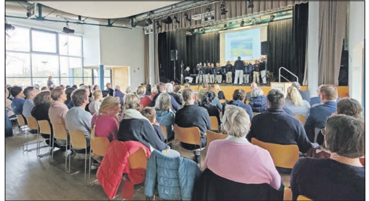
Zahlreiche Plöner kamen zum Neubürgerempfang, um sich über die Stadt und ihre Angebote zu informieren.

Wasser und zu der Landeshauptstadt. Viel unternommen und die Stadt richtig kennengelernt haben sie noch nicht, was sich aber bald bei frühlingshafterem Wetter ändern soll. Das junge Paar plant unter anderem einen Ausflug zum Schloss mit anschließender Führung und mehrere Spaziergänge in der besonderen Landschaft Plöns. Zufrieden sind sie mit ihrer neuen Wahlheimat sehr, dennoch hätten beide gerne noch ein ausgeprägteres Nachtleben vor Ort. Um neue gleichaltrige Menschen kennenzulernen, kommen sie gerne zum