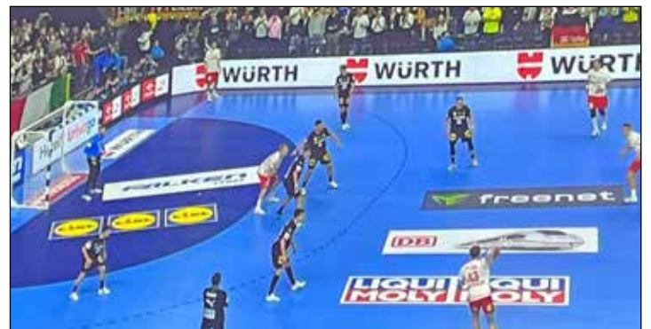
Auch das Halbfinal-Aus verfolgten wieder viele am Kieler Bahnhof.

schluss. Mehr war aber nicht drin. Damit verpasste das Team von Alfred Gislason in Köln nicht nur die Bronzemedaille, sondern auch die direkte Qualifikation für die Olympiade in Paris, hat aber noch die Chance sich in den Quali-Turnieren als Nachrücker durchzusetzen. Einen Schockmoment gab es, als in der Halle ein Besucher medizinisch versorgt werden musste. Das Spiel wurde unterbrochen, sowohl der Teamarzt der Schweden, als auch der der Deutschen eilten herbei. Der Vorfall ging aber