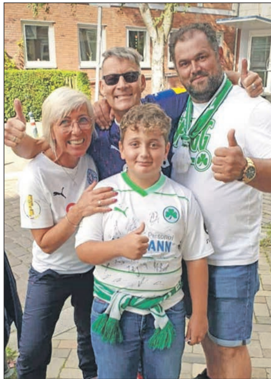
Keine Rivalität: Kieler und Fürther Fans.

Damen von Fortuna Bösdorf. Dabei hatte es in der Hinrunde des Turniers eher nach einem Erfolg der SG Kalübbe/Bosau/Sarau (7 Punkte) ausgesehen, die mit sieben Zählern die Tabelle anführte. Zu diesem Zeitpunkt hatten die Fortuna-Mädels bereits das Match gegen den Tabellenführer mit 0:2 abgeben müssen und lagen mit sechs Pluspunkten „nur“ auf Position zwei. Dahinter folgten der SV Knudde Giekau (3) und der SV aus Boostedt (1). Auch wenn Bösdorf im Laufe der Veranstaltung immer besser wurde, der Pokalsieger stand vor dem letzten Spiel der Spielgemeinschaft fast schon fest. Mit einem Remis oder sogar einer knappen Niederlage konnte der Landestitel eingetütet werden. Doch die