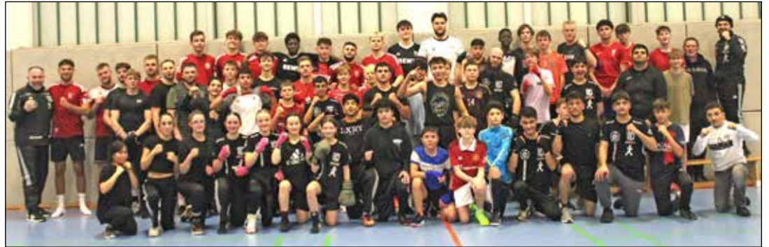
Die 16-köpfige 1. Mannschaft der FT Preetz und die ebenso mit 16 Spielern vertretende C-Jugend des JFV sowie das Team des Boxclub Preetz absolvierten ein anstrengende Trainingseinheit. Weitere Termine sind bereits besprochen.

Die 1. Herrenmannschaft der Freien Turnerschaft Preetz und die C-Jugend des Jugend Fördervereins Preetz tauschten ihre Fußballschuhe vorübergehend gegen Boxhandschuhe, als sie sich im Boxclub Preetz ein intensives Training