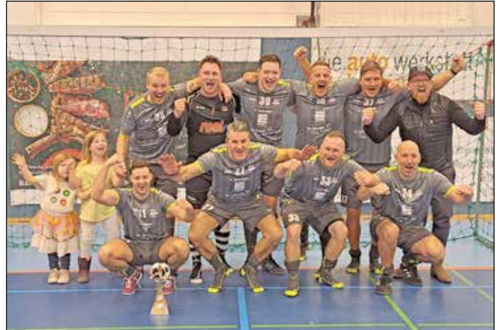
Das Sponsoren-Team hat den „Budenzauber“ in der Blandford im Neun-Meter-Schießen gewonnen.

te die Veranstaltung vor einigen Jahren mitinitiiert, um aus den Erlösen Projekte der Fußballabteilung unterstützen zu können. „Wir helfen zum Beispiel, wenn bei der Infrastruktur geholfen werden muss, wenn Lehrgänge für Schiedsrichter oder Trainingslager für Fußballkinder finanziell gefördert werden müssen“, erläutert Donath-Totzke. Warum der Budenzauber so viele Leute begeistert? „Unser Erfolgsgeheimnis ist, dass hier Mannschaften spielen, die sonst nicht so im Fokus stehen – ob nun das Schüler-Lehrer-Team