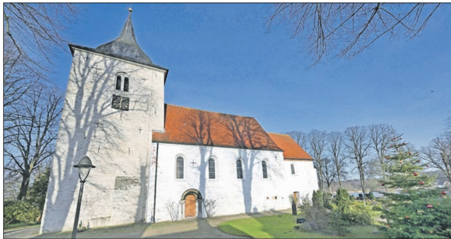
Sie gilt als „kleinster Dom der Welt“ und wurde im 12. Jahrhundert erbaut: Die Petrikirche zu Bosau.